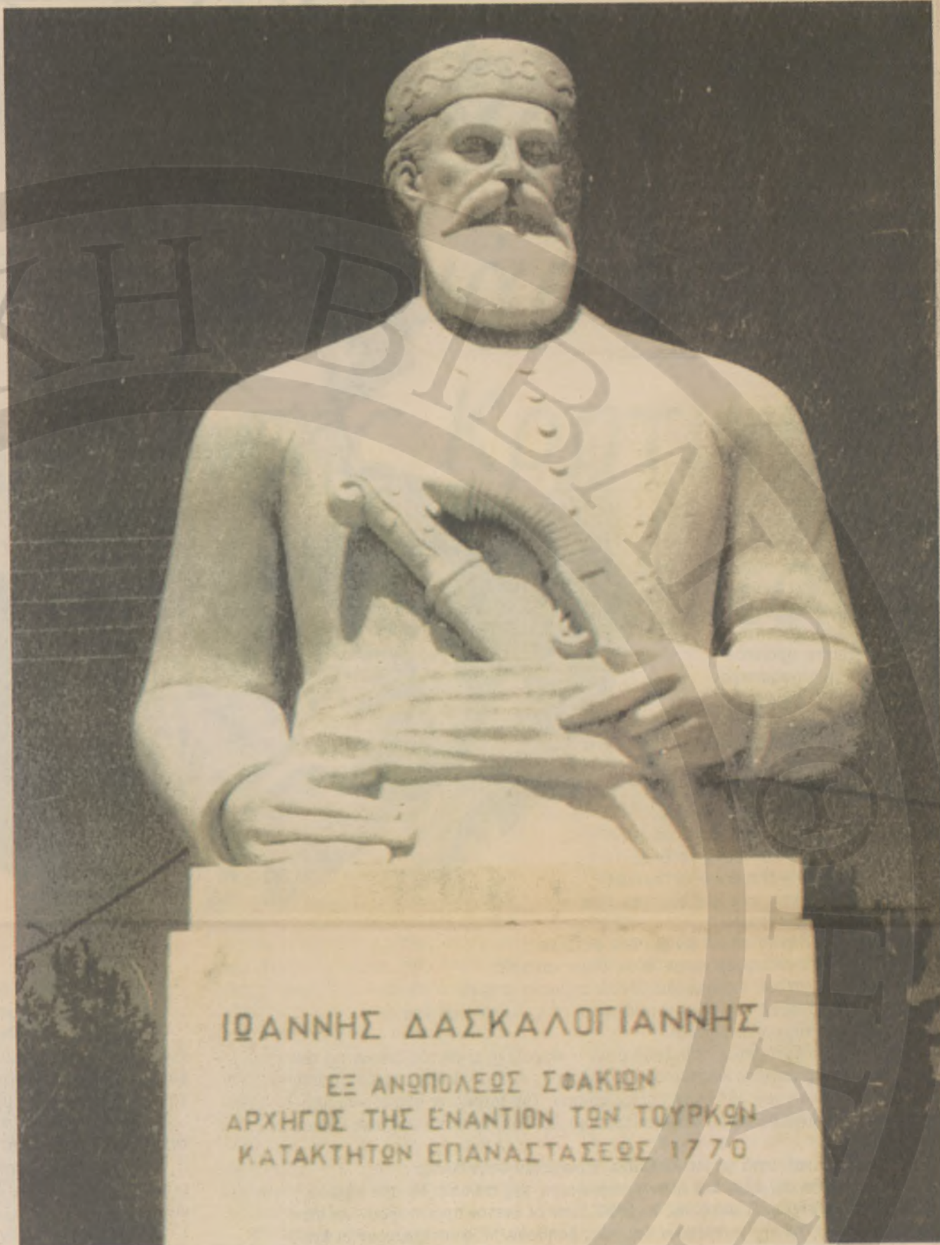
Προτομή του Δασκαλογιάννη στην Ανώπολη Σφακίων