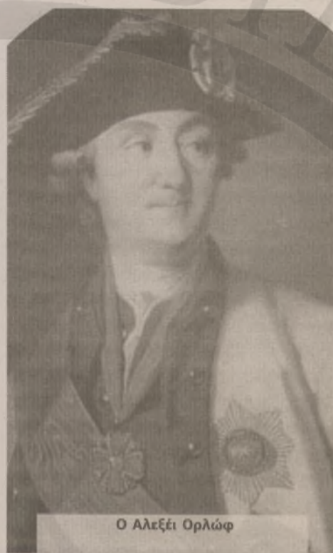
Ο Αλεξί Ορλώφ

σκαλογιάννης, έφτασε τον Σεπτέμβριο του 1769 στην Τεργέστη, όπου αγόρασε μεγάλο αριθμό όπλων με δικά του χρήματα. Μετά την επιστροφή του στην Κρήτη, ο Δασκαλογιάννης προέτρεψε τους πρόκριτους των Σφακίων να παρακολουθούν τις εξελίξεις, ώστε αν οι Ρώσοι εμφανιστούν στην Πελοπόννησο, να συνεργαστούν μαζί τους και να εξεγερθεί και η Κρήτη. Ο ρωσικός στόλος έφτασε τελικά έξω από τις ακτές της Μάνης τον Φεβρουάριο του 1770, αλλά η μειωμένη σύνθεσή του (τέσσερα πλοία και μερικές εκατοντάδες άνδρες) προκάλεσε ανάμεικτα συναισθήματα στους Έλληνες. Κάποιοι θεώρησαν πως ήρθε «το πλήρωμα του χρόνου» για την απελευθέρωση από τους Οθωμανούς και ένα δικό τους κράτος, ενώ άλλοι έκριναν ότι η ρωσική δύναμη ήταν πολύ μικρή για να συμβάλει αποτελεσματικά σε έναν τέτοιο αγώνα.