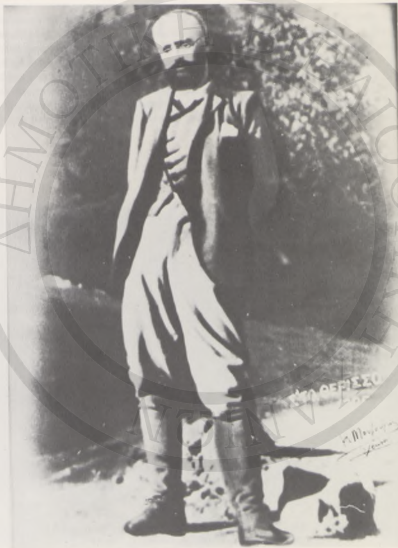
Ο Ελευθέριος Βενιζέλος στο Θέρισσο, 1905.