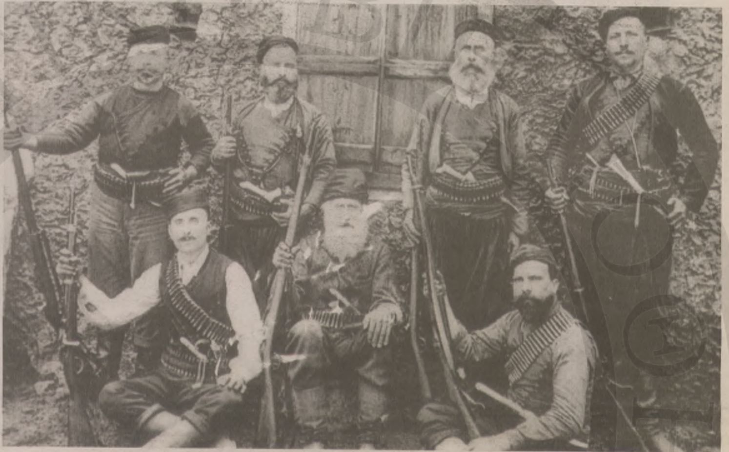
Ο πρόεδρος της Επανάστ. Συνελεύσεως 1905 μετ' οπλαρχηγών.

Η επανάσταση του Θερίσου του 1905 έρχεται στο προσκήνιο με αφορμή τα σημερινά εγκαίνια (βλ. Σελ. 11) του Μουσείου - Στρατηγείου από την υπουργό Πολιτισμού Λίνα Μενδώνη. Από το αρχείο και τη βιβλιοθήκη των "Χ.ν." δημοσιεύουμε σήμερα υλικό με αναφορές στα γεγονότα της εποχής που καθόρισαν το μέλλον της Κρήτης στον σύγχρονο κόσμο.