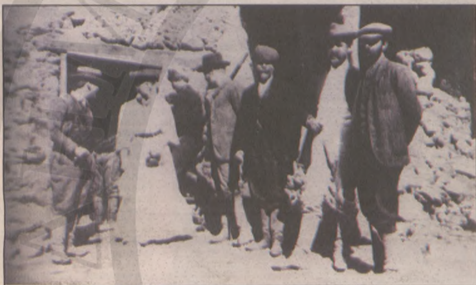
Ο Ελευθ. Βενιζέλος με συνεργάτες του κατά την επίσκεψη της Αγγλίδας δημοσιογράφου στο αρχηγείο του Θέρισου.