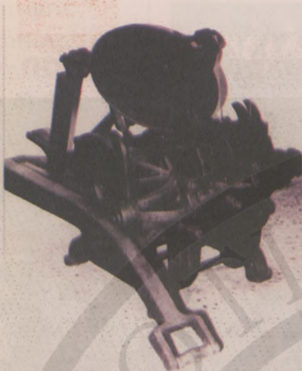
Το επαναστατικό τυπογραφικό μηχανήμα του Θέρισου.