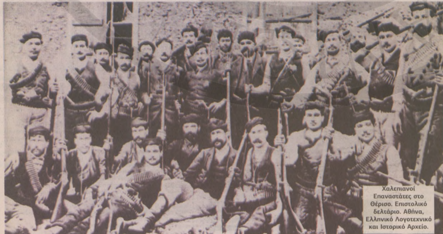
Χαλεπιανοί Επαναστάτες στο Θέρισο. Επιστολικό δελετάριο.

Η Ένωση δεν επιτεύχθηκε, όμως ο δεσποτισμός είχε πταθεί και ο δρόμος για μία δημοκρατική διακυβέρνηση στην Κρήτη είχε ανοίξει».