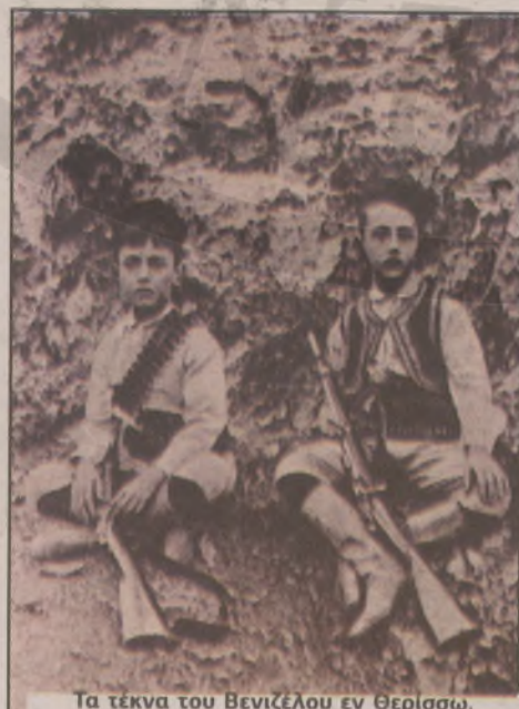
Τα τέκνα του Βενιζέλου εν Θερίσω.