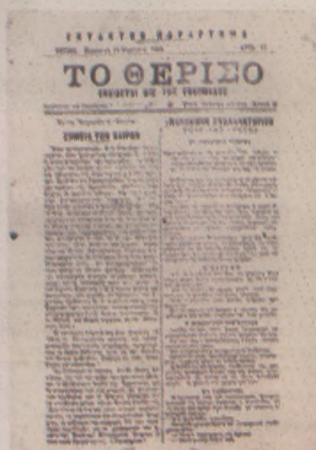
Ένα από τα φύλλα του δημοσιογραφικού οργάνου του επαναστατικού κινήματος.