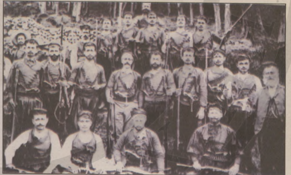
Επαναστάται Λάκκων εν Θερίσω.