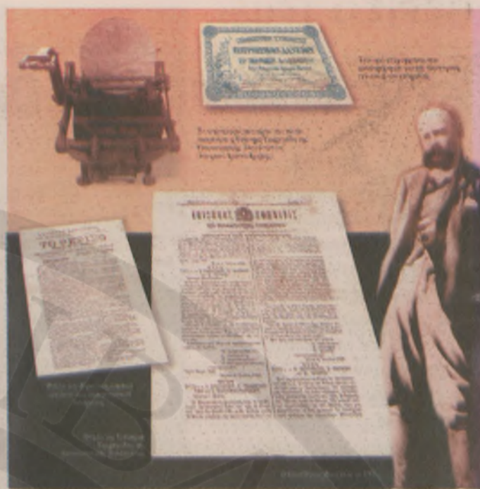
Υλικό από το συνέδριο για τα 100 χρόνια από την Επανάσταση Θέρισου (Εθνικό Ίδρυμα Ερευνών & Μελετών "Ελ. Βενιζέλος", 3-5 Μαρτίου 2005).