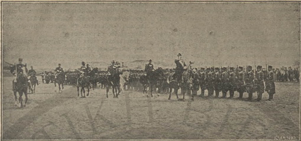
ΑΠΟ ΤΗΝ ΕΠΙΘΕΩΡΗΣΙΝ ΤΩΝ ΕΝ ΚΡΗΤΗ: ΔΙΕΘΝΩΝ ΣΤΡΑΤΕΥΜΑΤΩΝ Η Α.Β.Χ. Ο ΠΡΙΓΚΗΝ ΓΕΩΡΓΙΟΣ ΠΡΟ ΤΟΥ ΣΩΜΑΤΟΣ ΤΗΣ ΚΡΗΤΙΚΗΣ ΧΗΡΟΦΥΛΑΚΗΣ

τῶν ἡγεμόνων τῆς Δύσεως εἶχον λάβει τὸ δικαίωμα παρὰ τῶν αὐτοκρατόρων νὰ κόπτωσι χρυσὰ νομίσματα· καὶ ἐντεῦθεν ἄρχεται ἡ νομισματικὴ ἱστορία τῆς σημερινῆς Εὐρώπης. Ἄλλ' ἐπειδὴ συνεπεία τῶν Σιαυροφοριῶν ἡ Δυτικὴ Εὐρώπη ἐλθοῦσα εἰς ἐπιμιξίαν μετὰ τῶν Ἀνατολικῶν λαῶν διενήργει μετ' αὐτῶν ζωνρὸν ἐμπόριον, μόνη δὲ πηγὴ χρυσοῦ διὰ τὴν Εὐρώπην ἦτο τὸ μετὰ τῶν λαῶν τούτων ἐμπόριον καὶ τὰ εἰς τὴν βόρειον Ἀφρικὴν ὑπάρχοντα χρυσορυχεῖα, ὁ τότε χρυσοῦς δὲν ἐπήρκει πρὸς κατασκευὴν ἀρκούντων διὰ τὸ ἐμπόριον χρυσοῦν νομισμάτων.