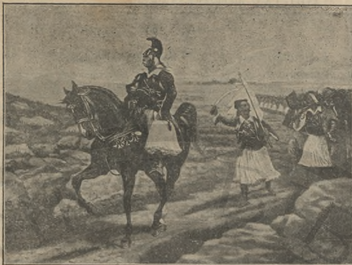
Ο ΚΟΛΟΚΟΤΡΩΝΗΣ ΟΔΗΓΩΝ ΤΟΥΣ ΕΛΛΗΝΑΣ