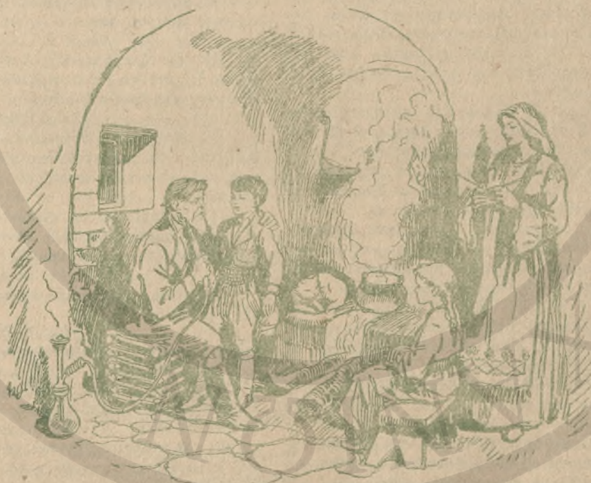
ΤΟ ΚΡΗΤΙΚΟ ΣΠΙΤΙ

(Από τὸ Τουριστικὸν Λεύκωμα «ΚΡΗΤΗ» τοῦ κ. Ἀλεξ. Δρουδάκη)