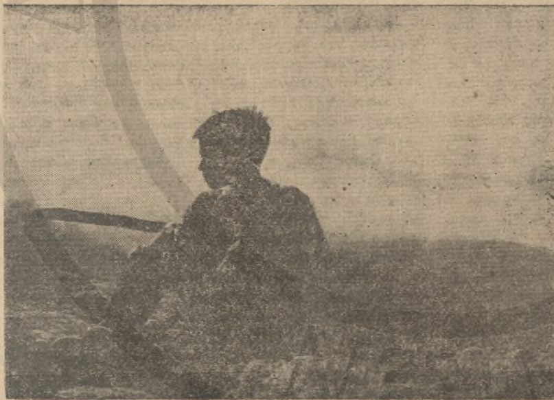
Τσομπανόπουλο τῶν Λευκῶν Ὀρέων.

Ἦθελα νάμουν τσέλιγγας, νάμουν κι' ἕνας σκουτέρης νά πάω νά ζήσω στό μαντρι στήν ἐρημιά στά δάσα νάχω κοπάδι πρόβατα νάχω κοπάδια γίδια κι' ἕνα σωρό μαντρόσκυλα νάχω και βοσκοτόπια τό καλοκαίρι στά βουνά και τὸν χειμῶ στοὺς κάμπους Νάχω ἀπὸ πάλιουραν βορὸ και στρούγγα ἀπὸ ροδάμι νάχω και σὲ ψηλὴν κορφήν καλύβια ἀπὸ ρουπάκια νάχω μὲ τὰ βοσκόπουλα σὲ κάθε σκάρων γλέντι νάχω φλογέρα νά λαλῶ ν' ἀντιλαλοῦν οἱ κάμποι νά μοῦ βοηθάει στό σάλαγγο νά μοῦ βοηθάει γκρέκια κι' ὄντας θά τὰ σταλίζουμε τά δειλινὰ στοὺς ἰσκιους στής ρεματιάς τῆ χλωρασιά μαζί της νά πλαγιαίξω νά μὲ γεμίξῃ μὲ φιλιὰ στοὺς δροσεροὺς τῆς κόρφους.