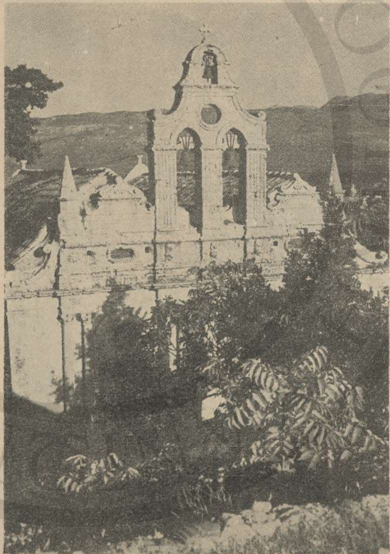
Τόπος προσκλήματος κάθε έλευτέρου άνθρώπου—τό Άρχάδι!.

Γι' αυτά τά προβλήματα θα άσχοληθούμε λεπτομερώς στα έπόμενα τεύχη, με την έλπίδα να δείξουν στοργικό ενδιαφέρον όλοι εκείνοι από τους όποιους έξαρτάται τό παρόν και τό μέλλον του κρητικού λαού.