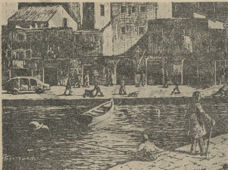
Η περιοχή «Συντριβάνι» τής πόλεως τών Χανίων. (Άπό πίνακα του σπουδαίου αυτοδιδάχτου Κρητός ζωγράφου Γ. Γεροντάκη)