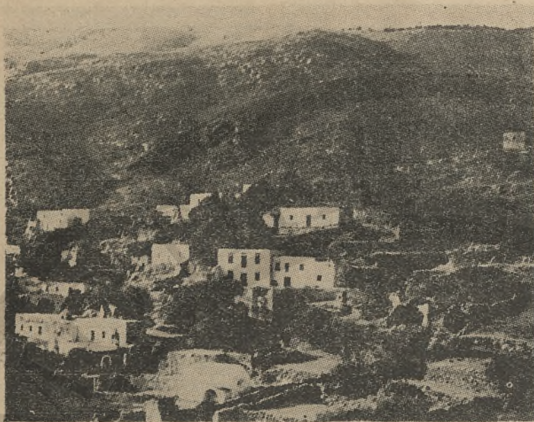
Ἡ συνοικία Μανιά στή χώρα τῶν Σφακιῶν.

κων οἱ Ροῦσσοι Βουρδουμπᾶς ἀρχιστράτηγος τῆς Κρήτης καί οἱ ἀρχηγοὶ Μανουσῶς Κούτσουπας, Στρατῆς Βουρδουμπᾶς καί Πῶλος Τσιριντάνης. Ὁ στρατηγὸς Μανιάς ἀναφέρεται ὡς διαπρέπων ἐπὶ κεφαλῆς τῶν Σφακιανῶν εἰς τὰς ἀνατολικὰς ἐπαρχίας τῆς Κρήτης (Ἱστορία Σφακιῶν σ. 279, 285, 292, 293 καὶ Ἱστορία Ψυλάκη Τ. Γ' σ. 486).