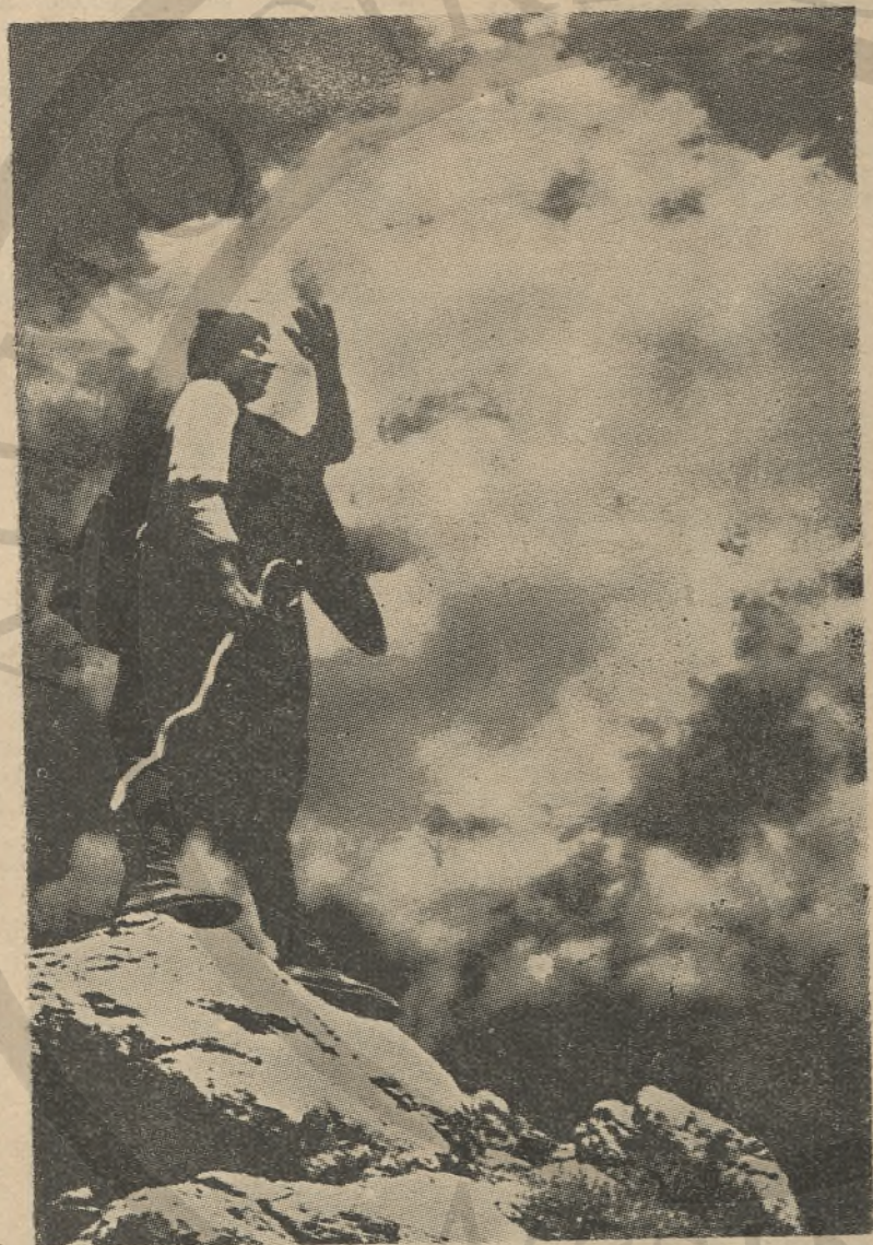
Ἀγνάντεμα ἀπ' τὶς κρητικὲς κορυφές. (Ἀπὸ τὴν συλλογὴ Κ. Κουτουλάκη).

Τοῦ οἰκονομικοῦ μας συντάκτου κ. Κ. Γ. Τσαπόγα