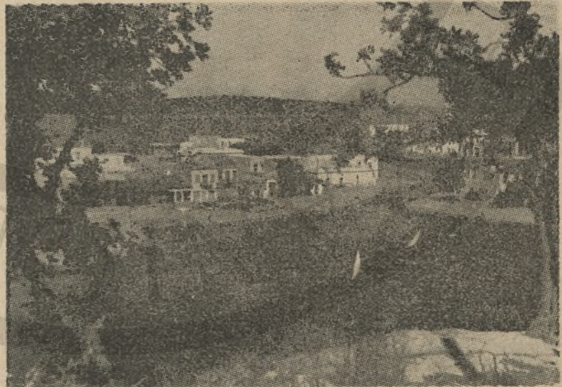
Ἡ ὁμορφὴ πρωτεύουσα τοῦ Ν. Λασηθίου Ἅγιος Νικόλαος, πού ἐξελίσσεται συνεχῶς.