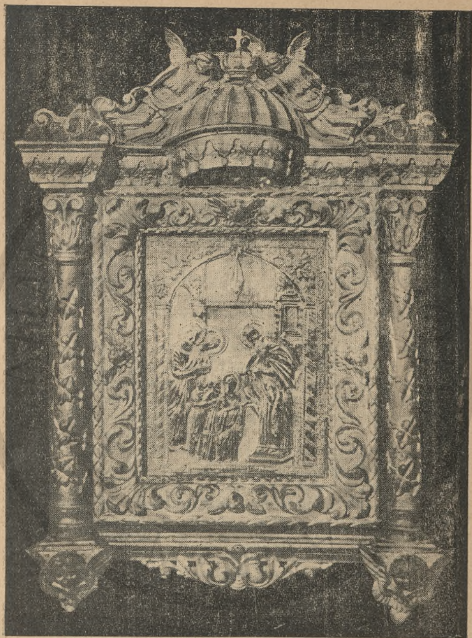
Ἡ θαυματουργὸς καὶ ἱστορικὴ εἰκὼν τοῦ Καθεδρικοῦ Ναοῦ τῶν Εἰσοδίων τῆς Θεοτόκου Χανίων Κρήτης.