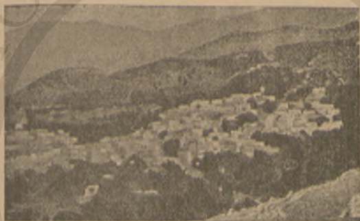
Ἡ ΚΩΜΟΠΟΛΙΣ ΒΙΑΝΝΟΣ

Ὁ Θεόδωρος ἐχάρη μεγάλως συναντήσας ἐν μέσῳ ἀγνώστων ἀνθρώπων καὶ τόπων τὸν καλὸν Κωνσταντῖνον. Ἀλλὰ καὶ ὁ Κωνσταντῖνος δὲν ἐχάρη ὀλιγώτερον συναντῶν τὸν Θεόδωρον. Ἐρρίφθησαν εἰς τὰς ἀγκάλας ἀλλήλων καὶ ἐφιλήθησαν ὡς ἀδελφοί.