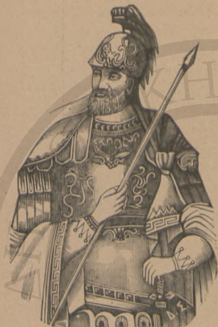
ΚΩΝΣΤΑΝΤΙΝΟΣ Ο ΠΑΛΑΙΟΛΟΓΟΣ

Τὴν ἑσπέραν ἐκείνην ὁ Θεόδωρος μετέβη εἰς τὸ μάθημα, ὅτε δὲ ἐπέστρεψε διηγήθη τοῦτο εἰς τὰ ἀδελφιά του. Τὸ μάθημα τοῦτο ἀφεώρα εἰς τὴν ἄλωσιν τῆς Κωνσταντινουπόλεως ὑπὸ τῶν Τούρκων.