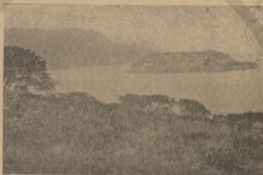
Η ΝΗΣΙΣ ΤΗΣ ΣΠΙΝΑΛΟΓΓΑΣ

Μετά τινα χρόνον, κάμφαντες τὸ τρικυμῶδες ἀκρωτήριο, εἰσηλθον εἰς τὸν μέγαν καὶ γραφικὸν κόλπον τοῦ Μεραμβέλλου. Τὸ μελαγχολικὸν φρούριον τῆς νησίδος Σπιναλόγγας ἐνεφανίσθη τότε ὅμοιον πρὸς πελωρίαν οἰκίαν, ἐπιπλέουσαν τῶν ὑδάτων.