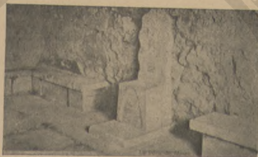
Ο ΘΡΟΝΟΣ ΤΟΥ ΜΙΝΩΣ ΕΝ Τῼ ΑΝΑΚΤΟΡῼ ΤΗΣ ΚΝΩΣΟΥ

Μετὰ τοὺς λόγους τούτους ὁ γηραιὸς κύριος ἀπεχαιρέτισε τὸν Θεόδωρον καὶ εἰσῆλθεν εἰς ἓν πρὸς τὰ δεξιὰ τῆς ὁδοῦ μονοπάτιον.