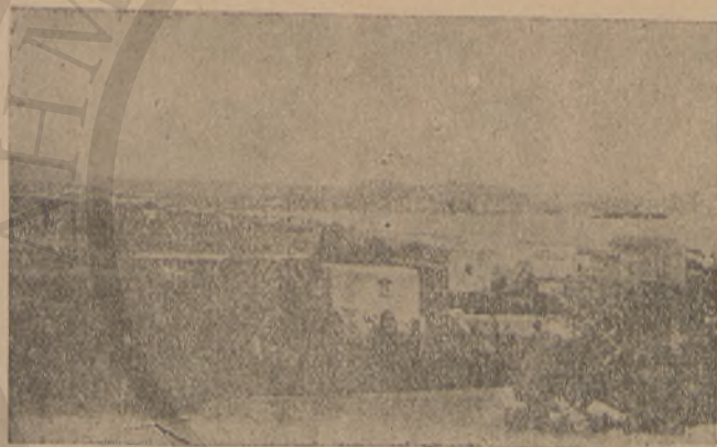
Ἡ ΠΟΛΙΣ ΤΗΣ ΡΕΘΥΜΝΗΣ

Ἡ μικρὰ καὶ σεμνὴ πόλις τῆς Ρεθύμνης φαίνεται ἤδη καλῶς.