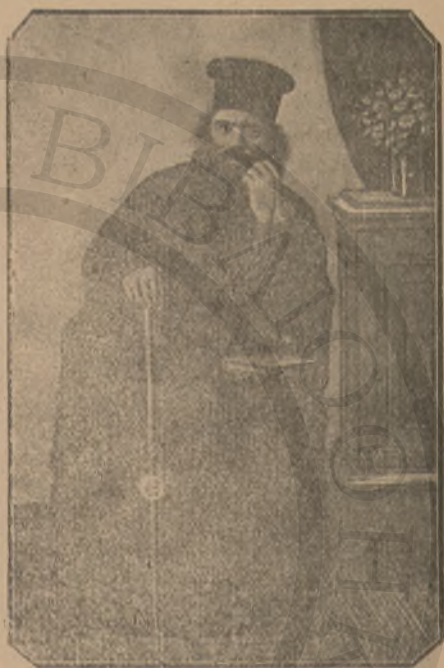
Ο ΗΓΟΥΜΕΝΟΣ ΤΟΥ ΒΡΚΑΔΙΟΥ ΓΑΒΡΙΗΛ

— Διὰ τῆς αὐτοθυσίας τῶν μαρτύρων τούτων διεσώθη ἡ τιμὴ