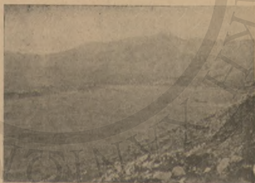
ΤΟ ΟΡΟΠΕΔΙΟΝ ΤΟΥ ΛΑΣΗΘΙΟΥ

Ἡ ὑπερμεγέθης ἄδενδρος λεκάνη τοῦ Ὀροπεδίου, πανταχόθεν περικεκλεισμένη ὑπὸ ὑψηλῶν κορυφῶν, ἠπλοῦτο σύμπασα ἀπέραντος καὶ κατάλευκος πρὸ τῶν ποδῶν των. Τὸ πάλλευκον ἐκ χιόνος κάλυμμα τῆς ὁμοίαζε πρὸς παμμεγίστην σινδόνα, μήκους 9 χιλιομέτρων καὶ πλάτους 5, ὅσαι εἶναι καὶ αἱ διαστάσεις τοῦ πυθμένος αὐτῆς.