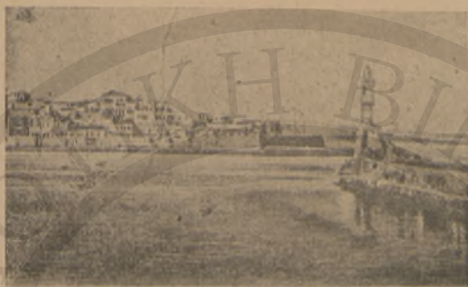
Ἡ Εἰσοδος τοῦ Λιμένος Χανίων

στιγμῆς ἐκεῖνης ἀνεπαύετο ἀκόμη εἰς τὸν μαῦρον βυθὸν τοῦ λιμένος.