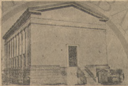
ΤΟ ΜΟΥΣΕΙΟΝ ΗΡΑΚΛΕΙΟΥ

Ὁ Ἀλέξανδρος κρατῶν μετ' ἀδελφικῆς ἀγάπης τὴν χεῖρα τοῦ Θεοδώρου διηυθύνθη μετ' αὐτοῦ πρὸς τὴν πλατεῖαν τοῦ Πρίγκιπος καὶ εἰσῆλθον εἰς τὸ ἐκεῖ πλησίον ἀρχαιολογικὸν μουσεῖον.