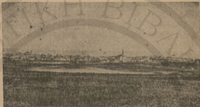
Ἡ ΚΩΜΟΠΟΛΙΣ ΙΕΡΑΠΕΤΡΑ

— Ὑπηρέτησα ἐκεῖ πρὸς τριῶν ἐτῶν. Εἶναι μεγάλη καὶ πλουσία κωμόπολις. Πρὸ τῆς ἐπαναστάσεως τοῦ 1897 ἦτο περιτειχισμένη διὰ χαμηλοῦ τείχους, τὸ ὁποῖον μετὰ τὴν ἀπελευθέρωσιν ἐκρημνίσθη ὑπὸ τῶν κατοίκων. Τὴν θέσιν δὲ τοῦ τείχους κατέχει σήμερον μίᾳ ὥραϊα λεωφόρος. Ἡ Ἱεραπέτρα ἔχει πολλὰς ὥραϊας