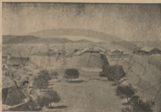
ΤΟ ΦΡΟΥΡΕΙΟΝ ΤΟΥ ΗΡΑΚΛΕΙΟΥ

Εἰσελθὼν κατόπιν εἰς τὴν πόλιν ᾠδήγησε τὸν ὄνον του εἰς ἓν πανδοχεῖον, ὅπου ἀνεπαύθη καὶ αὐτὸς καὶ ἐπρογευματίσσε. Μετὰ ταῦτα λαβὼν ὁδηγίαν παρὰ τοῦ πανδοχέως μετέβη πρὸς τὸν ἔμπορον τῶν ὕλικῶν.