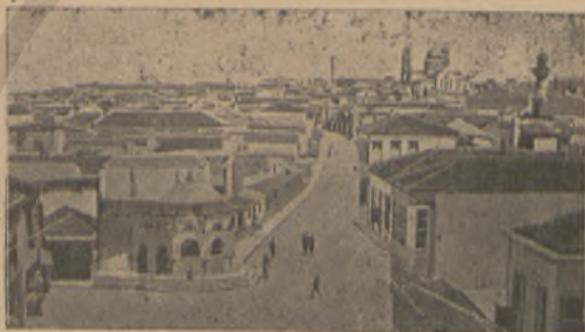
Η ΠΟΛΙΣ ΤΟΥ ΗΡΑΚΛΕΙΟΥ