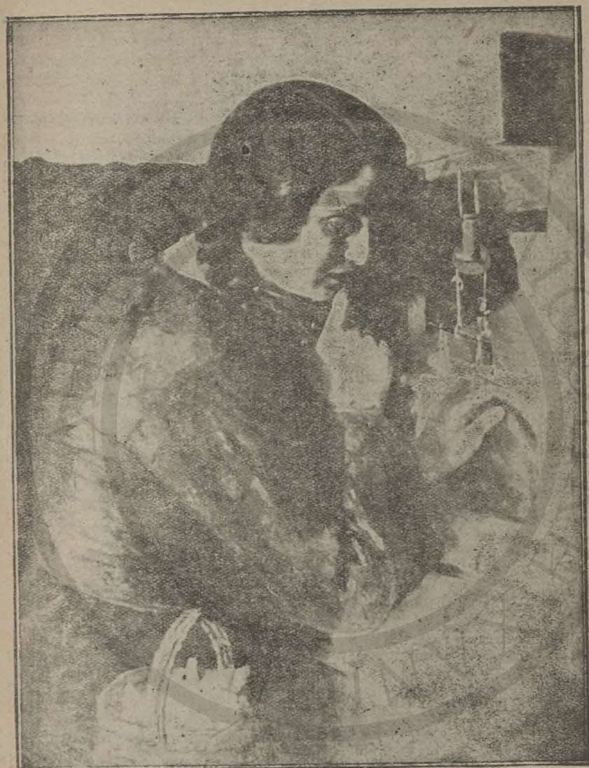
ΚΡΗΤΙΚΟΠΟΥΔΑ ΣΤ' ΑΡΓΑΛΕΙΟ