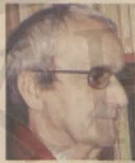
Γράφει ο Μιχάλης Γρηγοράκης

...λία, από την οποία δεν μπορεί πλέον να επανακάμψει προς τους επαναστάτες, χωρίς να τρέξει κίνδυνο να πιαστεί. Προχθες κάποιος Έλληνας πλοίαρχος υποσχέθηκε να τον παραλάβει, όμως αγνού αν το κατόρθωσε ή μάλλον πολύ αμφιβάλλω. Κάποιος άλλος πλοίαρχος απάιτησε για την εκτέλεση της πράξης αυτής πεντακόσια ναπολεόνια."