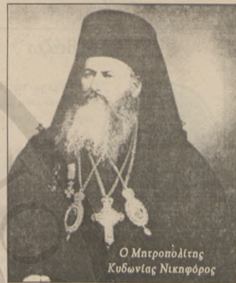
Ο Μητροπολίτης Κυδωνίας Νικηφόρος

Το εκτελεστικόν σταματήσαν τας ενεργείας του διεμαρτυρήθη αντίγραφον του προς τον λαόν και τους Ναυάρχους εγγράφου του, αν και πιστεύω ότι θα έχετε, σας εσώκλειω. Διερχόμεδα πονηροτάτας ημέρας ο Θεός γενέσθω ημίν βοηθός και σκεπαστής. Και υμείς πρέπει