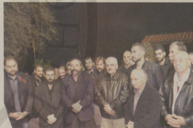
Η "Λακκιώτικη παρέα" απέδωσε ριζτικά.

μητική πλάκα ήταν υποχρέωση του χωριού απέναντι στον ήρωα των επαναστάσεων.