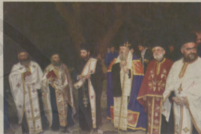
Ο μητροπολίτης Κυδωνίας και Αποκορώνου κ. Δαμασκηνός χοροστάτησε στον μέγα εσπερινό.

Για το ίδρυμα Χατζημιχάλη Γιάνναρη ο κ. Μανώλης Νικολούδης επεσήμανε πως η τι-