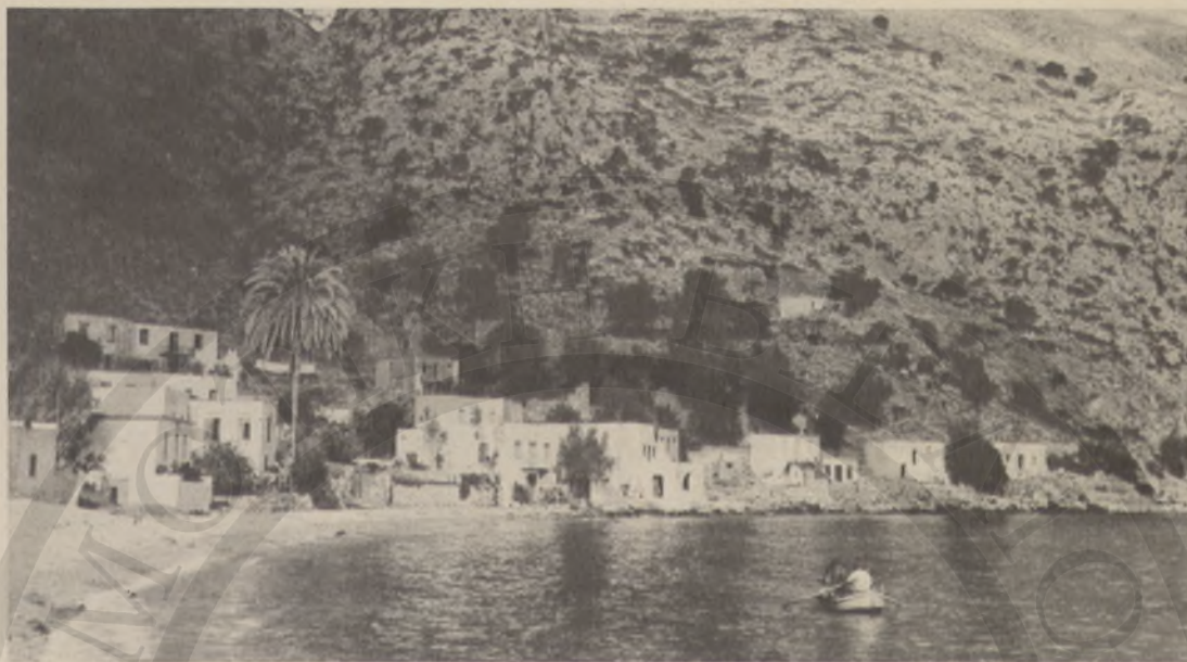
Τὸ λιμανάκι τοῦ Λουτροῦ σήμερα. Τότε ἦταν διαμετακομιστικός σταθμός. Στὰ 25 σφακιανὰ καράβια, ποὺ εἶχαν προσορμισθῆ ἐκεῖ, σώθηκαν χιλιάδες γυναικόπαιδα ἀπὸ τὴν σφαγὴ καὶ τὸν ἐξανδραποδισμό.

γός καὶ ἡ Μαρία θὰ ζήσουν σὲ χρυσὴ φυλακὴ, στὰ σερράγια τοῦ πασᾶ Χουσεῖν. Οἱ ἄλλοι θὰ κλεισθοῦν στὰ ὑγρά ὑπόγεια τοῦ Μεγάλου Κοῦλε, θὰ ἐργάζονται σκληρὰ καὶ θὰ βασανίζονται. Ὁ πασᾶς δὲν θὰ μπορέσει, παρὰ τὴς παγίδες καὶ τὴς πονηριῆς του, νὰ πείσει τοὺς ἀδελφούς τοῦ Δασκαλογιάννη νὰ ἔλθουν ἀπὸ τὰ Κύθηρα καὶ νὰ πέσουν στὰ νύχια του. Οὔτε νὰ βάλῃ χέρι στοὺς ἀνύπαρκτους θησαυρούς τοῦ ἀρχηγοῦ. Θὰ μάθῃ ὁμως γιὰ τὴν ρωσικὴ βοήθεια ποὺ δὲν ἦρθε. Καὶ ὅταν θὰ δεβαιωθῆ ὅτι δὲν μπορεῖ πιὰ νὰ μάθῃ τίποτα ἄλλο ἢ νὰ κερδίσει, θὰ δώσῃ τέλος στὶς συμπαγνίες του.