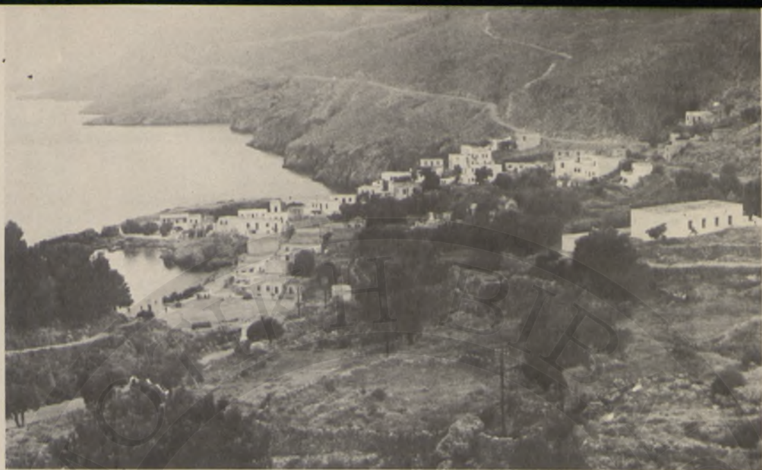
Ο Όμπρόςγιαλος (σημερινή Χώρα Σφακιών), που στην επανάστασι τοῦ 1770 ξεθεμελιώθηκα. Παράλληλα στὴν ἄκτῃ φαίνεται ὁ δρόμος ποὺ ὀδηγεῖ στὴν Ἀνάπολι.

στόλου καὶ ἐπαναστασιῶν καὶ θὰ προχωροῦσαν ὡς τὸ Μ. Κάστρο. Κατὰ τὸ σχέδιο λοιπὸν ἡ Κρήτη γρήγορα θὰ ἔβρισκε τὴν λευτεριά της. Κατὰ τὸ σχέδιο βέβαια. Γιατί τὰ πράγματα δὲν ἦρθαν ὅπως τὰ ἤθελαν. Ἦρθαν ἀνάποδα.