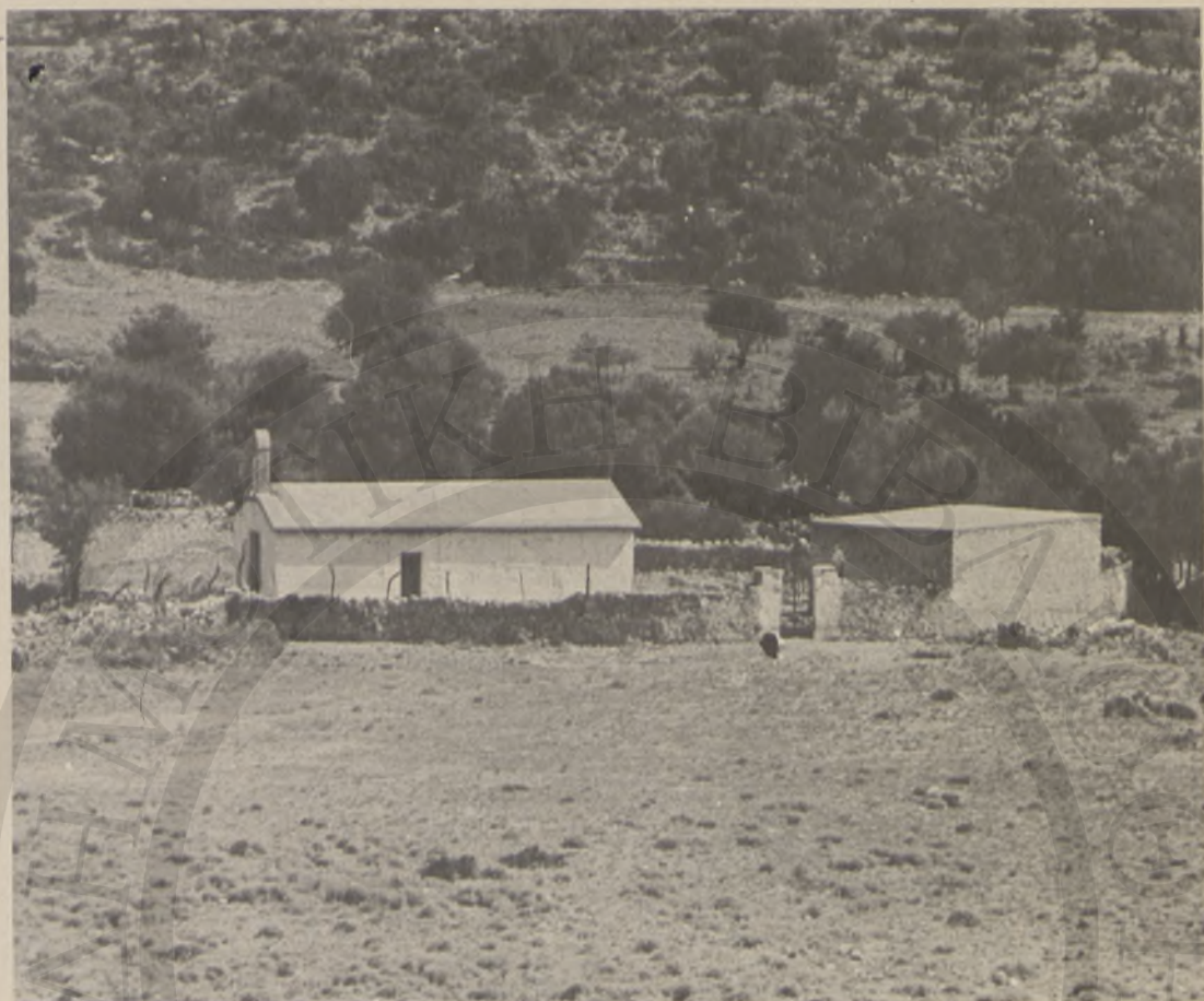
Ἡ Κράπη μὲ τὸν Ἅγιο Ἰωάννη τὸν Πρόδρομο. Στὴν τοποθεσία αὐτὴ ἔγινε ἡ πρώτη μεγάλη συγκέντρωση Κρητῶν ἐνόπλων στὶς 4 Ἀπριλίου 1770.

μέσως ἀπὸ τὸν «κατοραμένο» — γι' αὐτοὺς — πόπο. Οἱ Σφακιανοὶ λοιπόν, γενναῖοι καὶ δραστήριοι, μποροῦμε νὰ πούμε πῶς εὐημεροῦσαν στὴν ἔρημιά τῶν βουνῶν καὶ τῶν λαγκαδιῶν τους.