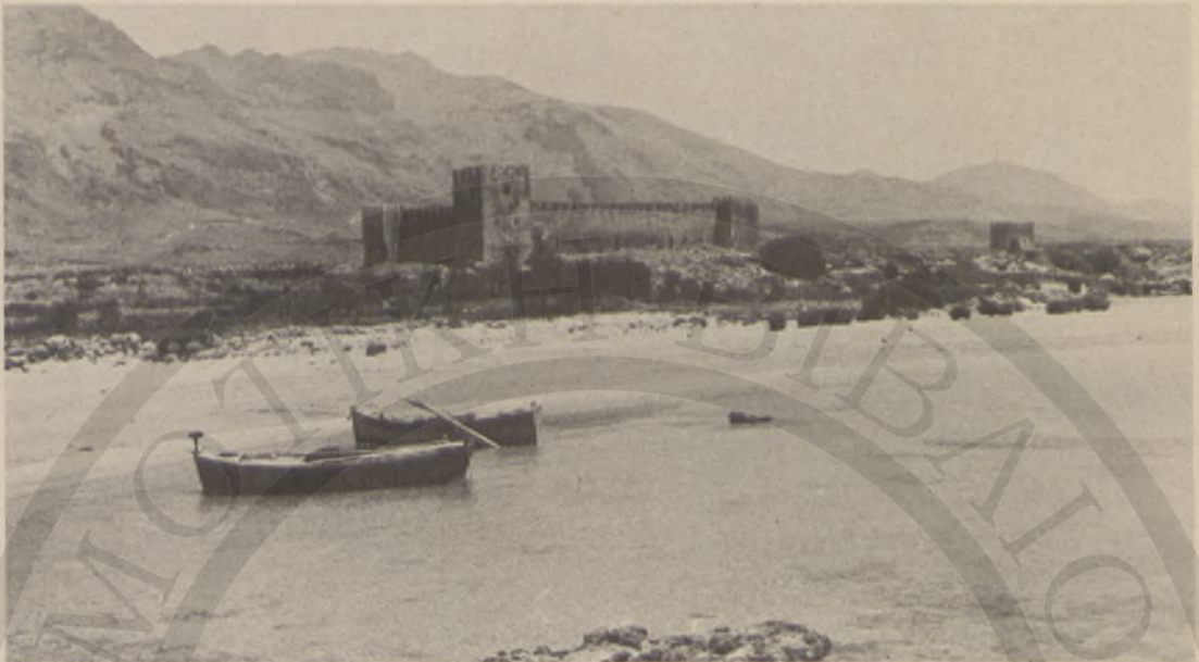
Τὸ μικρὸ ἐνετικὸ φρούριον τοῦ Φραγκοκάστελλου, ἀρχηγεῖο τοῦ Κετχουντᾶ πασᾶ καὶ πρώτη φυλακὴ τοῦ ἥρωα Δασκαλογιάννη. Ἐδῶ πρωτοκλείσθηκε πρὶν ἀπὸ τὸ μεγάλο του μαρτύριον.

ρη τοῦ Δασκαλογιάννη. Ὁ Πατζελιὸς ψάλλει γιὰ τὴν περίπτωσι, ἀρκετὰ μοιρολατρικά.