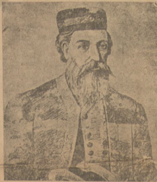
Ο θρυλικός «Τσελεπής»

Οι Τούρκοι δικαιολογημένα έβλεπαν στο πρόσωπο του Τσελεπή ένα φοβερό αντίπαλο, που πολύ γρήγορα θα έπιβαλλόταν σ' όλην τη Κρήτη.