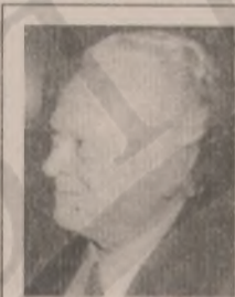
Γράφει ο Γ.Μ. ΜΑΝΟΥΣΣΕΛΗΣ

Στις 20 Ιουνίου πραγματοποιήθηκε συναυλία του μουσικοσυνθέτη, Νίκου Μαμαγκάκη, ο οποίος με 20μελή ορχήστρα ερμήνευσε το λαϊκό έπος από τη ριμάδα του Παντζελιού του τυροκόμου.