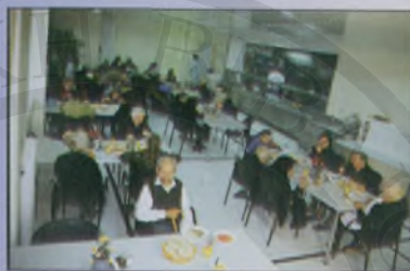
Νεος σύγχρονος χώρος σίτισης ηλικιωμένων

υπ' αριθ. 4395/ 10-7-1919 συμβόλαιο που φυλάσσεται στο Υποθηκοφυλακείο Χανίων, αντί 40.000 χρυσών δραχμών και υπογράφεται από το Σωτήριο Κροκιδά και τους κληρονόμους του Επισκόπου Νικηφόρου Ζαχαριάδη. Η Γενική Διοίκηση Κρήτης παραχώρησε το ακίνητο στο Δήμο Χανίων και το Δημοτικό Συμβούλιο Χανίων με την υπ' αριθμ. 15/7-7-1919 απόφαση του αποδέχτηκε τη δωρεά. Το υπ/ αριθ. 8246/31-7-1919 δωρητήριο συμβόλαιο του συμβολαιογράφου Χανίων Δημητρίου Φραντζεσκάκη, υπογράφει από πλευράς Δήμου ο τότε Δήμαρχος Χανίων Εμμ. Μουντάκης. Το 1930, επί Δημαρχίας Ιωάννου Μου-