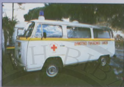
Ασθενοφόρο Δημοτικού Γηροκομείου

Στα πλαίσια της κοινωνικής πολιτικής του, ο Δήμος Χανίων δίνει μεγάλη σημασία τόσο στη λειτουργία του Δημοτικού Γηροκομείου, το οποίο ευελπιστεί ότι θα αναδειχθεί στο μέλλον ως ένα "πολυτε-