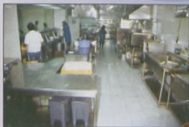
Σύγχρονα νέα μαγειρεία Δημοτικού Γηροκομείου

Το 1957 δημοπρατήθηκε η δεύτερη (ανατολική) πτέρυγα του Δημοτικού Γηροκομείου, η οποία ετέθη σε λειτουργία το 1961, ενώ το 1964 με πρωτοβουλία του Διοικητικού Συμβουλίου του Γηροκομείου εκπονήθηκε μελέτη για νεό κτίριο συνολικής δυναμικότητας 290 κλινών, με πρόβλεψη για χώρους αναψυχής, εργοθεραπείας, κινησιοθεραπείας κ.λπ. Με πρωτοβουλία του Εφημέριου του ναού της Ευαγγελιστρίας Αναστασίου Σπινθουράκη ιδρύθηκε ο Όμιλος Εκσυγχρονισμού Γηροκομείου Χανίων με σκοπό την ευαισθητοποίηση Πολίτης και Δημοτών στο θέμα του Γηροκομείου και την ανεύρεση πόρων για την ανέγερση του νεού κτιρίου. Στις 7 Ιουλίου 1976, επί Δημαρχίας Αντώνη Μαρή θεμελιώθηκε η τρίτη πτέρυγα του Γηροκομείου,