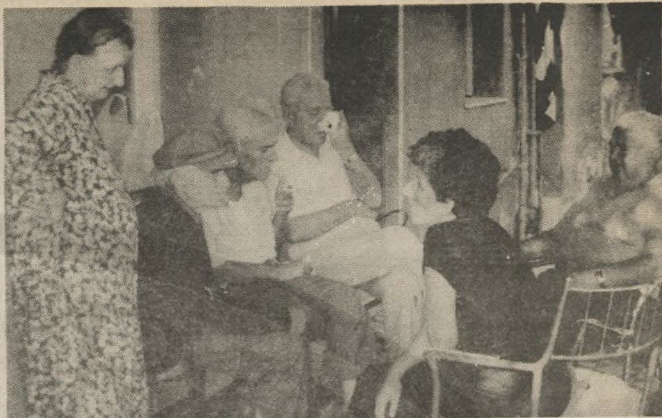
Η συζήτηση για το Γηροκομείο, έχει ανάψει. Τρόφιμοι και επισκέπτες μιλούν στην αυλή του ιδρύματος

Πριν ένα χρόνο θυμοίμαι, που έπεσε από την αποθήκη κάτω μια γυναίκα και σκοτώθηκε. Μια άλλη έπεσε από το μπαλκόνι κάτω, και δεν έπαθε