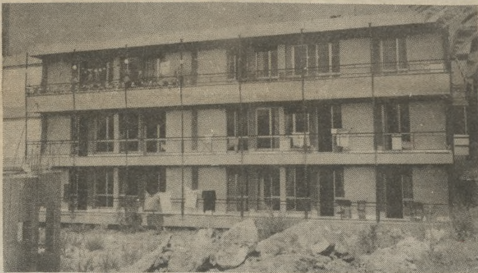
Η νέα πτέρυγα του Γηροκομείου. Πολλοί την ονειρεύτηκαν... σαν πρότυπη. Οι τρόφιμοι λένε άλλα