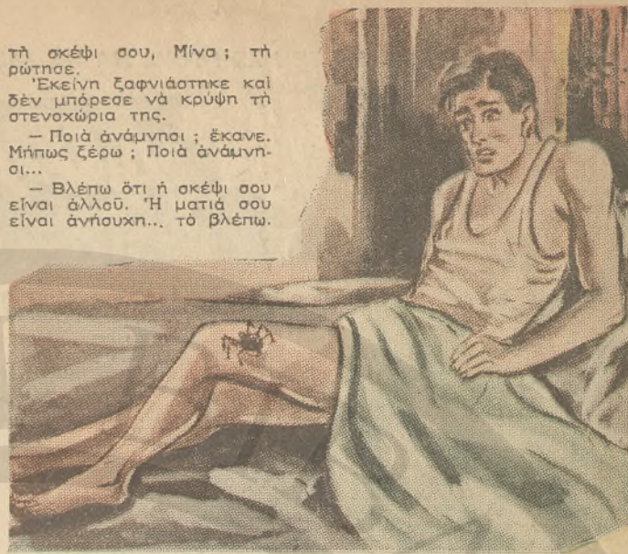
Πόση ώρα θα κρατούσε αυτό τό μαρτύριο;

— Βλέπω ότι η σκέψι σου είναι άλλου. Η ματιά σου είναι άνήνοχη... τό βλέπω.