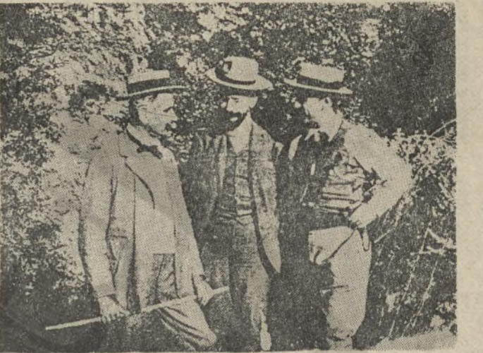
Η τριανδρία του Θέρισου. Από αριστερά Κων/νος Ψευμης, Ελ. Βενιζέλος, Κων/νος Μανος.

ΟΓΔΟΝΤΑ χρόνια από κείνον το Μάρτη του 1905 και όσα γίνανε στο απάτητο χωριό των Χανίων, δεν υποχρεώνουν μόνο σήμερα να τιμήσουμε εκείνο το έπος, δεν επιβάλλουν τη σωστή και πλήρη καταγραφή των όσων απίστευτων δραματιστηκαν, αλλά και προσφέρουν. Εκείνοι οι άντρες και όσα πραγματοποιήσαν, προσφέρουν και σήμερα το διδάγμα, δείχνουν και πάλι το