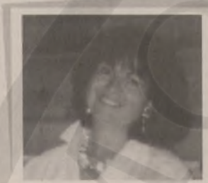
Γράφει η ΦΩΤΕΙΝΗ ΣΙΦΡΕΔΑΚΗ