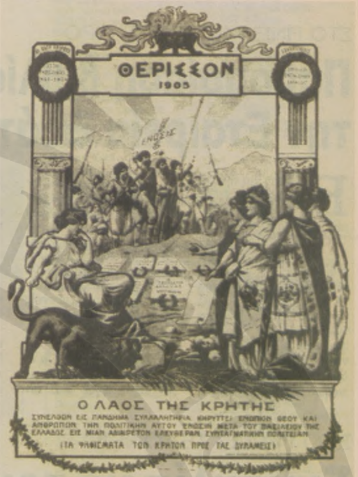
Λιθογραφία που κυκλοφορούσε στην Ελλάδα περί το 1910

Μια από τις αρχαιότερες εφημερίδες των Αθηνών, οι « ΚΑΙΡΟΙ » (Δ/ντής: Π. Κανελίδης) που το 1905 διήνυε το 33ο έτος κυκλοφορίας της, στο φ. της 25-3-1905 με αρκετά ευ-