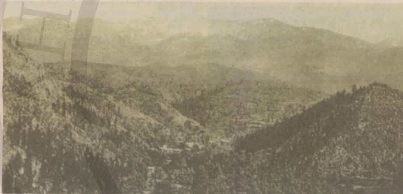
Το Θερίσο την εποχή της Επανάστασης

Αύριο, Σάββατο 6 Μαρτίου 2010, θα 'ναι τιμή και Χρέος όλων μας, να οδεύσουμε για το θρυλικό και ιστορικό Θερίσο. Θα βρισκόμαστε εκεί Εκκλησία, Αρχές, Φορείς και Λαός, προκειμένου να τιμήσουμε την ιστορική επέτειο της Επανάστασης του Θερίσου (5-3-1905!). Έτσι, χρέος της στήλης μας είναι, να παραχωρήσει το χώρο της: “Πνευματικά και καλλιτεχνικά γεγονότα”, στα σχετικά με την Επέτειο ιστορικά δεδομένα.