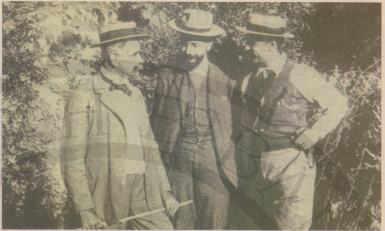
Η τριανδρία του Θερίσου Κ. Φούμης, Ε. Βενιζέλος, Κ. Μάνος

Η σύνδεση της επαναστατικής εκτροπής με τις πολιτικές εξελίξεις των ετών 1901-1905 είναι άμεση -όχι μόνο προβαλλόταν ως βασικός σκοπός της εξέγερσεως η προώθηση της ενω-