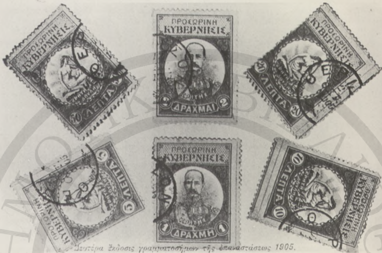
Δευτέρα Έκδοση γραμματοσήμων της επανάστασης 1905.

Επειδή αντιλαμβανόταν τους λόγους που τα «τζάκια» τον υποτιμούσαν, του άρεσε να τραγουδεί την μαντινάδα: «Σαν είναι ο τράγος δυνατός δεν τονε στένει η μάντρα, ο άντρας κάνει τη γενιά κι όχι η γενιά τον άντρα».