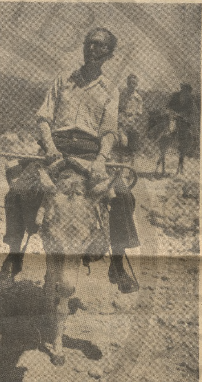
Ο Καζαντζάκης, τó 1945, στην Κρήτη

Η Άνατολή, με τις λαχτάρες της, με την άμεσή της έπαφή με την μυστηριακή ουσία του κόσμου, θά αποτελεί πάντα για την Ελλάδα τó ζεστό, σκοτεινό, πλούσιο ύποσυνείδητο. Άποστολή του έχει πάντα ο ελληνικός νοός να τó ανεβάσει στό φώς και να τó κάμει συνειδητό! Η Άνατολή είναι τó άπέραντο, τó άμορφο, τó ρεούμενο' ή Ελλάδα είναι στερει δύναμη, που επιβάλλει στό άμορ-