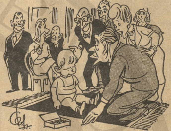
— Πώς κάνει ό γαϊδαράκος, μπέμμη;