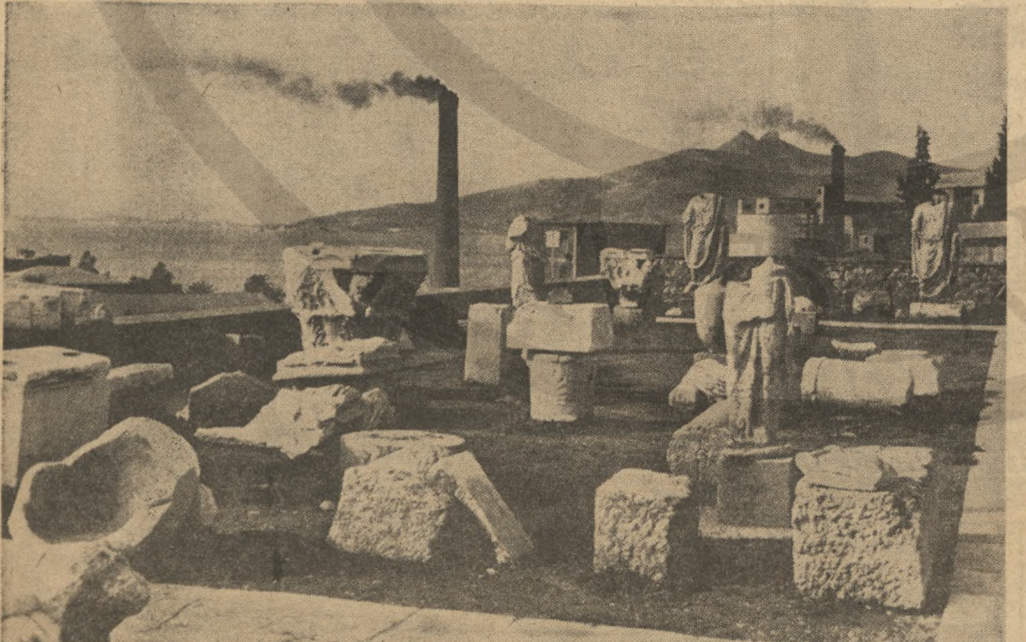
Η αρχαία Ελλάδα και ή σύγχρονη, όπως τις συνόλασε στην Έλευσίνα ο φακός του διάσημου Γάλλου φωτογράφου Άνρι Καρτιέ-Μπρεσσόν.

Για ένα δυτικό έθνος τó πρόβλημα του πολιτισμού Τό τέλος στή σελίδα 18