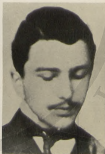
◀ Ὁ Καζαντζάκης σὲ νεαρή ἡλικία.