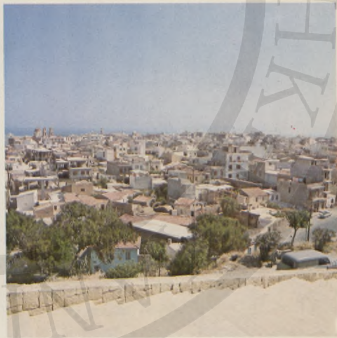
Τὸ Ἡράκλειο, ἀπὸ τὸν Προμαχώνα τοῦ Μαρτινέγκο, ὅπου βρίσκεται ὁ τάφος τοῦ Καζαντζάκη.

«Δὲν ἐλπίζω τίποτα. Δὲ φοβοῦμαι τίποτα. Εἶμαι λεύτερος.»