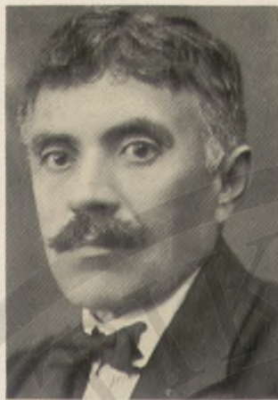
Ζορμπάς: ο ήρωας του ομώνυμου μυθιστορήματος του Καζαντζάκη.