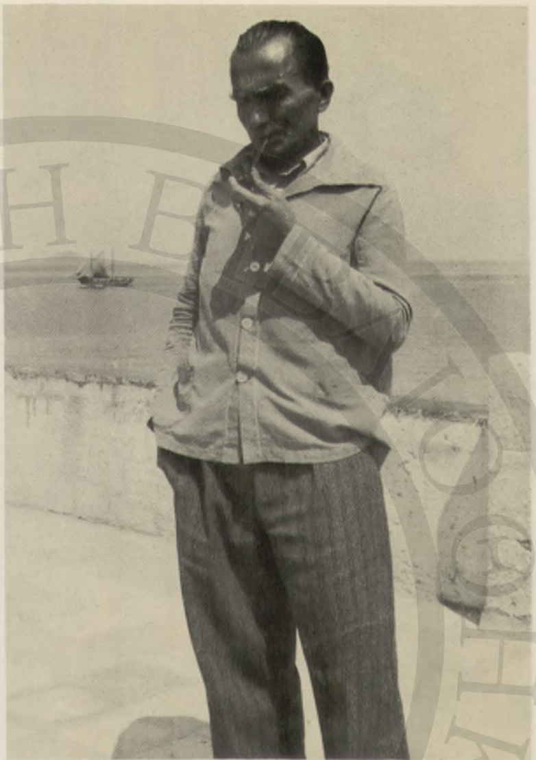
Στή βεράντα του σπιτιού του της Αίγυψας, ότá 1943.