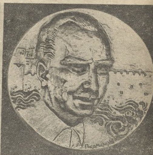
'Αναμνηστικό μετάλλιο με τή μορφή του ΝΙΚΟΥ ΚΑΖΑΝΤΖΑΚΗ έγκριμα ό Δήμος 'Ηρακλείου τό 1977 με τήν συμπλήρωση 20 χρόνων από τόν θάνατό του.

σταμάτησα στην αίθουσα Καζαντζάκη και κοιτάζω τή διαθήκη του. πού λέει τό σπίτι του στό 'Ηράκλειο νά γίνει Μουσείο Κι τή διαθήκη πού κάνει, ό τόν φαντάζομαι θά έμαθε πώς τό σπίτι δέν υπήρχε πιά, ότι συνεννοήθηκε με τήν 'Εταιρία Κρητικών 'Ιστορικών Μελετών και τό πράγμα τό να βιβλία του, τά χάρτια του να πάνε στό Μουσείο όπου θά διατεθεί μία αίθουσα ειδικά κι θα λέγε ται τό Γραφείο Καζαντζάκη. 'Αυτά τό αντικείμενα πήγαν. 'Η αίθουσα όμως δέ λέγεται Γραφείο Καζαντζάκη άλλα λέγε ται αίθουσα Καζαντζάκη και περιτριγυρίζεται —όπως λόγώελλεί φωνή χύδρου— σε δύο μικρά δωμάτια πού σε ξεκινούν. Γιατί, όταν έχεις δει ανάλογα Μουσεία, σάν τό Μουσείο τό Γκαίτι, του Ολιγκύ του Λοιβαριού στο εξωτερικό, αυτά δέν είναι