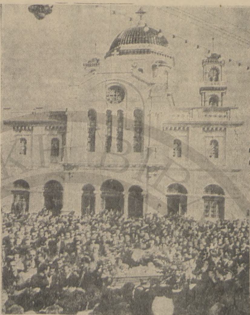
Το φέρετρό του Ν. Καζαντζάκη βγαίνει από τον Ιερό Ναό του Αγίου Μηνά.

Για τον ίδιο τον Καζαντζάκη όμως δεν υπάρχει ανάσταση. Ο δρόμος του Γολγοθά συνεχίζεται... Το 1949 ξαναγυρνάει στην Κρήτη. Με μια κάθετη τομή στη θύμηση βυθίζεται στα παιδικά του χρόνια και ξαναζει τους καιρούς που η Κρήτη με τις ολόβαθιες κι άμετρητες πλη-