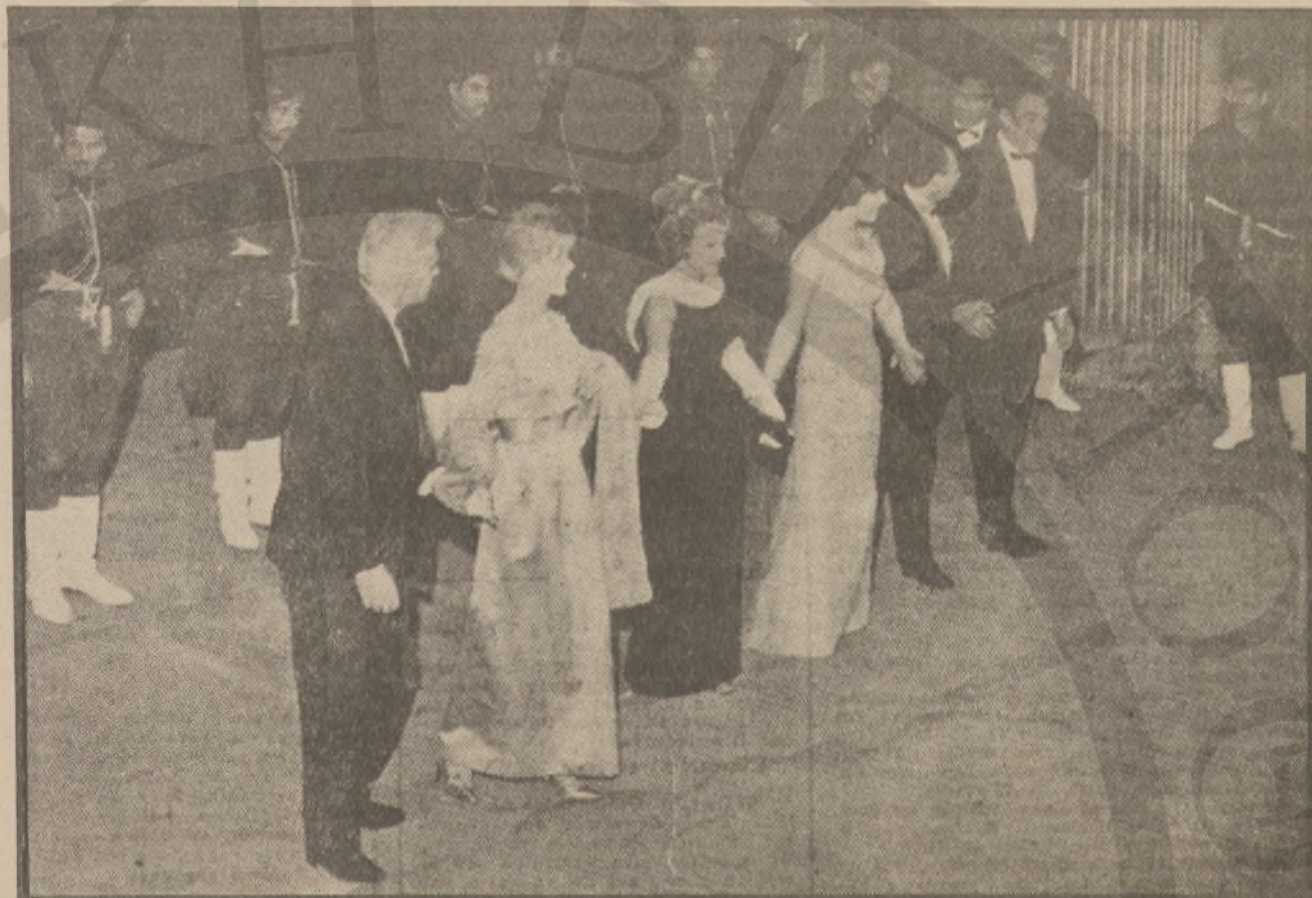
«Εννενηκοντα δραχμαί»: Η αμοιβή του Καζαντζάκη του 1910 (βλέπε κείμενο) αριστερά. Οι πρωταγωνιστές του «Ζορμπά»... Κουήν Κακογιάννης, Παπά, Κέντροβα κ.α.υποκλίνονται στο παρισινό κοινό, μετά την πρεμιέρα της ταινίας, το Μάρτη του 1965.

βευτική αμίδα, καταμεσής στην είσοδο του δρόμου, στολισμένη με πολύχρωμες σημαίες όλου του κόσμου — άποψε θα ήταν σίγουρα κι η ελληνική. Είναι η περίφημη «Κουρούβα». Από αιώνες τώρα η Γιοσιβάρα ήταν το βασίλειο του πρόχειρου έρωτα κι από τη θριαμβευτική τούτη αμίδα περνούσαν επί αιώνες οι σαμουράι, οι αρτίστες, ο λαός, σε χαρούμενες λιτανείες. Κι άπάνω από την αμίδα ήταν γραμμένα τα περίφανα τούτα χαρμόσυνα λόγια: