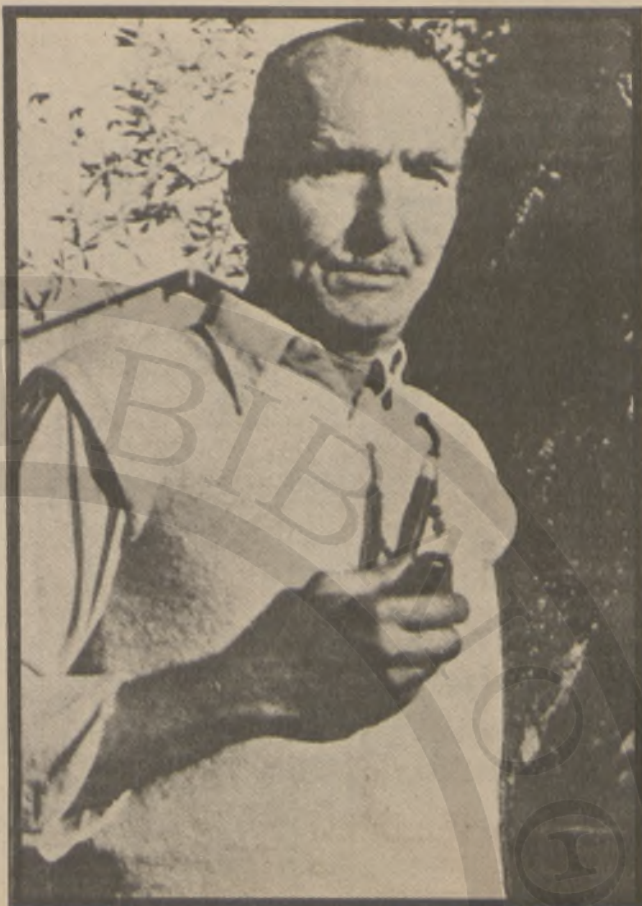
Ο μεγάλος Νίκος Καζαντζάκης στην Αίγινα το 1954. Ήταν λίγο πριν το τέλος.

ΕΤΣΙ, αποφάσισα σε δυο συνέχειες, μια σήμερα και άλλη την επόμενη Κυριακή να δώσω τα τιμώμενα και τόσο πρόσφατα δυο ΚΑΠΑ: Τον ΚΑΖΑΝ- ΤΖΑΚΗ και τον ΚΑΒΑΦΗ, με άγνωστες, όπως πιστεύω, προ- σωπικές μου λεπτομέρειες και με ορισμένες «εκπλήξεις» ακό- μα.