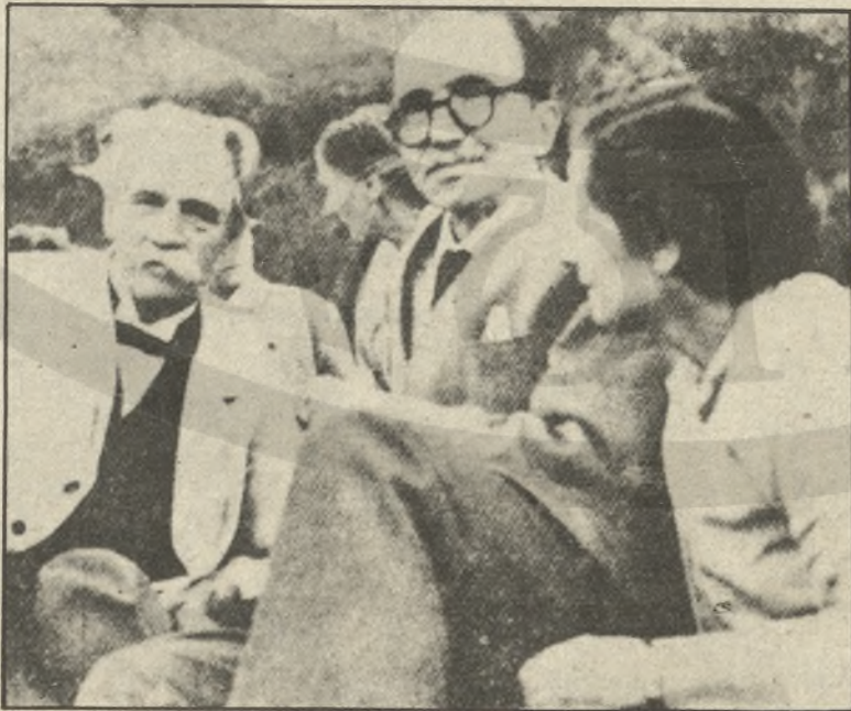
Ο Ν. Καζαντζάκης με τον Αλμπερτ Σβίτσερ και τη γυναίκα του Ελένη, στη γαλλική πόλη Κολμάρ, τον Αύγουστο του 1955.

...Το αύριο, έχοντας λιγότερη ανάγκη από την ωφελιμότητα, απαραίτητη σε ορισμένες εποχές, θα 'χει κάποια άλλα μάτια για να τον κρίνουν, με άλλα κριτήρια θα αποφασίσει όσο θα πρέπει να το θυμάται και πώς να το θυμάται.