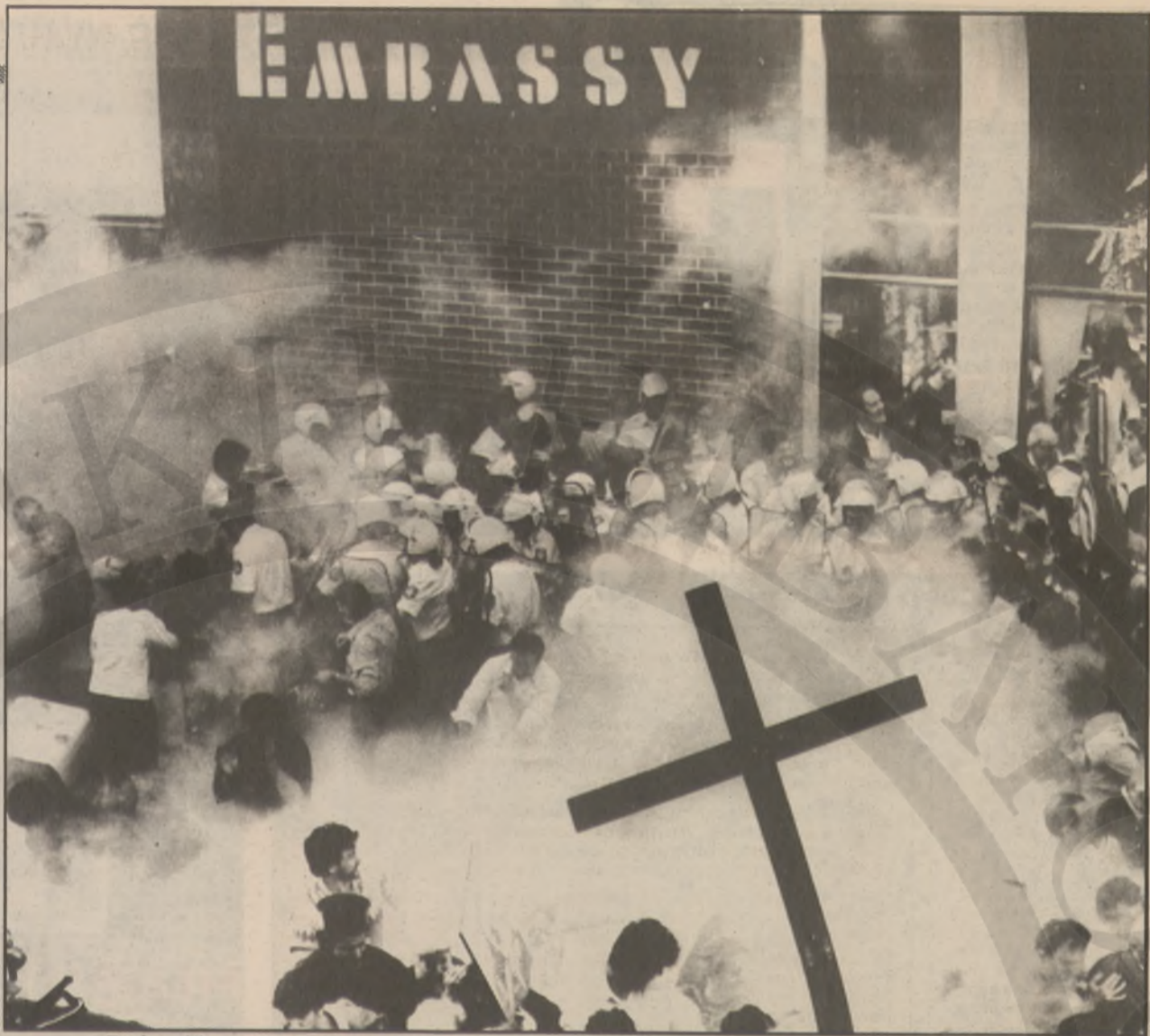
Εικόνα έξω από το «Εμπασσυ», την ώρα που πέφτουν τα δακρυγόνα. Τα σχόλια περιπεύουν