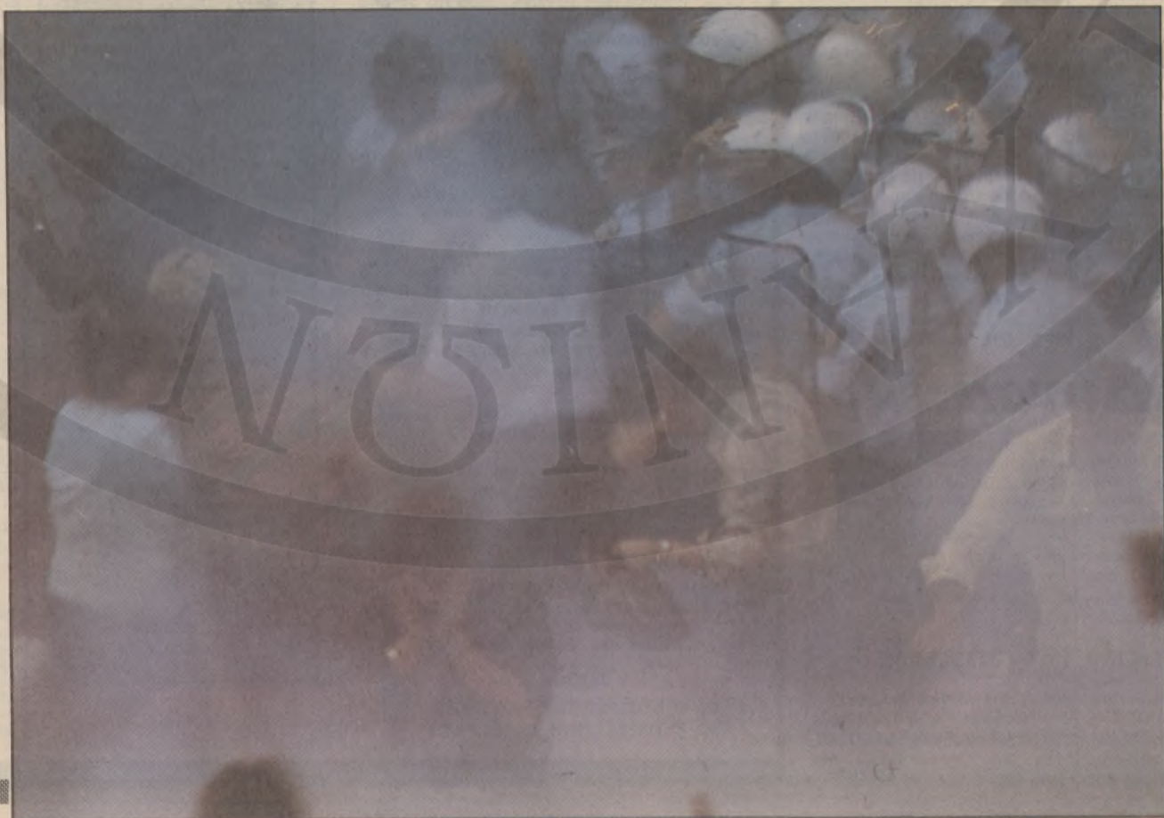
Νέφος δακρυγόνων πνίγει την Πατριάρχου Ιωακείμ, έξω από το «Εμπασσού», στο Κολωνάκι, ώρα 5.30

Οι αστυνομικοί και πάλι μπήκαν δεύτεροι στην αίθουσα και αρκέστηκαν να προστατεύσουν τους θεατές, που έβγαιναν σαν κλέφτες από την πίσω πόρτα, προπηλακίζόμενοι.