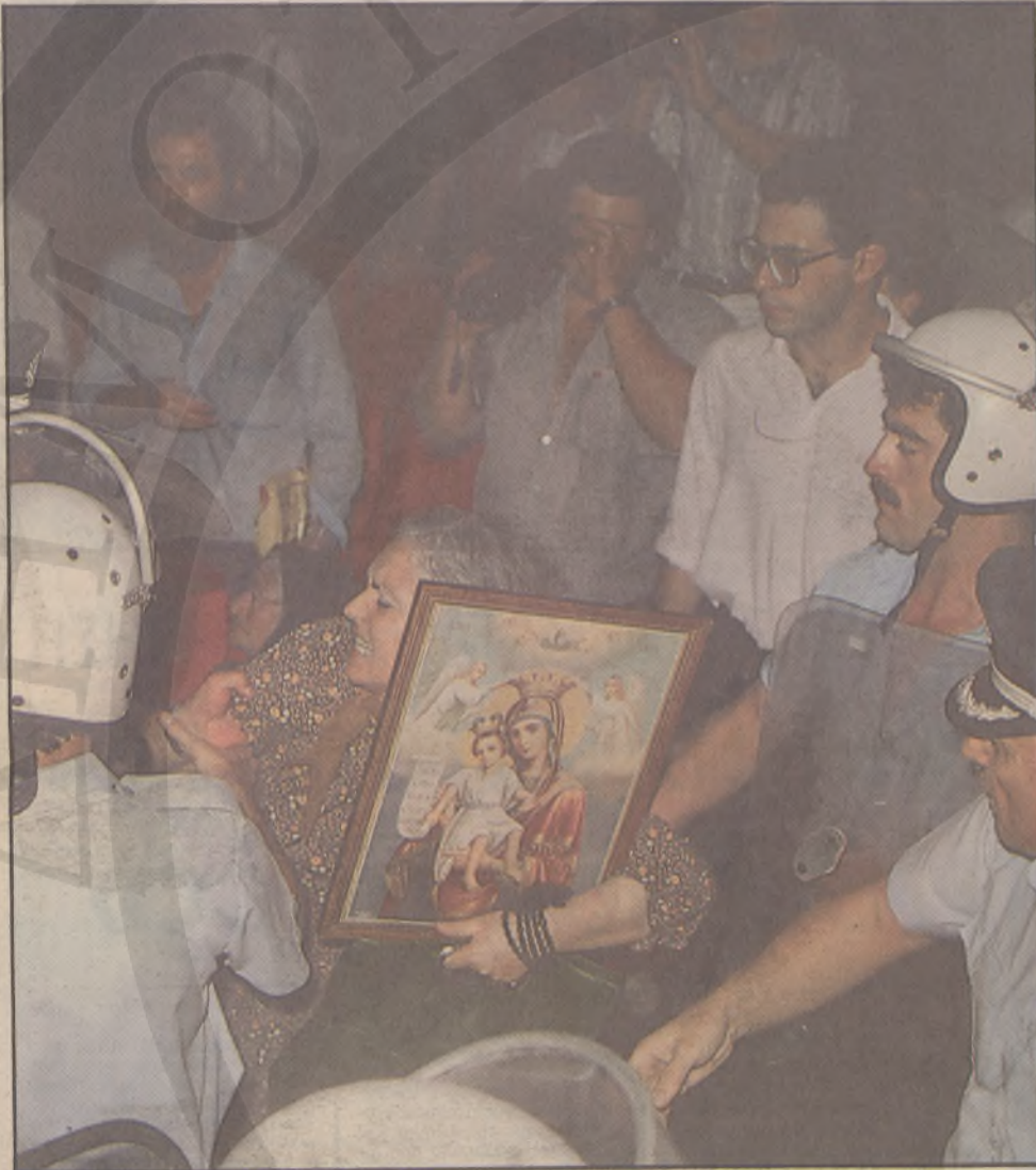
Μια θρησκευόμενη προτάσσει την εικόνα της Παναγίας, για να σπάσει τον κλοιό