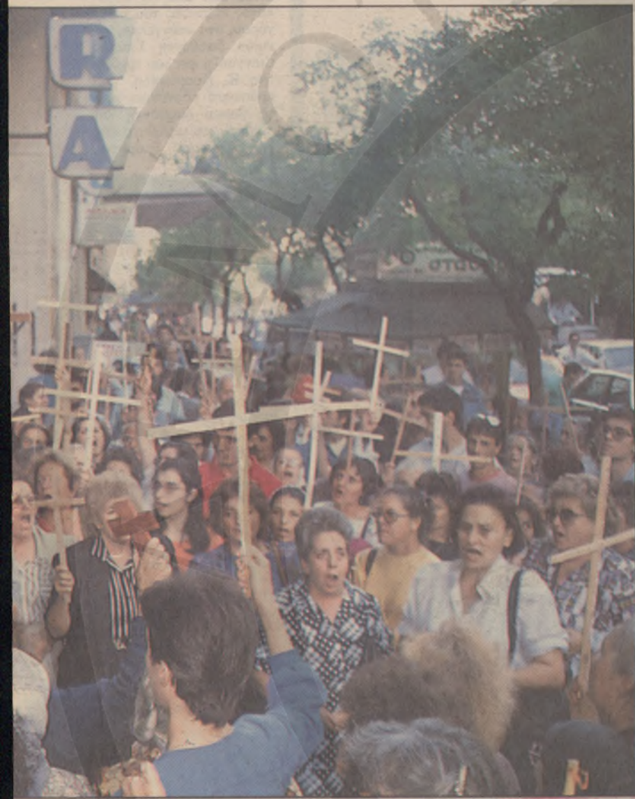
«Η ταινία να καεί», κραυγάζει λάβρος ο κληρικός (δεξιά). Εκατοντάδες διαδηλωτές έχουν αποκλείσει την οδό Ακαδημίας και πολιορκούν τον κινηματογράφο «ΟΠΕΡΑ». Με σταυρούς, λάβαρα και εικονίσματα κραυγάζουν συνθήματα κατά της ταινίας