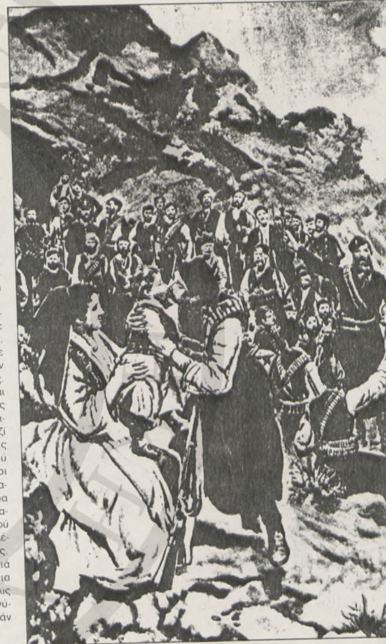
Εικόνα από την κρητική επανάσταση του 1896-1897. Πολεμιστής αποχαιρετά τη γυναίκα του το παιδί του. Τότε και ο καπετάν Μιχάλης πήγε την οικογένειά του στη Νάξο.

Τα πρώτα χρόνια του γάμου βίου της η Μαριγούλα πατούσε πόδι και αντιστεκόταν στις προσταγές και στην