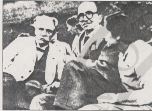
ΕΠΑΝΩ: Ο Καζαντζάκης με τον Αλμπερτ Σβόιτσερ και τη σύζυγο του Ελένη στην αλαστική πόλη Κολμάρ τον Αύγουστο του 1955. ΑΠΕΝΑΝΤΙ: Ο συγγραφέας με τον αγαπημένο φίλο του και μεταφραστή των έργων του Κίμωνα Φράιερ.

του, τα πάντα ήταν όπως τα είχε αφήσει. Μόνο η αυλή του σπιτιού του φαινόταν πιο μικρή, η πόλη δεν τον χωρούσε. Δεν είχε φίλους, οι γνωστοί του όλοι ο καθένας είχε αποσυρθεί στην προσωπική του ζωή, και αυτό τον έκανε να μην βγαίνει από το σπίτι· καθόταν μόνο κι έγραφε. Είναι η εποχή που πρωτοπαρουσιάζεται στα ελληνικά γράμματα. Όμως ο τόπος δεν τον χωράει, ούτε και σκέφτεται να δικηγορήσει στο Ηράκλειο, όπως ήταν ο κρυφός πόθος της μάνας του.