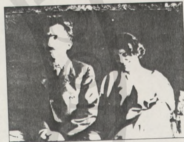
Ο Καζαντζάκης με τη σύζυγό του Γαλάτεια το 1920. Στην αρχή το ζευγάρι συζούσε. Η σχέση αυτή εξόργισε τους γονείς του συγγραφέα που και οι δυο δεν είδαν με καλό μάτι το ειδύλλιο. Ο πατέρας του μάλιστα του έκοψε το επίδομα. Ο ασυμβίβαστος και υπερήφανος Νίκος έφυγε από την Κρήτη και εγκαταστάθηκε με τη Γαλάτεια στην Αθήνα.

νη και σοβαρή κάτω από το αυστηρό μάτι του πατέρα του, του έκανε τρομερή εντύπωση η μια και μοναδική φορά που την είδε να γελάει και να χαιρέται και να λάμπει το πρόσωπό της από φρεσκάδα και ομορφιά. Στα παιδικά του μάτια η εικόνα αυτή έμεινε η πιο ζωντανή και αυτή ίσως διέγραφε το όραμα της γυναικείας μορφής γι' αυτόν μέσα