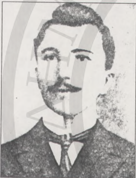
Ο Νίκος Καζαντζάκης φοιτητής. Το τελευταίο καλοκαίρι της φοιτητικής του ζωής του το πέρασε στο Ηράκλειο κοντά στη μάνα του.

μως έμπαινε το θεριό μέσα στο σπίτι όλοι εξαφανίζονταν από μπροστά του, γιατί ήθελε να είναι μόνος του. Η συμπεριφορά του την πίκραινε πολύ και τη μαράζωνε αλλά τα πράγματα δεν άλλαζαν. Χειροτέρεψαν όταν γέννησε το δεύτερο παιδί της, γιατί λέει είχε γαλανά μάτια. «Εμένα στο σόι μου δεν είχε κανείς μπλάβα μάτια», έλεγε με θυμό ο καπετάν Μιχάλης και η