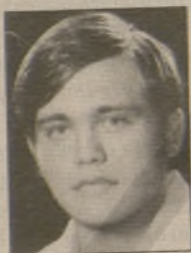
Του Κ.Γ. Καζανάκη *

Με μεγάλη έκπληξη, απορία και απογοήτευση, διάβασα στο φύλλο της “Π” της Τρίτης 8/8/2006 τη δεύτερη συνέχεια παλαιότερης δημοσιογραφικής έρευνας της κ. Ελένης Κατσουλάκη υπό τον πολύ ενδιαφέροντα τίτλο «Η σταύρωση του Νίκου Καζαντζάκη». Επειδή τα ιστορικά λάθη, οι υπερβολές και οι ανακριβείς περισσεύουν, επιθυμώ να παραθέσω τα γεγονότα όπως πράγματι συνέβησαν. Αλλά ας δούμε τα πράγματα με τη σειρά. «...Η φιλαρμονική του Δήμου» δεν «έπαιξε ξανά