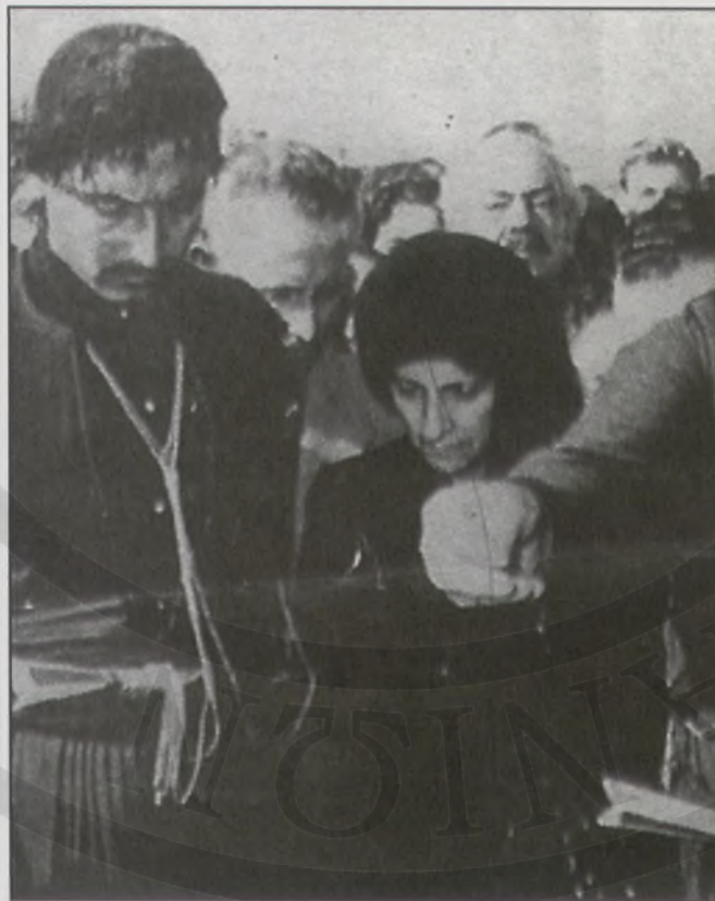
Η Ελένη Καζαντζάκη στην κηδεία του Νίκου Καζαντζάκη, το 1957 και δεξιά ο Πάτροκλος Σταύρου. Η "Διεθνής Εταιρία φίλων Νίκου Καζαντζάκη" ζητά να μάθει γιατί ο θετός γιος της δεν προχωρά στην κάλυψη των ελλείψεων που παρουσιάζονται στην κυκλοφορία των βιβλίων του μεγάλου Κρητικού συγγραφέα...

Πρόεδρος Διεθνούς Εταιρείας Φίλων Νίκου Καζαντζάκη Κύριο Γεώργιο Στασινάκη Case postale 2714 CH-1211 Genève 2 Dérôt Switzerland