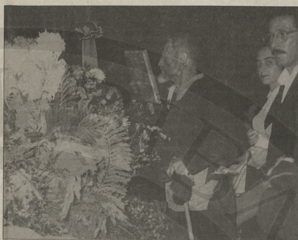
Ο γερο Κρητικός στον Άγιο Μηνά, αποδίδει τον τελευταίο χαιρετισμό

1957. Το Μάρτιο μπαίνει στην κλινική του Φράϊμπουργκ, για