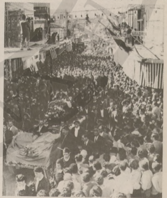
1957: Στιγμιότυπο από την κηδεία του Νίκου Καζαντζάκη στο Ηράκλειο.

Η προσέγγισή τους δεν τους επέτρεπε να αναγνωρίσουν στο πρόσωπο του Χριστού που σμίλευσε ο Νίκος Καζαντζάκης τους δύο χαρακτήρες, τον θεϊκό και τον ανθρώπινο, οι οποίοι βέβαια ακροβατούν πάνω στο