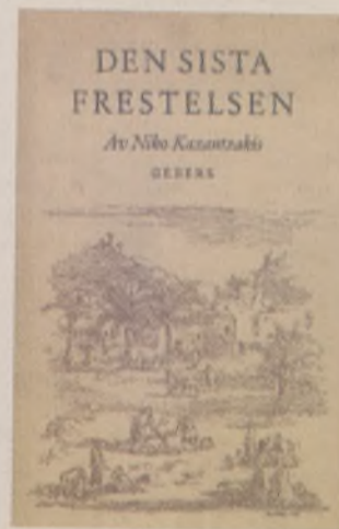
Η πρώτη έκδοση του μυθιστορήματος: Ο "τελευταίος πειρασμός" στα σουηδικά Στοκχόλμη: Hugo Gebbers Forlag, 1952.

Είναι μάλλον επιβεβαιωμένο πως ο Νίκος Καζαντζάκης απέφυγε τον αφορισμό κυριολεκτικά την τελευταία στιγμή μετά από προσωπική παρέμβαση στην Ιερά Σύνοδο της διαβόητης Φρειδερίκης που φοβόταν προφανώς το διεθνές ρεζιλίκι. Η Εκκλησία της Ελλάδας περιορίστηκε να καταδικάσει τα βιβλία, να καλέσει τους πιστούς να μην τα διαβάσουν και να ζητήσει εμμέσως από την πολιτεία να τα απαγορεύσει. Κι ακόμη παρέπεμψε ουσιαστικά το θέμα στην Εκκλησία της Κρήτης που υπάγεται στο Οικουμενικό Πατριαρχείο. Το ενδεχόμενο, ωστόσο, δίωξης του βιβλίου συζητήθηκε και μέσα στην ελληνική Βουλή με τους βουλευτές των κομμάτων του λεγόμενου "Κέντρου" (Μητσοτάκης, Ζορμπάς, Παπασπύρου κ.ά.) να ασκούν δριμύτατη κριτική. Πάντως, ο "Πειρασμός" συμπεριλήφθηκε και στο Index των Απαγορευμένων Βιβλίων του Βατικανού. Ο Καζαντζάκης απάντησε στέλλοντας στην Αγία Εδρα ένα τηλεγράφημα με την περίφημη φράση του Τερτυλιανού: «Στο δικαστήριό σου, Κύριε, κάνω έφεση» με την προσθήκη των φράσεων: «Με καταραστήκατε άγιοι πατέρες, εγώ σας δίνω την ευχή μου. Εύχομαι η συνείδησή σας να