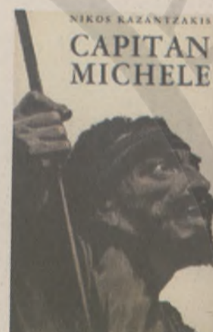
Η έκδοση του μυθιστορήματος: "Ο Καπετάν Μιχάλης" στα ιταλικά, Μιλάνο: Aldo Martello Editore, 1959.