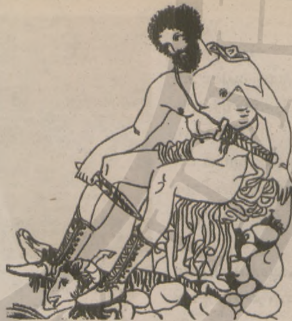
Ο Οδυσσεύς, που πάντα ταξιδεύει και μόνο τώρα αναπαύεται, μετά την επιστροφή του στην Ιθάκη, έτοιμος όμως, με ξεγυμνωμένο το σπαθί του, να φύγει πάλι, να ριχτεί σε νέες περιπέτειες για ν' αναζητήσει τη γνώση στην απόλυτη μορφή της ως αλήθεια.

Με τον Οδυσσέα του Καζαντζάκη που ψάχνει παντού, χωρίς σύνορα, όλος αγωνία, μένοντας πάντα ανικανοποίητος από το αποτέλεσμα των αναζητήσεών του, μοιάζει ο φιλόσοφος στην αναζήτηση της απόλυτης αλήθειας. Και με το φιλόσοφο αυτό, μοιάζει επίσης ο ίδιος ο Καζαντζάκης που διακρίνεται από μια φιλοσοφική διάθεση, με μεταφυσικές ανησυχίες. Και που σαν τέτοιος αναζητά κι αυτός όχι μια μερική, σχετική αλήθεια, αλλά την ολοκληρωμένη, την απόλυτη αλήθεια. Η διαθεσή του αυτή εκδηλώθηκε ήδη από νωρίς, όταν μετά τις σπουδές του στην Αθήνα, παρακολούθησε στο Παρίσι για δύο χρόνια τις παραδόσεις του Μπερζόν που τον επηρέασε αποφασιστικά με τη φιλοσοφία του στη διαμόρφωση της προσωπικότητάς του.