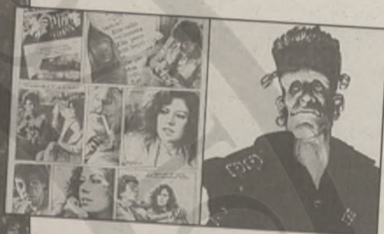
«Το κόμικ της ισπανικής μεταπολίτευσης» στο Κέντρο Τεχνών ACS Χαλανδρίου

Καζαντζάκη, το Ευρωπαϊκό Κέντρο Λογοτεχνικής Μετάφρασης και το λογοτεχνικό περιοδικό «Νέα Εστία» σε μια προσπάθεια συνοδικότερης επένδυσης μενάντι του. Το Auditorium του Γαλλικού Ινστιτούτου (Σίνα 31) θα φιλοξενήσει έκθεση –ελληνικών και ξενόγλωσσων– βιβλίων του Κρητικού συγγραφέα σε συνεργασία με το Εθνικό Κέντρο Βιβλίου (22 έως 25 Οκτωβρίου).