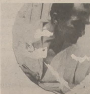
Ο Νίκος Καζαντζάκης πρόεδρος του κόσμου