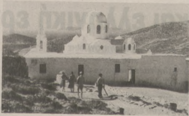
Οδοιπορικό στο Μοναστήρι, πριν το 1950.