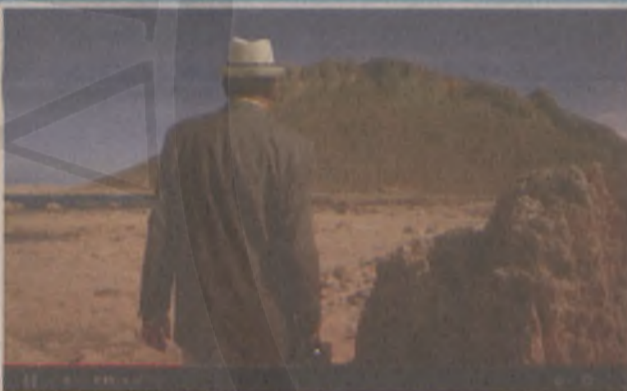
Chania: A journey through the countryside

Η ηλεκτρονική διεύθυνση της ιστοσελίδας είναι: http://dim-vamvak.chan.sch.gr/wordpress