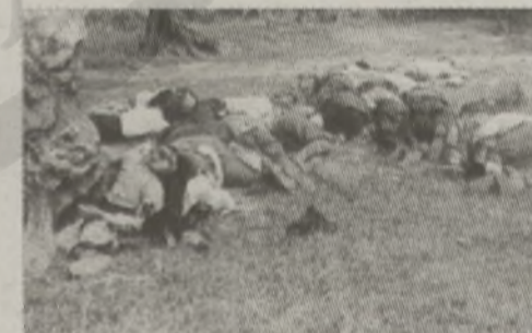
Αύριο Τετάρτη, 23/10/2013: Το ολοκαύτωμα στον Κακόπετρο (24 Μαΐου 1941).