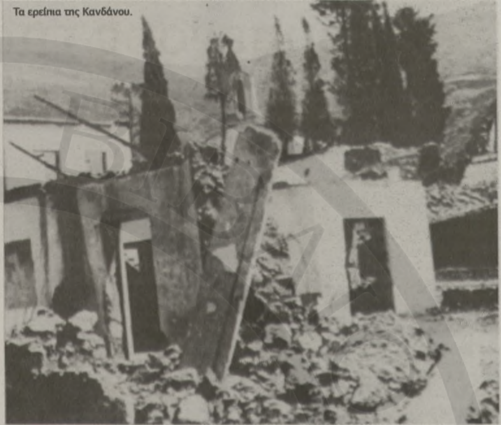
Τα ερείπια της Κανδάνου.