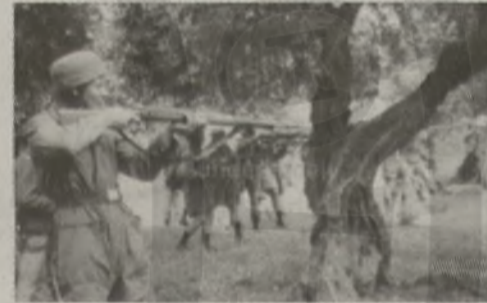
Αλεξιπτωτιστής των Ναζί δίνει τη χαρακτηριστική βολή στους 23 εκτελεσμένους άμαχους στο Κοντομαρί Χανίων (02 Ιουνίου 1941 -)