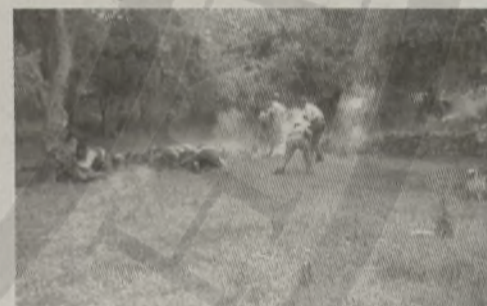
Φωτογραφίες του Franz Peter Weixler (πολεμικός ανταποκριτής της Βέρμαχτ) από την πρώτη εν ψυχρώ εκτέλεση 23 αμάχων στην κατεχόμενη, από τους Ναζί, Ευρώπη με προσωπική διαταγή του Γκαίριγκ που σημειώθηκε στις 02 Ιουνίου 1941 στο Κοντομαρί Χανίων.