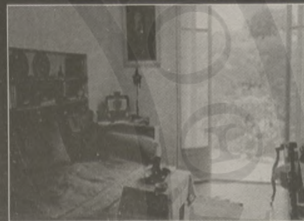
Το σπίτι του Κρητικού συγγραφέα στην Αντίπ.