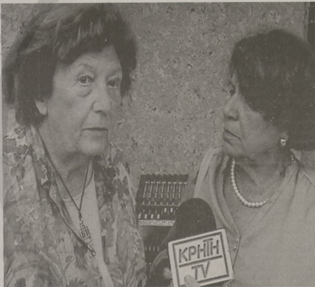
Η στενή συνεργάτιδα του Νίκου Καζαντζάκη, Yvette Renoux.

«Ήδη υπάρχει αναμνηστική πλάκα στη μικρή πλατεία που είναι μπροστά από το σπίτι. Δε βρίσκω το λόγο γιατί να αγοραστεί αυτό το σπίτι... Όποιος θα το αγοράσει... ποιο θα είναι το κίνητρό του; Τι θα το κάνει μετά; Μουσείο δεν μπορεί να γίνει... Κέντρο μελετών δεν μπορεί να γίνει... Δεν είναι μόνο να αγοραστεί ένα σπίτι, είναι και το τι θα γίνει μετά... Δεν πρέπει να αγοραστεί το σπίτι», δηλώνει με νόημα η συνεργάτιδα του καταξιωμένου Κρητικού συγγραφέα.