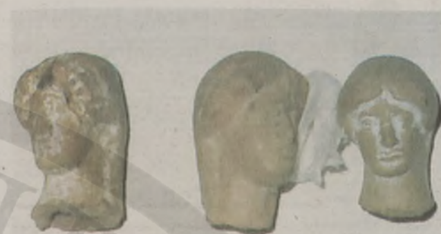
Ειδώλια - αφιερώματα.

Ας σημειωθεί ότι όταν εξερευνούσα το σπήλαιο Λερά το έτος 1959 και αντιλήφθηκα επιφανειακά το πλήθος των θραυσμάτων από την αρχαία περίοδο δεν γνώριζα την αξία των ευρημάτων και ίσως... χάρισα μερικά κάτω σε θαμώνες του μοναδικού τότε