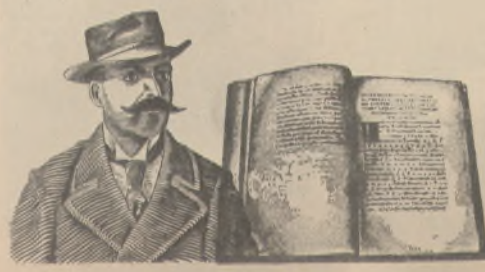
ΕΚΘΕΣΗ ΒΙΒΛΙΟΥ ΔΗΜΟΣΙΟΓΡΑΦΩΝ - ΣΥΓΓΡΑΦΕΩΝ ΣΤΗ ΜΝΗΜΗ ΙΩΑΝΝΟΥ ΚΟΝΔΥΛΑΚΗ 1914 - 1979 ΑΘΗΝΑΙ 6 - 12 - 79