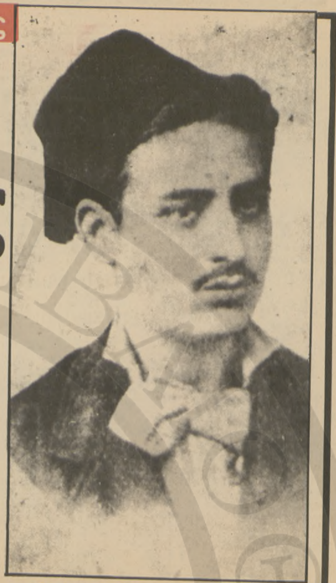
Ο Ιωάννης Κονδυλάκης σε νεαρή ηλικία.

Ο Ιωάννης Κονδυλάκης, ο δημοφιλέστατος «Διαβάτης» των νεοελληνικών γραμμάτων επανέρχεται στην επικαιρότητα με το νέο βιβλίο του καθηγητή Θεοχάρη Δετοράκη που τυπώνεται με δαπάνη του συλλόγου Πολιτιστικής Ανάπτυξης Ηρακλείου. Μια σύντομη βιογραφική παρουσίαση του κρητικού λογοτέχνη και του περιεχομένου του βιβλίου που αναφέρεται σ' αυτόν έκανε πριν λίγες μέρες ο καθηγητής κ. Θ. Δετοράκης μιλώντας σε εκδήλωση του Λυκείου Ελληνικών: