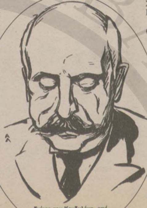
Σκίτσο του Κονδυλάκη, από τον ζωγράφο Α. Λάζαρη.

γράφους και ποιητές, σάλπισμα εγερτήριο πολεμικών. Καθώς αυτό που προέχει εκείνη τη στιγμή, δεν είναι η αλήθεια της Ιστορίας αλλά η ιδεολογική χρήση της Ιστορίας: ούτε η άμεμπτη φιλολογική έκδοση των όποιων κειμένων εξυπηρετούν και εμπνέουν το πατριωτικό-επαναστατικό φρόνημα. Αυτό είναι "το προσκλητήριο των καιρών", ως θα έλεγε ο Παλαμιάς, δέκτες ευαίσθητοι του οποίου είναι και οι δύο συγ-