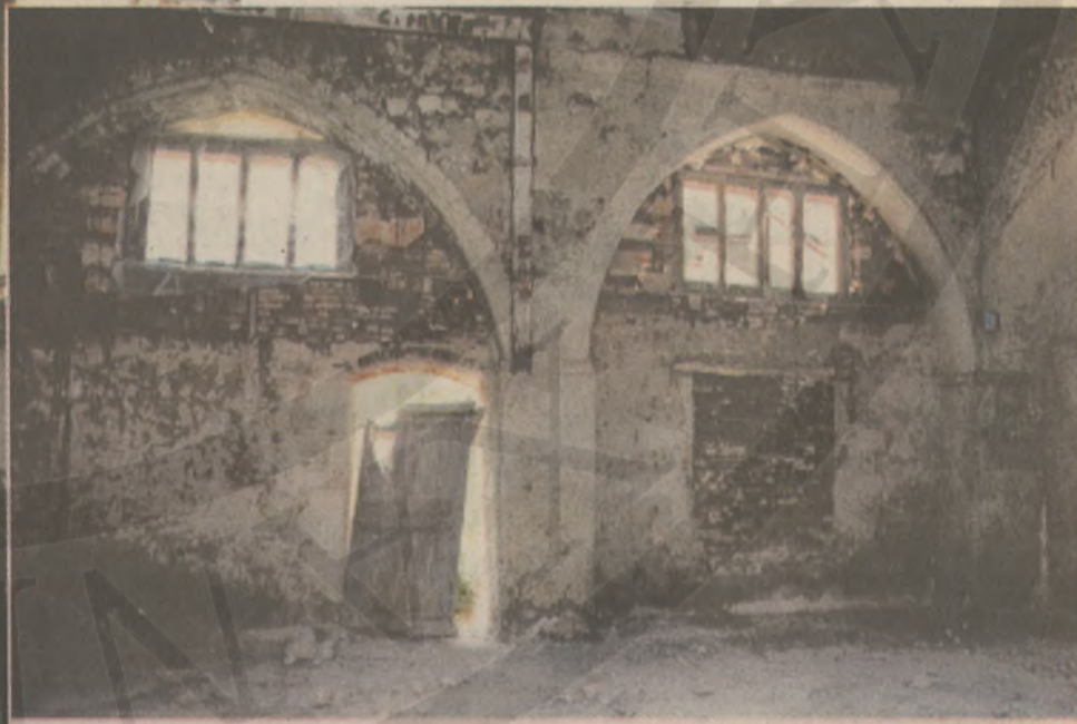
Το εσωτερικό της Συναγωγής

πληθυσμού, αλλά και η αντιεβραϊκή προδιάθεση μέρους των υπολοίπων κατοίκων και των φορέων της εξουσίας, είναι καταστάσεις απέναντι στις οποίες, αλλά και με τις οποίες, καλούνται οι Εβραίοι της Κρήτης να συμβιώσουν, αλλά και να επιβιώσουν. Η παρουσία των Εβραίων στην Κρήτη είναι αισθητή, ήδη από την αρχαιότητα. Σταυροδρόμι, ανάμεσα σε