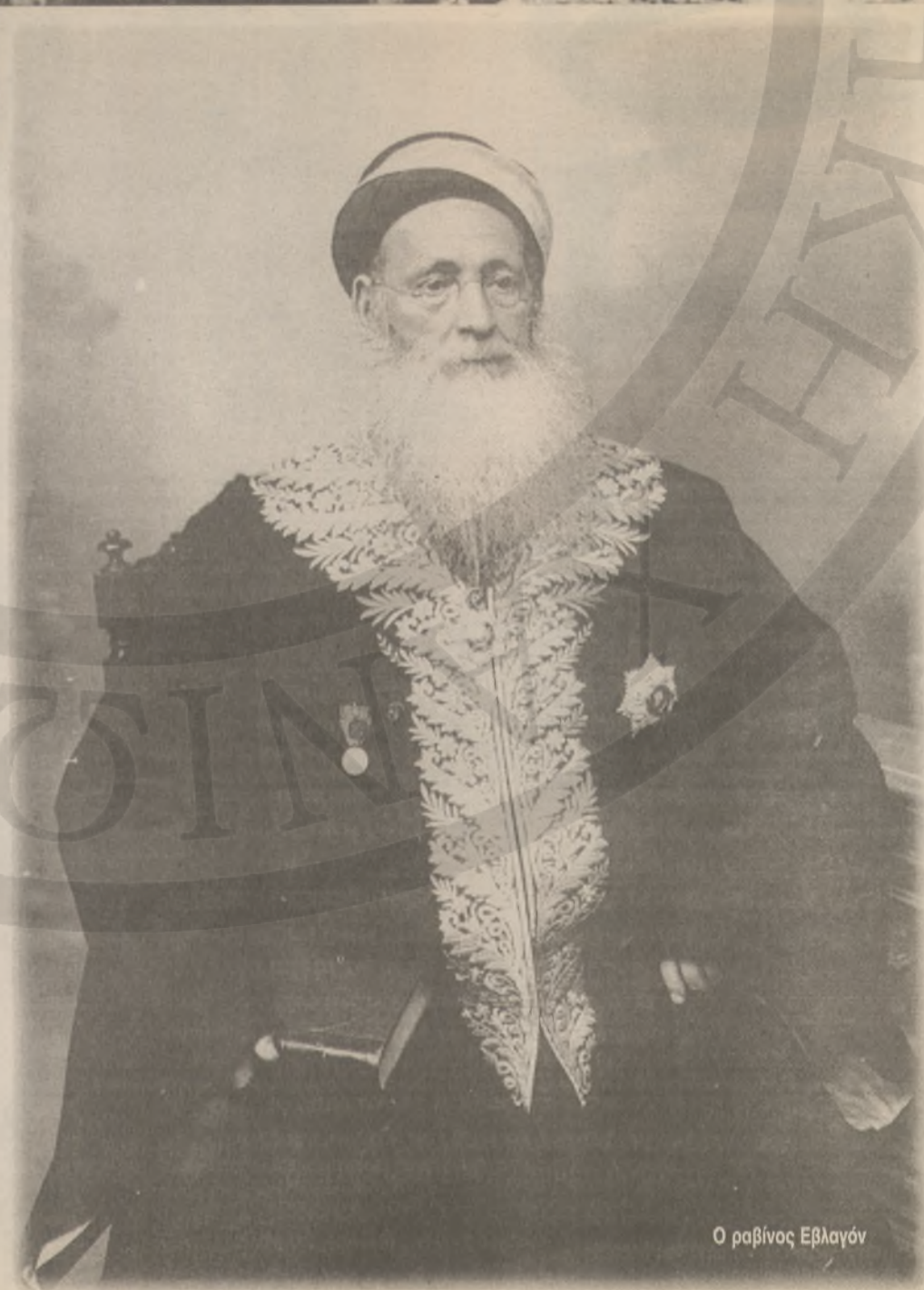
Ο ραβίνος Εβραγόν

Κ τίρια, πόρτες, κτερίσματα, επιγραφές, θρησκευτικά ιδρύματα, δηλώνουν και επιβεβαιώνουν την παρουσία Εβραίων στην Παλιά Πόλη των Χανίων. Αρχιτεκτονικοί ρυθμοί, εποχές, κατακτητές, κάτοικοι. Άνθρωποι που ήρθαν, άνθρωποι που φύγανε. Αλλά και άνθρωποι που χάθηκαν. Έλληνες, Λατίνοι, Οθωμανοί, Εβραίοι. Το θέμα του ολοκληρωτικού χαμού των Εβραίων της Κρήτης κατά την περίοδο της Γερμανικής Κατοχής έχει απασχολήσει κατ' επανάληψη Έλληνες και ξένους ιστορικούς ερευνητές. Αυτή η μαζική εξόντωση των Εβραίων μαζί με Χριστιανούς συμπολίτες τους επετεύχθη με τη βύθιση του πλοίου "Τάναϊς", που τους μετέφερε στον Πειραιά μετά τη σύλληψή τους. Το κρίσιμο ερώτημα ήταν πάντα ποιός βύθισε το πλοίο, το οποίο οδήγησε στον ομαδικό θάνατο εκατοντάδες αθώους; Το έκαναν οι ίδιοι οι Γερμανοί, προήλθε από λάθος συμμαχικού υποβρυχίου; Τί ακριβώς συνέβη;