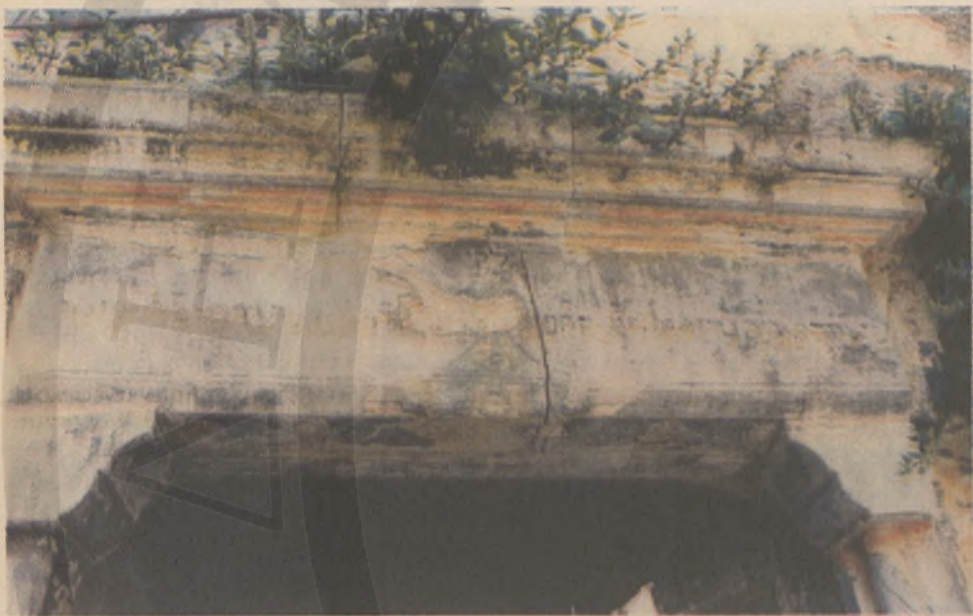
Κτητορική επιγραφή στην είσοδο της Συναγωγής

Δύο επιγραφές, μια στην εξωτερική είσοδο και μια στην κεντρική εσωτερική, γραμμένες εβραϊσί, οριοθετούν το χώρο. Αστέρια του Δαβίδ, στις μεταλλικές σιδεριές των ημικυκλικών παραθύρων, θυμίζουν... Προσκαλούν... Πρόσφατα κάποιος έβαψε τον εξωτερικό τοίχο της Συναγωγής γαλάζιο, στο χρώμα του Αιγαίου και της Μεσογείου. Του ουρανού και της θάλασσας. Στο χρώμα των δύο πατρίδων, της Ελλάδας και του Ισραήλ. Η οροφή έχει υποχωρήσει - αλλά απ' ό,τι φαίνεται, η επισκευή δε θ' αργήσει. Οδός Κονδυλάκη, Σκουφών, Δούκα, Ζαμπελίου, Πόρτου, πολύδουοι δρόμοι μιας ερημωμένης γειτονιάς. Κάποιοι χάθηκαν. Διαβατάρικα πουλιά, που τα λάβωσαν και τα 'πνιξαν. Νέοι κάτοικοι, ξένοι. Γενιές που ξεκληρίστηκαν. Μια γειτονιά χαμένη. Απόμεινε μονάχα το όνομα. Οβριακή. Για να σηματοδοτεί, να θυμίζει και να στολίζει τα Χανιά.