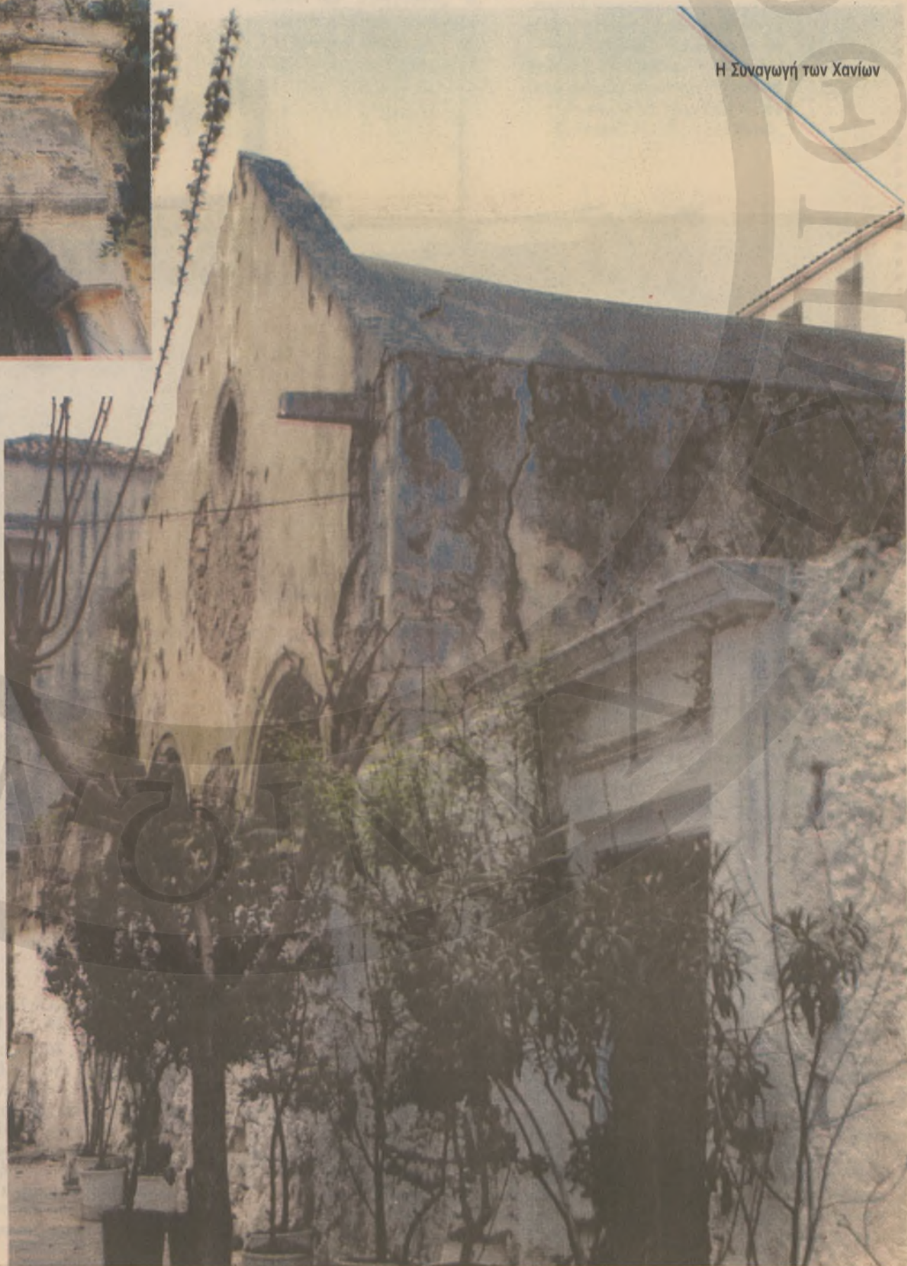
Η Συναγωγή των Χανίων