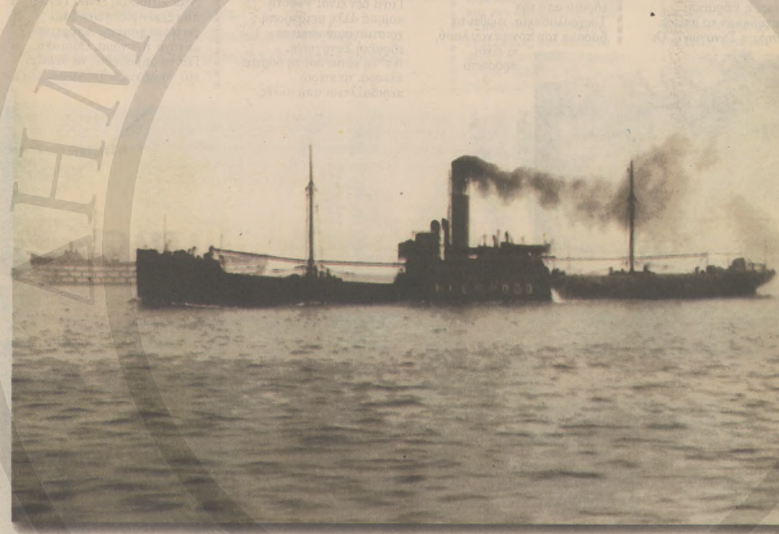
Το ατμόπλοιο "Τάναϊς", με τη βύθιση του οποίου οι Εβραίοι της Κρήτης βρήκαν τραγικό θάνατο τον Ιούνιο του 1944.