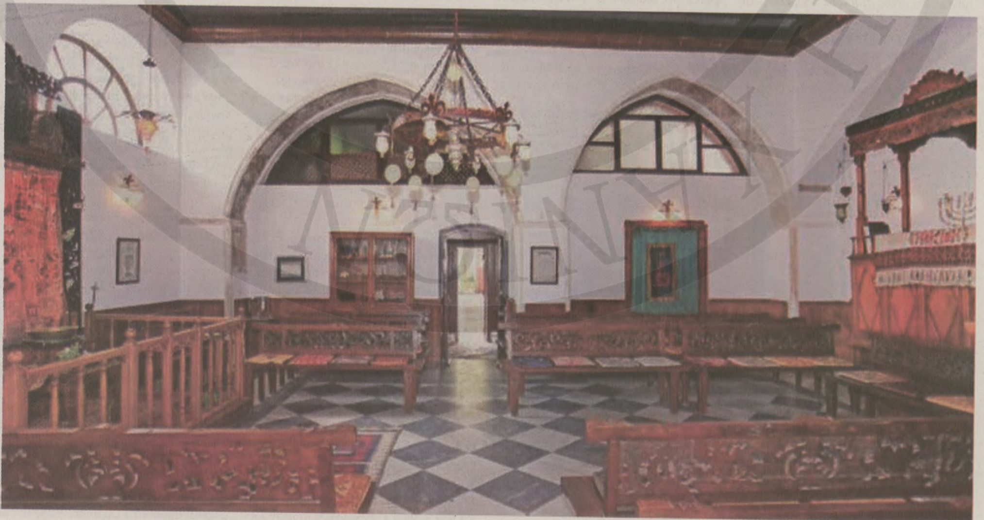
Η συναγωγή Ετζ Χαγίμ εσωτερικά μετά την πλήρη αποκατάσταση

Το απόγευμα της 7ης Ιουνίου, οι περίπου 350 Εβραίοι μαζί με 250 Κρητικούς κρα-