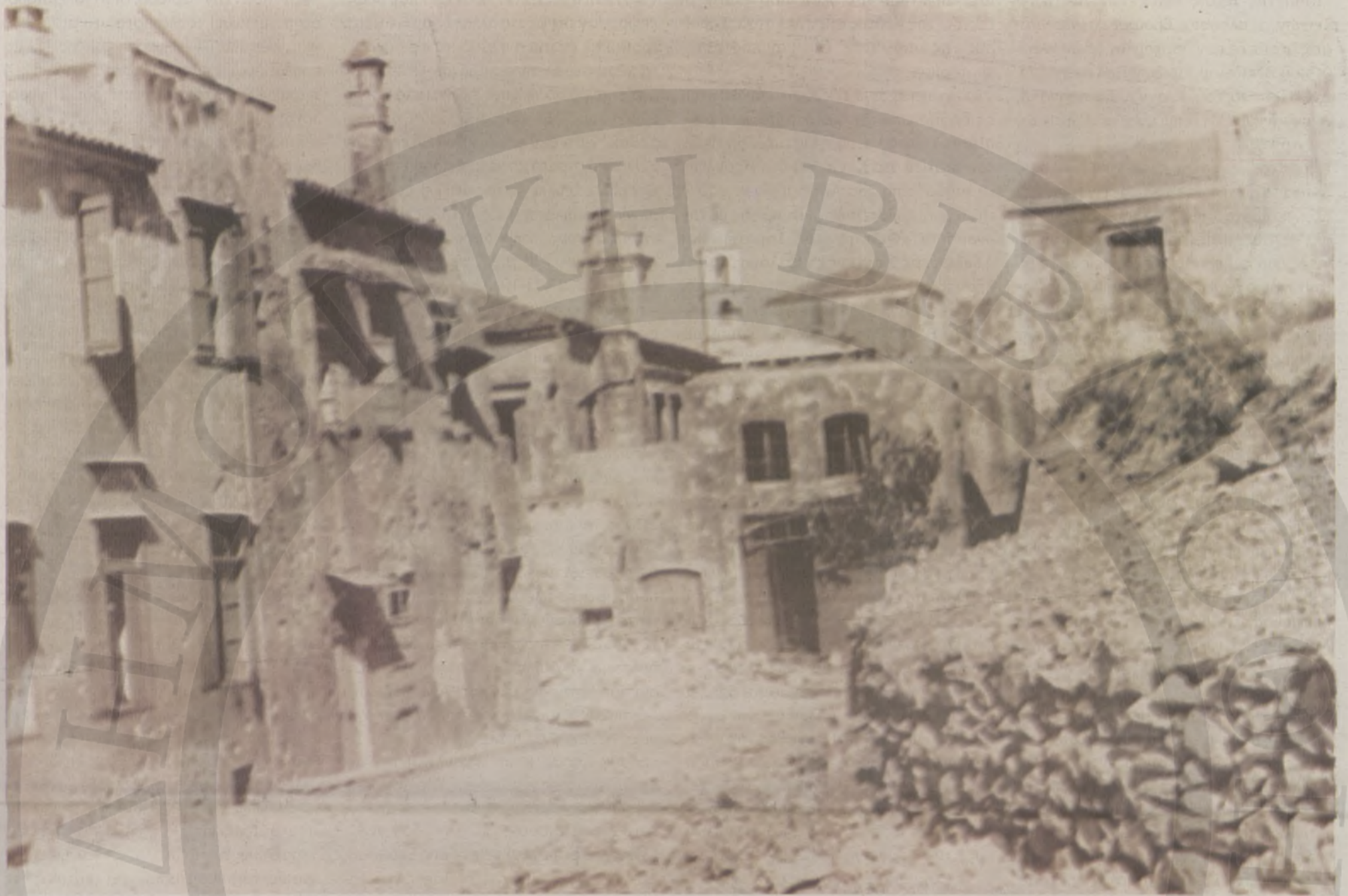
Η βομβαρδισμένη Συναγωγή το 1942

όταν τα Οθωμανικά στρατεύματα αποπλίστηκαν και εγκατέλειψαν την Κρήτη, οι Εβραίοι πανικοβλήθηκαν. Ιδιαίτερα βλέποντας ότι εκτός από τους Τούρκους και αρκετές χιλιάδες Κρήτες μουσουλμάνοι αποχωρούσαν μαζί τους, μη νοιώθοντας ασφάλεια, παρά τις εγγυήσεις που παρείχαν οι λεγόμενες Μεγάλες Δυνάμεις της εποχής για την προστασία τους. Ο αρχι-