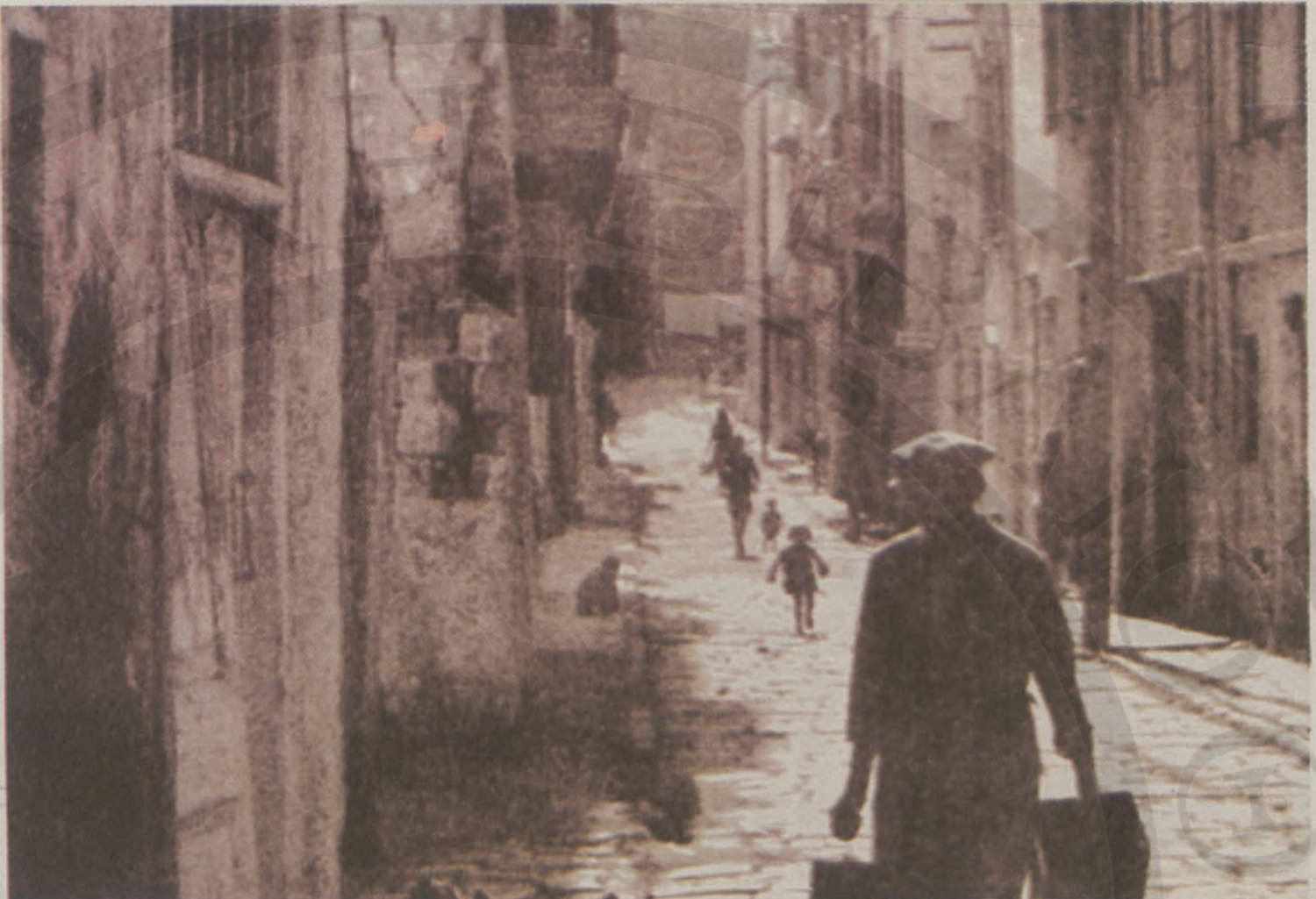
Γωνία Κονδυλάκη και Πόρτου με τη Συναγωγή Μπεθ Σαλόμ (στη γωνία δεξιά) το 1937

Στη διάρκεια του πολέμου μεταξύ Βενετίας και Οθωμανικής Αυτοκρατορίας, η πόλη του Χάνδακα ερημώθηκε από την οποία οι Εβραίοι με πολλοί Χριστιανοί κάτοικοι της μετοίκησαν στα Ιόνια νησιά. Έτσι, το 1669 εγκαινιάστηκε στη Ζάκυνθο η συναγωγή των Εβραίων προσφύγων της Κρήτης η οποία ονομάστηκε «Κρητι-