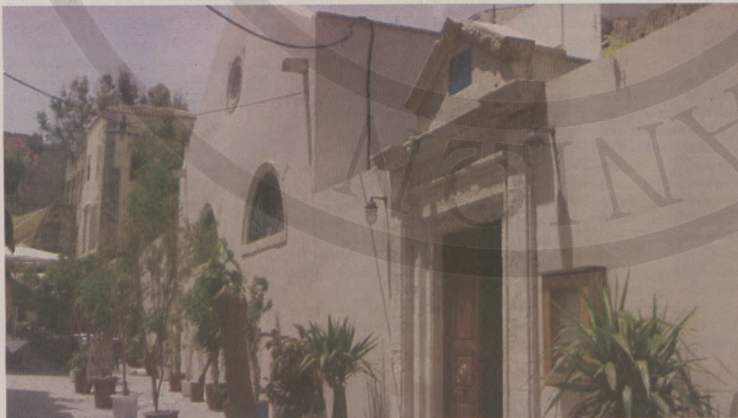
Η εξωτερική όψη της συναγωγής Ετζ Χαγίμ

Η κατάκτηση της Κρήτης από τους Οθωμανούς χρειάστηκε περίπου όλο τον 17 ο αιώνα για να πραγματοποιηθεί. Το δυτικό τμήμα του νησιού έπεσε σχετικά γρήγορα στον οργανωμένο στρατό του Γιουσουφ Πασσά. Όμως, για την κατάληψη του Ηρακλείου χρειάστηκε μία 20ετής περίπου πολιορκία, έως ότου το κάστρο καταληφθεί από τους Οθωμανούς. Η πορεία των Εβραίων της Κρήτης άλλαξε άρδην κάτω από την οθωμανική διοίκηση. Τα γκέτο στις πόλεις άνοιξαν και οι Εβραίοι μπορούσαν να κατοικήσουν και σε περιοχές που είχαν εγκαταλειφθεί από τους Ενετούς. Η Κρήτη γενικότερα μπήκε σε μια διαφορετική οικονομική τροχιά και λιμάνια όπως αυτά της Ιεράπετρας, του Ρεθύμνου και των Χανίων άρχισαν επικοινωνία με την Σμύρνη, την Αλεξάνδρεια και τη Βεγγάζη. Ο Εβραϊκός πληθυσμός συνεχίζει να αυξάνεται με γρήγορους ρυθμούς, κάτι που πιθανόν να σχετίζεται και με τη μεταφορά της πρωτεύουσας του Ελαγιετίου της Κρήτης στα Χανιά στα 1850. Έτσι, όπως πληροφορούμαστε από τη « Χωρογραφία Κρήτης, συνταχθείσα τω 1818 υπό Ζαχαρίου Πρακτικίδου, παρεισάκτου πληρεξουσίου και γενικού φροντιστού της δικαιοσύνης τω 1822-1829 εν Κρήτη », (Νέα έκδοση, Ηρά-