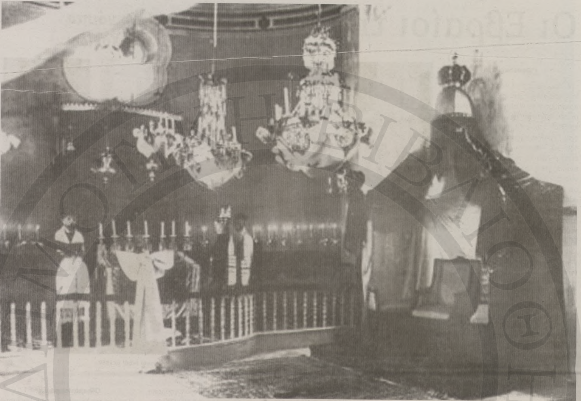
Εσωτερικό Μεγάλης Συναγωγής Μπέθ Σαλόμ. Λεύκωμα Φιλολ. Συλλόγου «Χρυσόστομος» λίγο πριν την επίσκεψη του βασιλιά Κωνσταντίνου στις 1-12-1913 μέρα της Ένωσης της Κρήτης με την Ελλάδα.