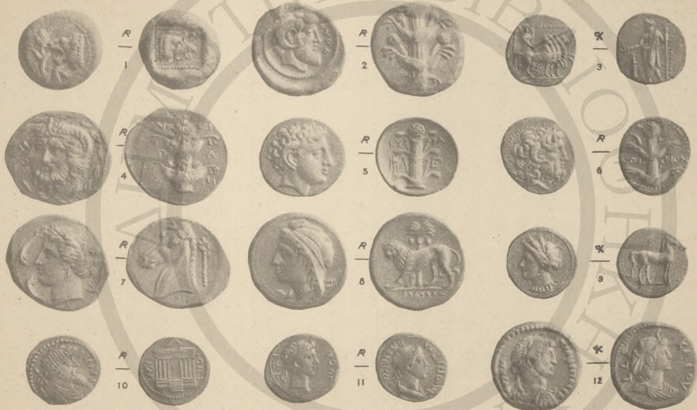
ΚΥΡΗΝΑΪΚΗ, 1-6. ΣΙΥΓΙΤΑΝΙΑ, 7-9. (ΚΙ! ΛΕ!). ΝΟΥΜΙΔΙΑ, 10. ΜΑΥΡΙΤΑΝΙΑ, 11. ΑΙΓΥΠΤΟΣ, 12. (Λ! ΛΑ! ΛΕ!)