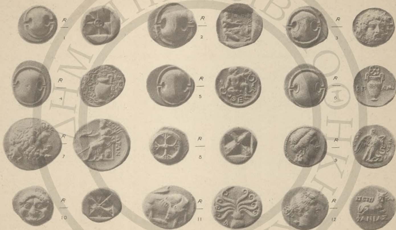
ΒΟΙΩΤΙΑ, 1-7. ΕΥΒΟΙΑ, 8-12, (ΚΓ.).