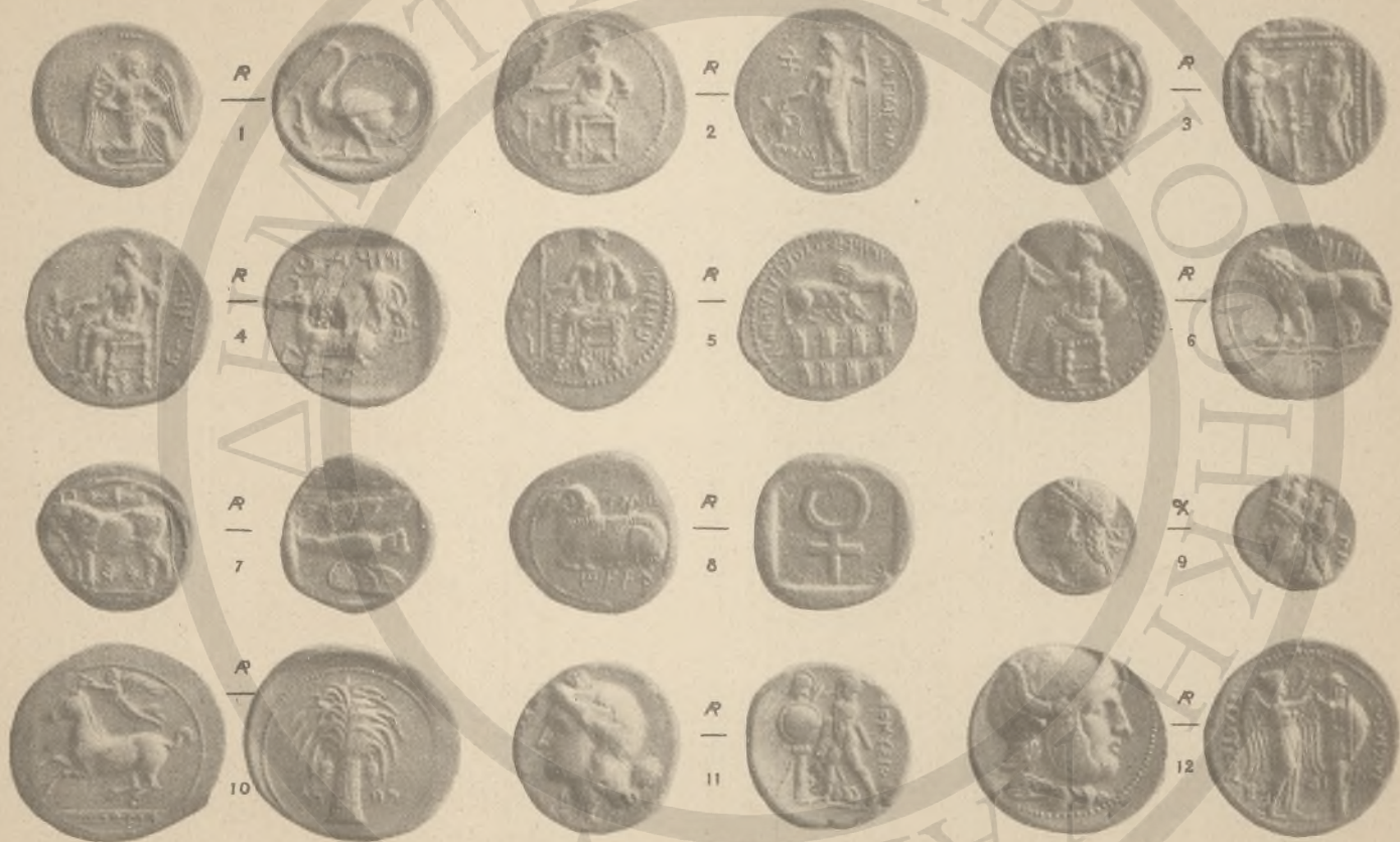
ΚΙΛΙΚΙΑ, 1-6, (ΚΕ'). ΚΥΠΡΟΣ, 7-9, (ΛΑ'). ΣΥΡΙΑ, 12, (ΚΗ' ΚΟ' ΛΓ'). ΒΙΘΥΝΙΑ, 11, (ΚΦ'). ΙΕΥΓΙΤΑΝΙΑ, 10, (ΛΔ' ΛΕ').