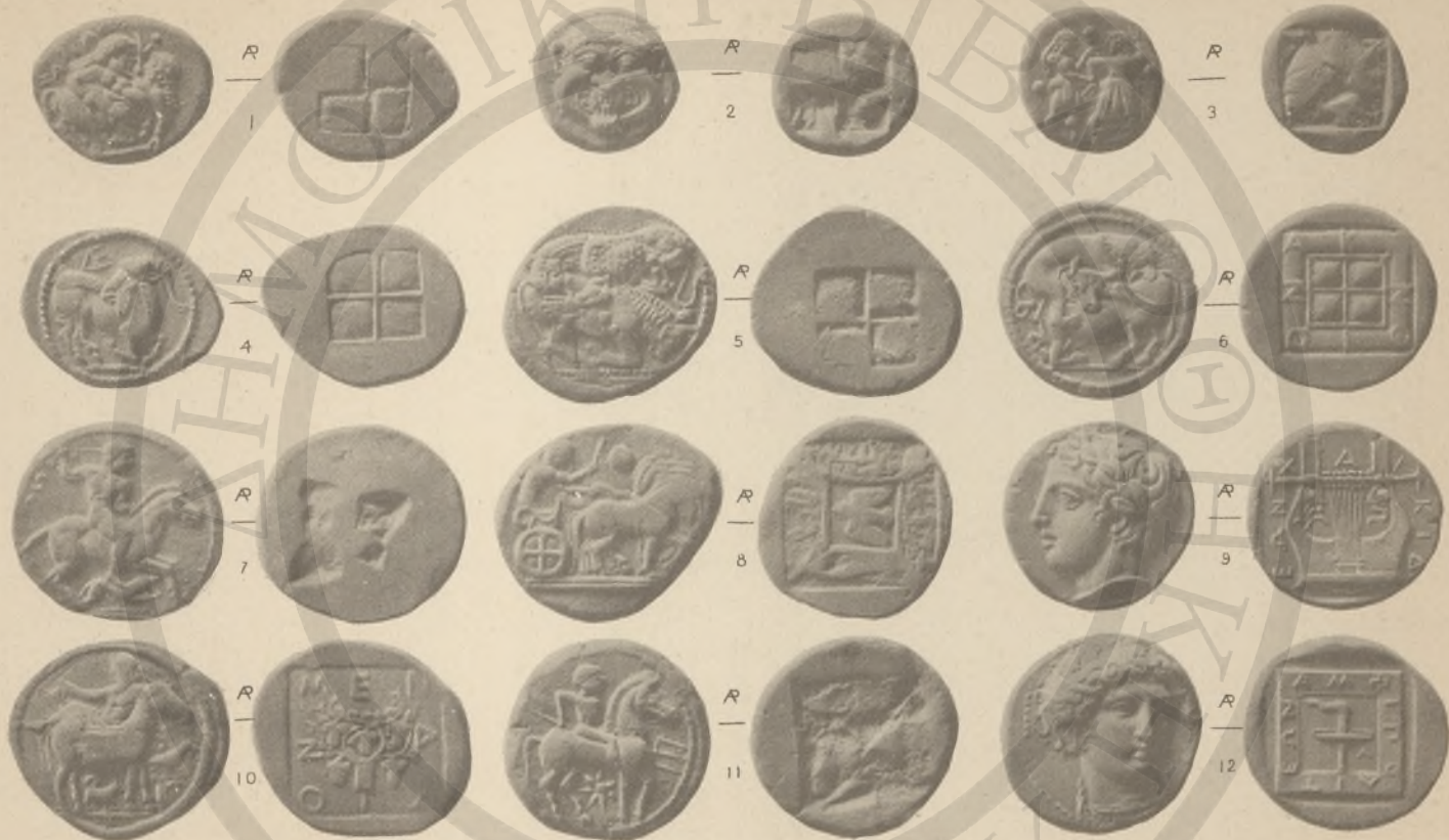
ΜΑΚΕΔΟΝΙΑ, 1-12, ( 1, 1B, 15, 10! ).