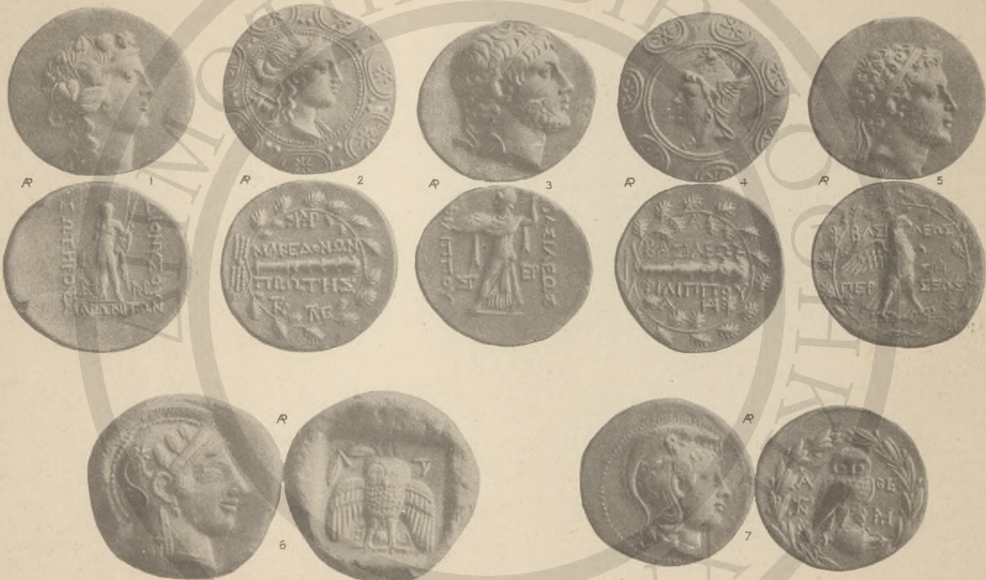
ΘΡΑΚΗ, 1. (ΓΓ'ΙΔ'ΛΒ').