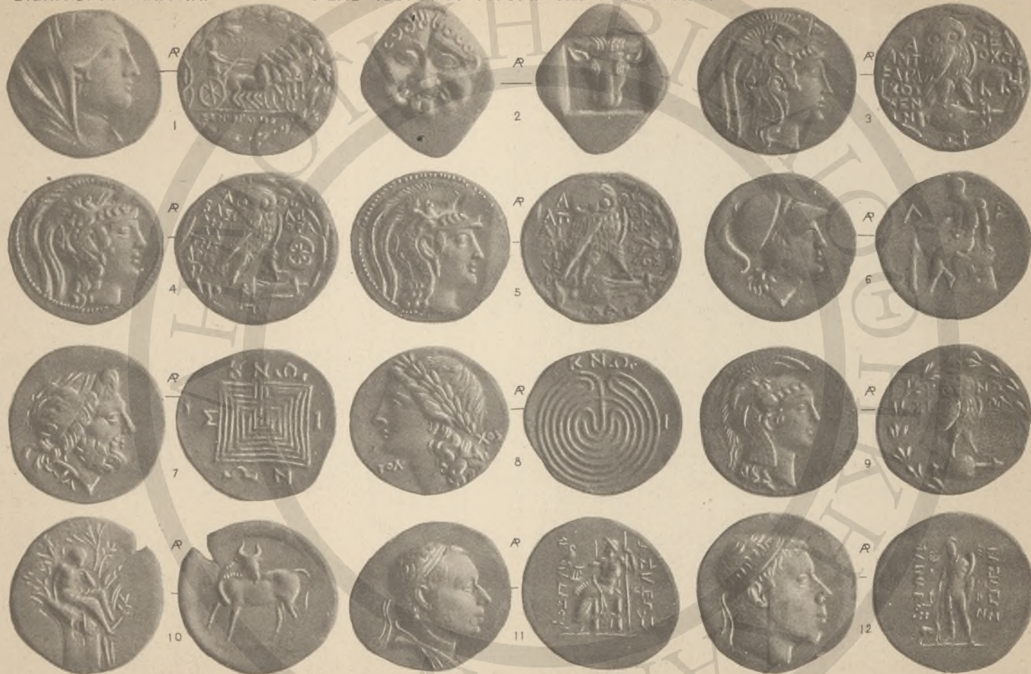
ΕΥΒΟΙΑ. 1- 2,(ΙΙ'). ΑΤΤΙΚΗ, 2-5,(ΙΗ' ΙΘ'). ΛΑΚΩΝΙΚΗ.6. ΚΡΗΤΗ, 7-9,(ΚΑ' ΚΒ). ΠΟΝΤΟΣ, 11-12,(ΚΓ').