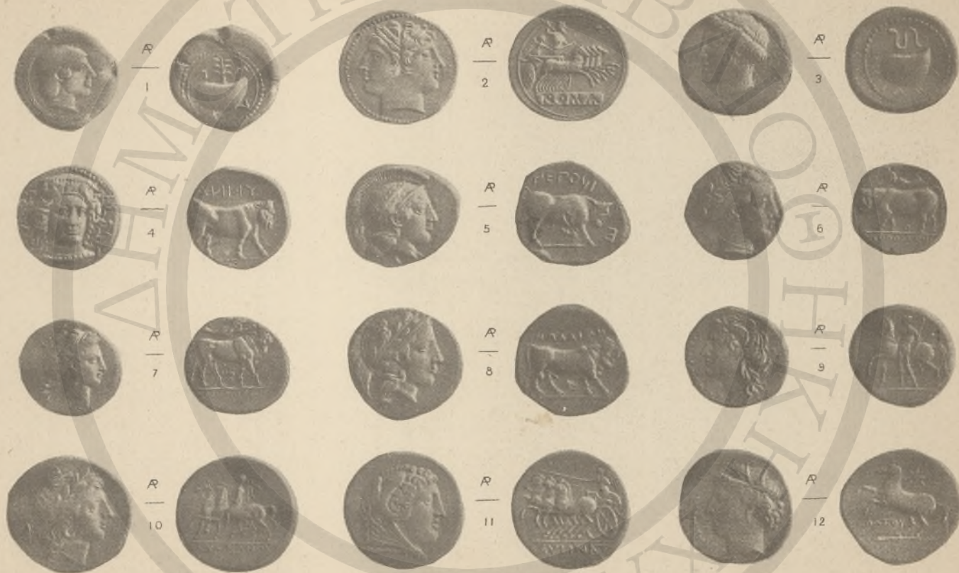
ΚΑΜΠΑΝΙΑ. Ι-ΙΙ, (Α). ΑΠΟΥΛΙΑ. ΙΖ.