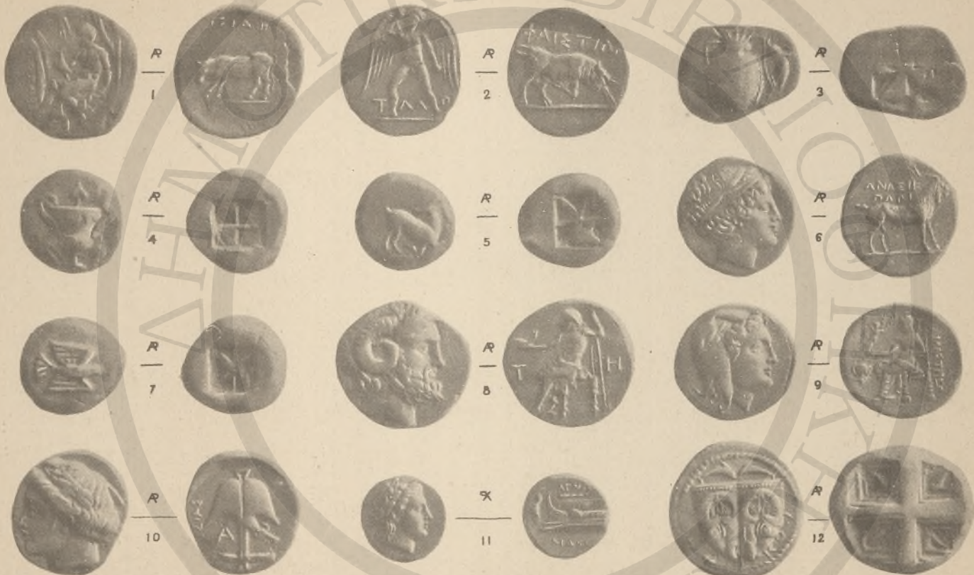
ΚΡΗΤΗ, 1-2 (ΚΑ! ΚΓ!).