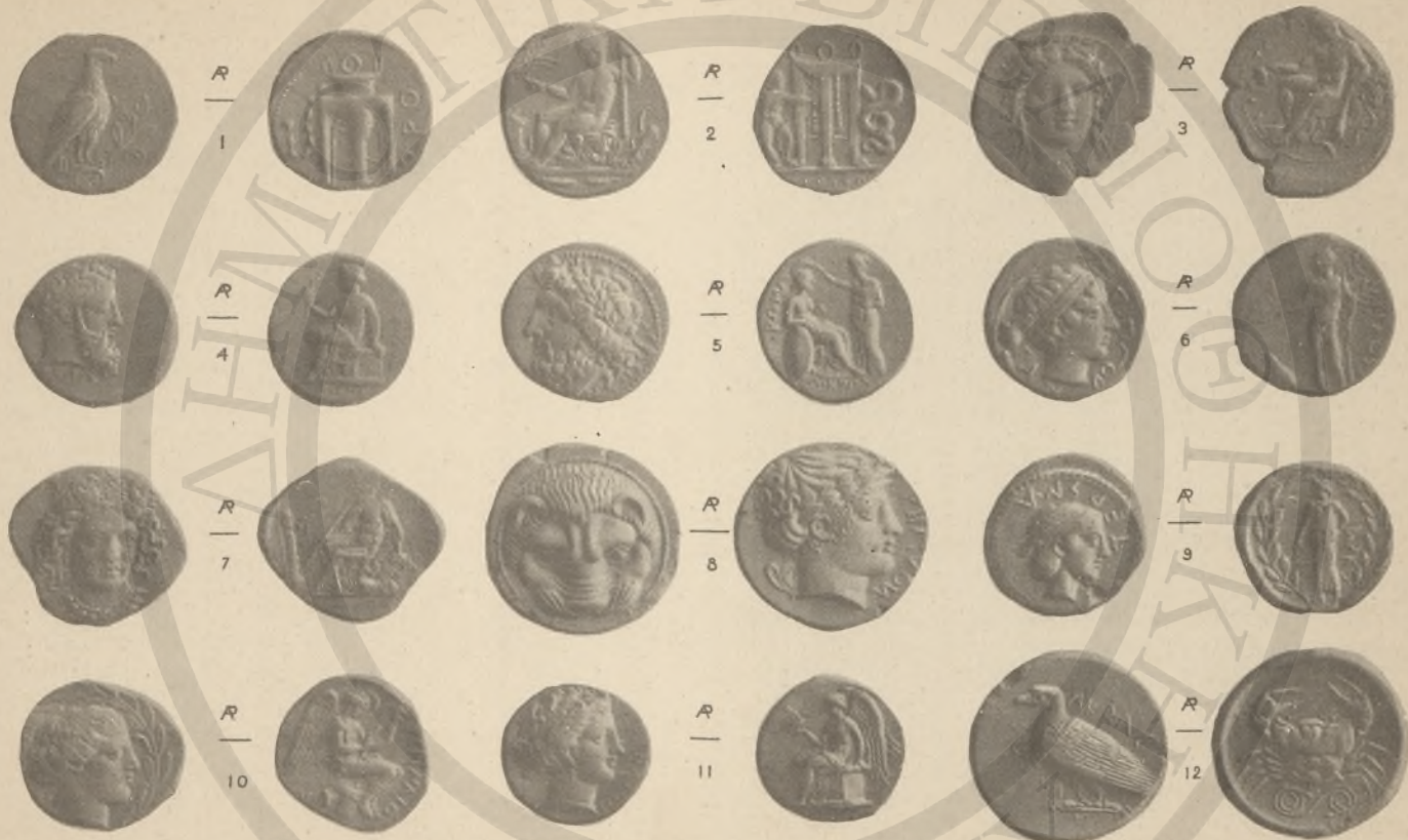
ΒΡΕΤΤΙΑ, 1-11, (Δ'Θ'). ΞΙΚΕΛΙΑ, 1, (ς'-1).