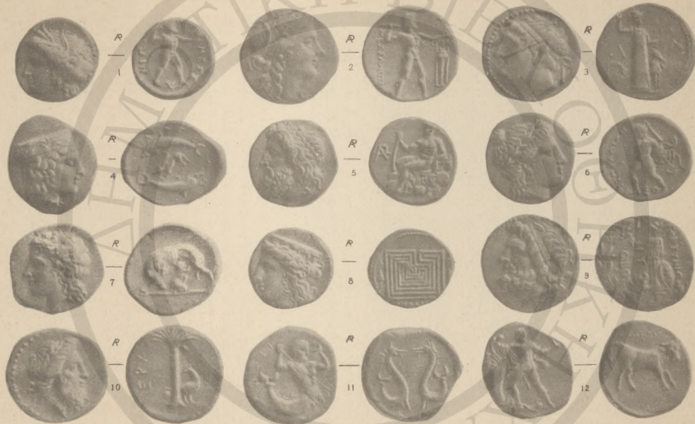
ΜΕΣΣΗΝΙΑ, 1-2. ΛΑΚΩΝΙΚΗ, 3. (ΚΓ!). ΑΡΓΟΛΙΣ, 4. ΑΡΚΑΔΙΑ, 5-6. ΚΡΗΤΗ, 7-12. (ΚΒ! ΚΓ!).