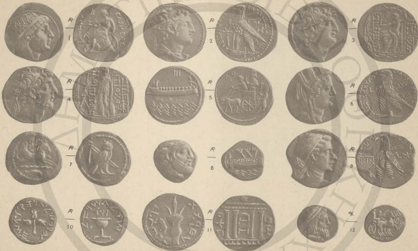
ΣΥΡΙΑ, 1-4, (ΚΙ΄ ΚΟ΄ ΛΓ΄). ΦΟΙΝΙΚΗ, 5-8, (ΚΟ΄ ΛΓ΄). ΙΟΥΔΑΙΑ, 9-11. ΠΑΡΘΙΑ, 12, (ΚΟ΄ Λ΄).