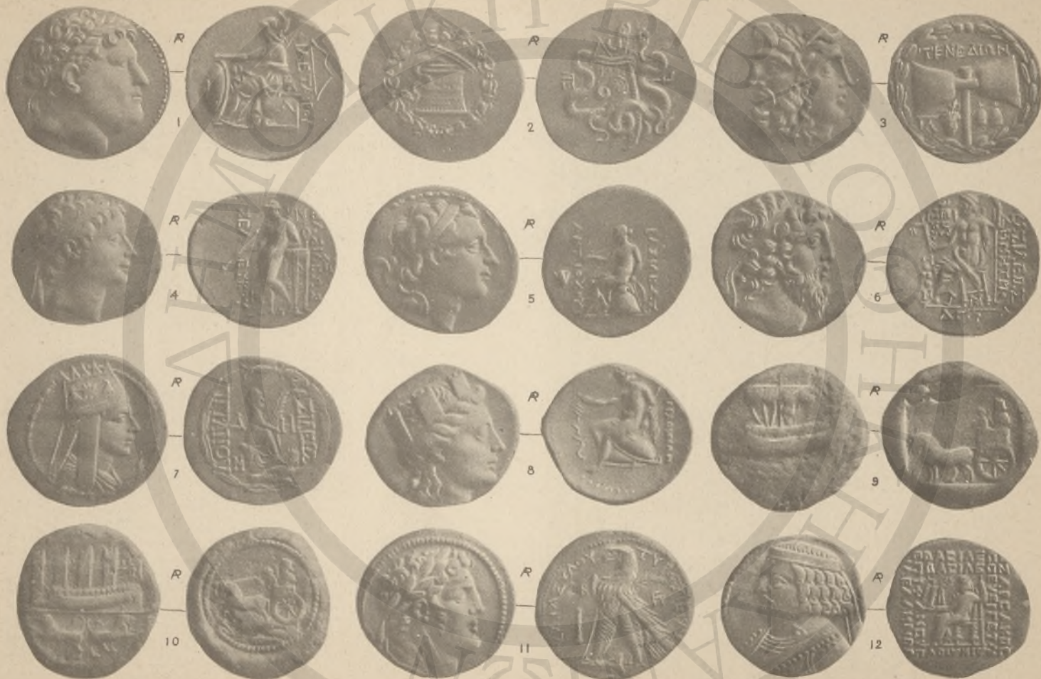
ΜΥΣΙΑ, 1-2, (ΚΒ: ΚΔ: ΛΒ:) ΝΗΣΟΙ ΤΡΩΑΔΟΣ, 3, ΞΥΡΙΑ, 4-7, (ΚΙ: ΚΗ: ΛΓ:). ΦΟΙΝΙΚΗ, 8-11, (ΚΗ: ΛΓ:). ΠΑΡΘΙΑ, 12, (ΚΗ: Λ).