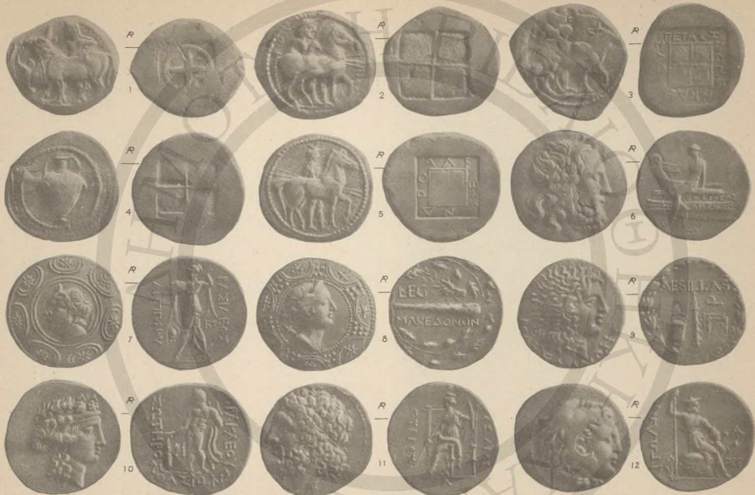
ΜΑΚΕΔΟΝΙΑ, 1-9, (1-1B: 10). ΝΗΣΟΙ ΘΡΑΚΗΣ, 10, (1Γ'). ΗΠΕΙΡΟΣ, 11, (1Ε!). ΑΙΤΩΛΙΑ, 12.