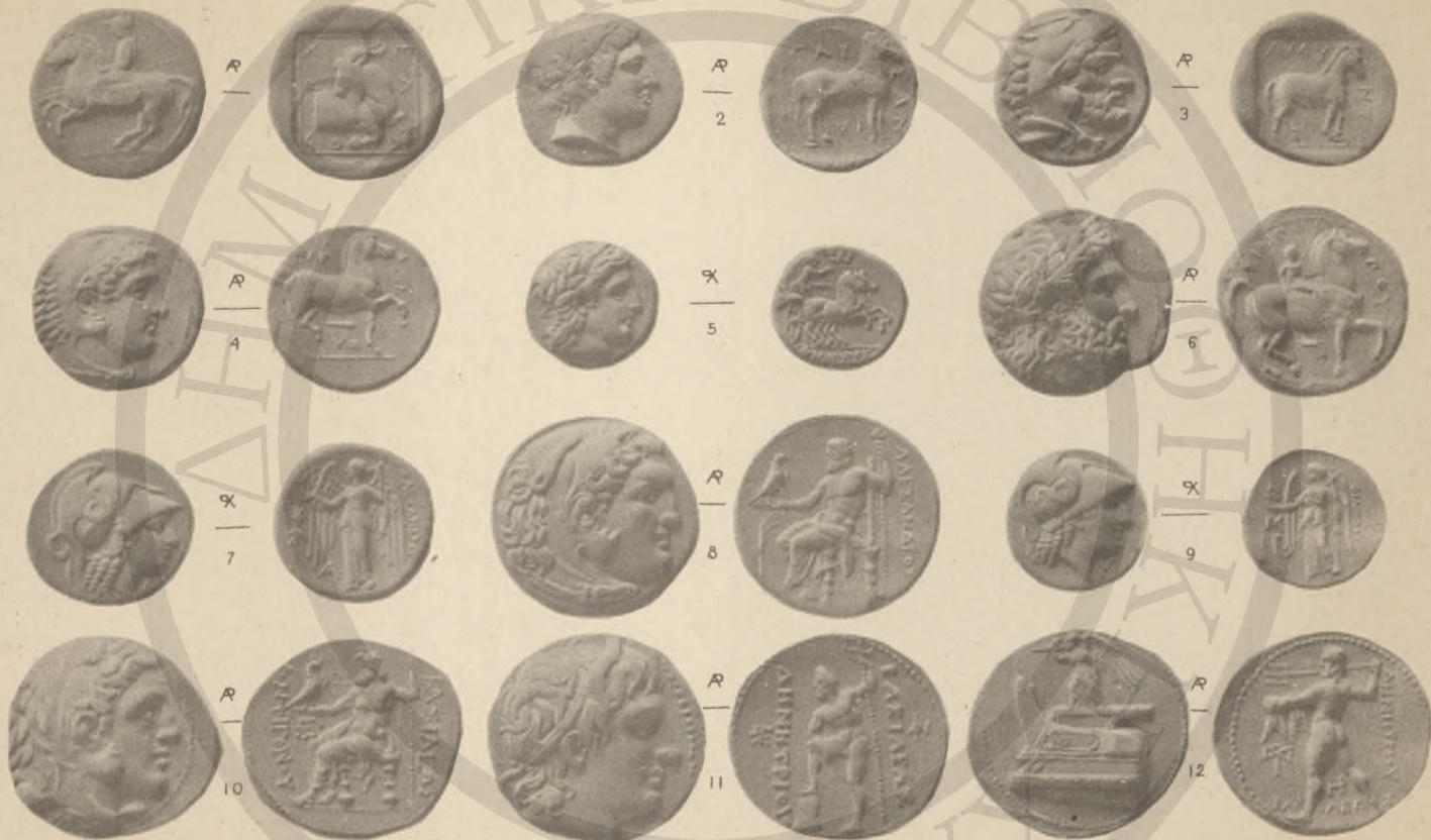
ΜΑΚΕΔΟΝΙΑ, 1-12, (Η΄:11Α΄:15΄:10).