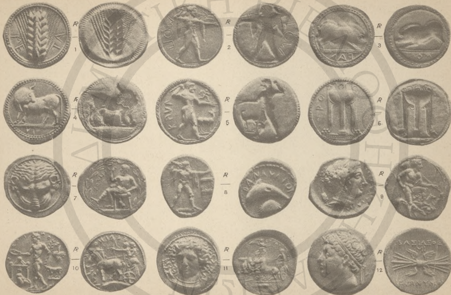
ΛΕΥΚΑΝΙΑ, 1-4, (Γ'Δ'). ΒΡΕΤΤΙΑ, 5-7, (Δ'Ε'). ΞΙΚΕΛΙΑ, 8-12, (Ε'-Η' και Ι').