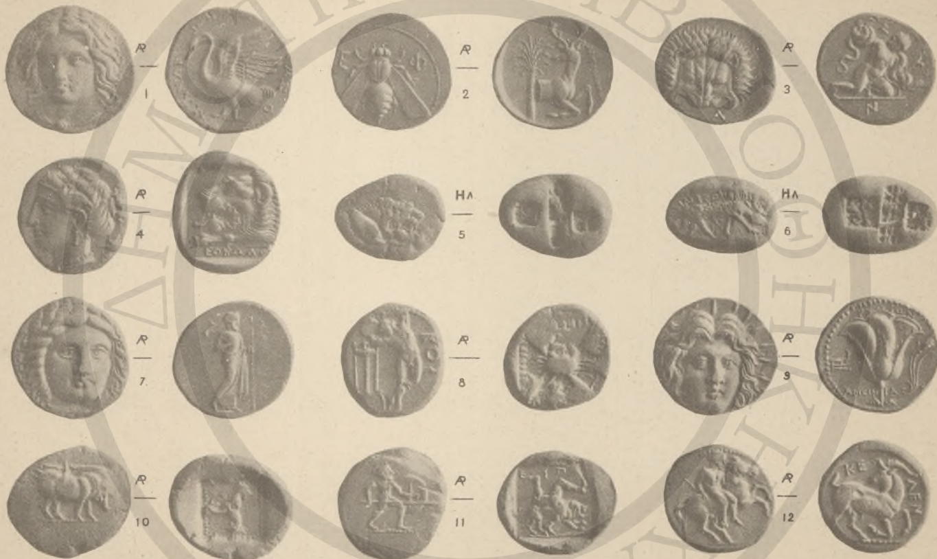
ΙΩΝΙΑ, 1-2, 5, (ΚΔ! ΚΓ! Λ!). ΞΑΜΟΣ, 3. ΚΑΡΙΑ, 4, 6-7, (ΛΑ! ΛΒ!). ΚΩΞ, 8. ΡΟΔΟΣ, 9 (ΚΔ!). ΛΥΚΙΑ, 10, (ΛΑ!). ΠΑΜΦΥΛΙΑ, 11, (ΛΓ) ΚΙΛΙΚΙΑ, 12, (ΚΙ!)