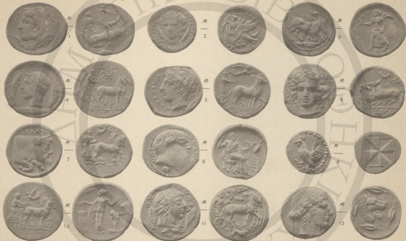
ΞΙΚΕΛΙΑ, 1-12, (Ε' ΚΑΙ Ι'-Ι')