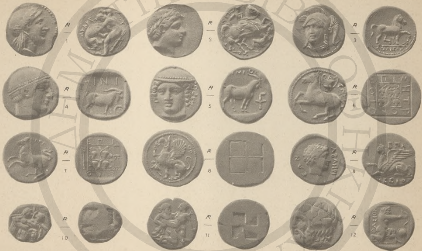
ΠΑΙΟΝΙΑ, 1-3. ΘΡΑΚΗ, 4-9. (ΙΔ'). ΝΗΣΟΙ ΘΡΑΚΗΣ, 10-12. (ΙΣ').