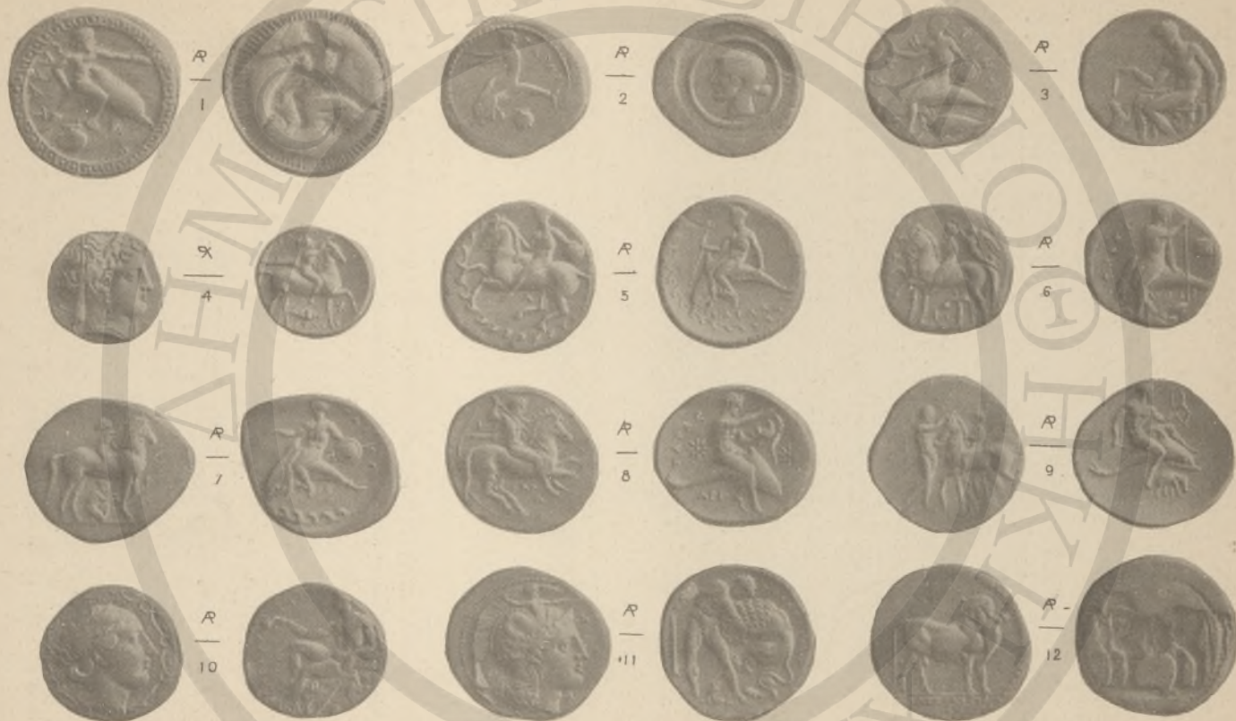
ΚΑΛΑΒΡΙΑ, 1-9. ΛΟΥΚΑΝΙΑ, 10-12. (Δ:Θ')