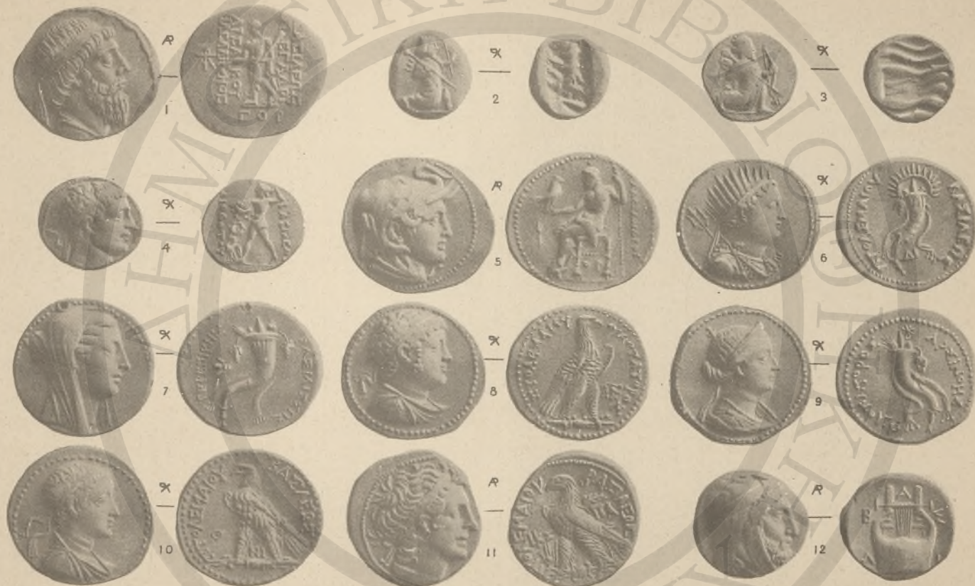
ΠΑΡΘΙΑ, 1 (ΚΒ! ΚΘ!). ΠΕΡΣΙΑ, 1-3. ΒΑΚΤΡΙΑ ΚΑΙ ΙΝΔΙΚΗ 4 (ΛΑ! ΛΓ! ΛΔ!) ΑΙΓΥΠΤΟΣ, 5-11, (ΛΑ! ΛΔ! ΛΕ!) ΙΩΝΙΑ, 12, (ΚΔ! ΚΕ! ΚΖ! Λ)