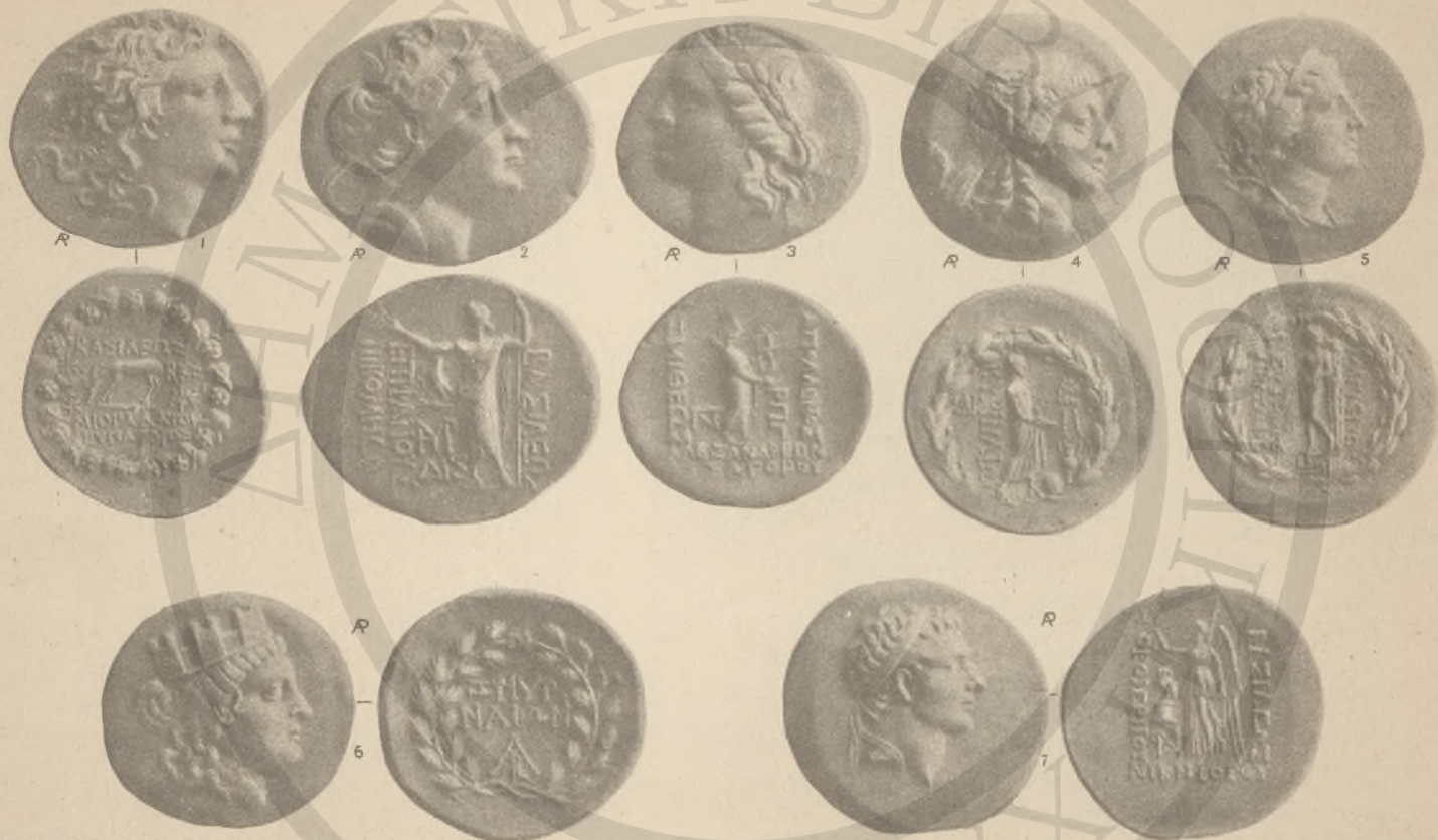
ΠΟΝΤΟΣ, 1,(ΚΓ'). ΒΙΘΥΝΙΑ, 2,(ΚΙ') ΤΡΩΑΣ, 3,(ΚΔ'ΛΒ') ΑΙΟΛΙΣ, 4 ΓΩΝΙΑ, 5-6(ΚΔ'ΚΕ'ΚΣ'Λ') ΚΑΠΠΑΔΟΚΙΑ, 7,(ΛΒ').