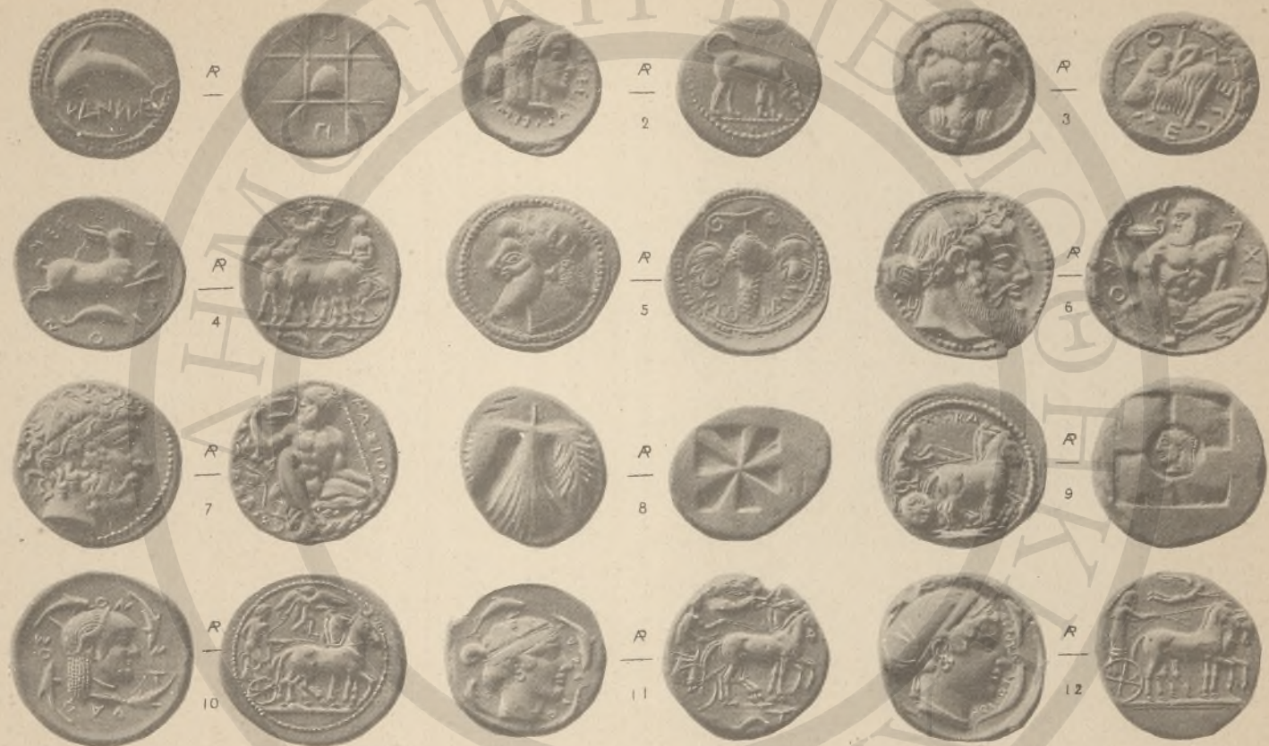
ΣΙΚΕΛΙΑ, 1-12, (Ε' 5' Η'-1').