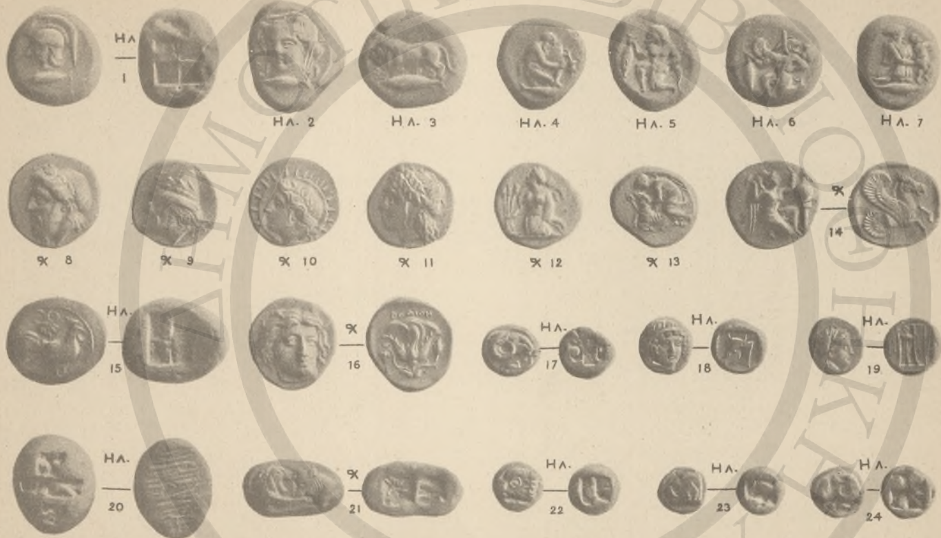
ΜΥΞΙΑ, 1-14 (ΚΒ'ΚΘ'ΛΒ). ΤΡΩΑΣ, 15, (ΛΒ). ΛΕΣΒΟΣ, 17-19. ΙΩΝΙΑ, 22-24 (ΚΕ'ΚΖ'Λ). ΡΟΔΟΣ, 16, (ΚΕ). ΛΥΔΙΑ, 20-21.