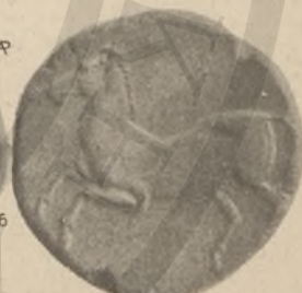
ΒΑΚΤΡΙΑ ΚΑΙ ΙΝΔΙΚΗ, 1-3. (Λ'ΛΑ'ΛΓ). ΑΙΓΥΠΤΟΣ, 4. (Λ'ΛΑ'ΛΔ'). ΣΕΥΓΙΤΑΝΙΑ, 5-6. (ΚΙ'ΛΔ').