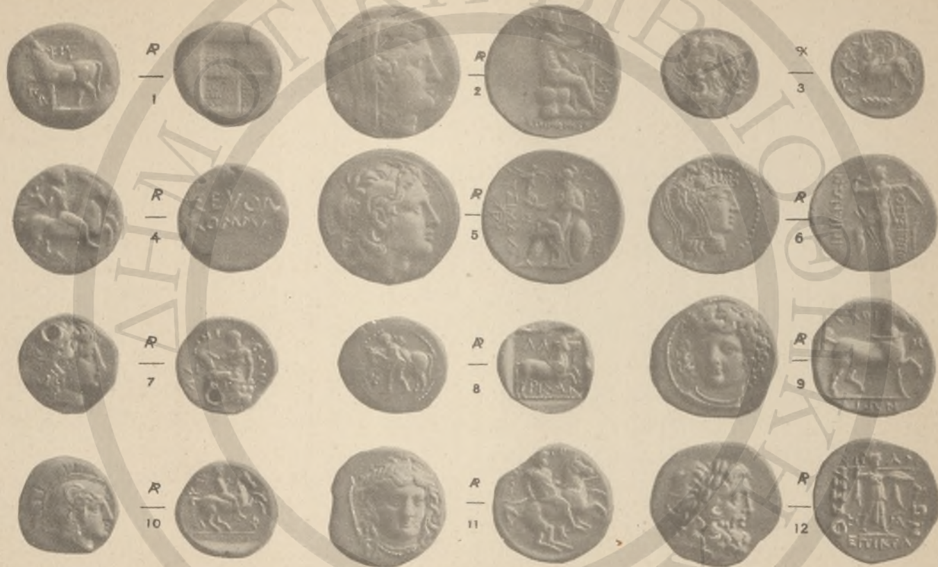
ΘΡΑΚΗ, 1-2 ΚΑΙ 4-5. (ΙΓ' ΙΟ' ΛΒ'), ΤΑΥΡΙΚΗ ΧΕΡΣΟΝΗΣΟΣ, 3. ΘΕΣΣΑΛΙΑ, 6-12.