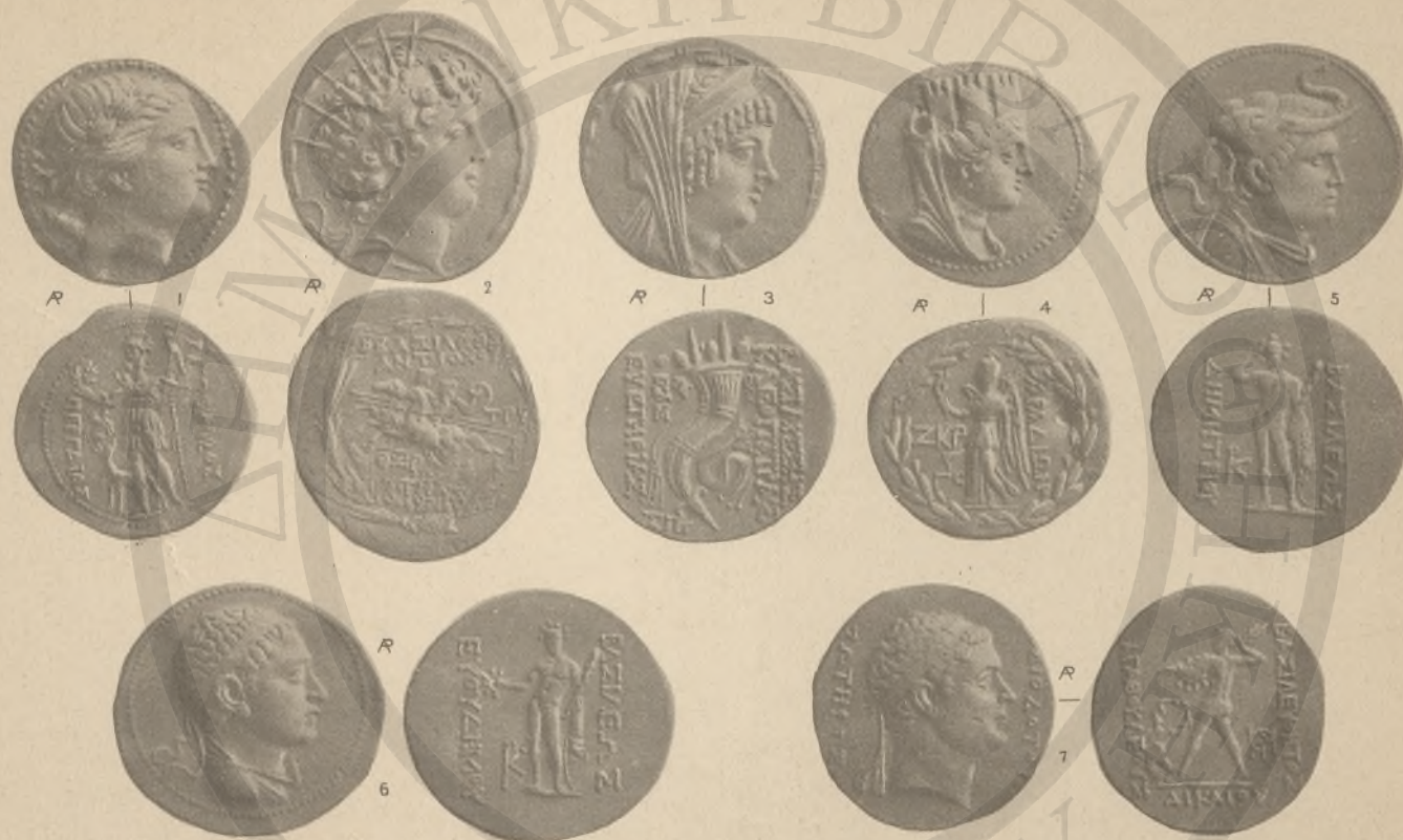
ΠΑΜΦΥΛΙΑ, 1, (ΚΕ!) ΞΥΡΙΑ, 2-3, (ΚΙ!-ΚΘ). ΦΟΙΝΙΚΗ, 4, (ΚΗ! ΚΟ!). ΒΑΚΤΡΙΑ ΚΑΓΙΝΔΙΚΗ, 5-7 (Λ! ΛΑ! ΛΕ!).