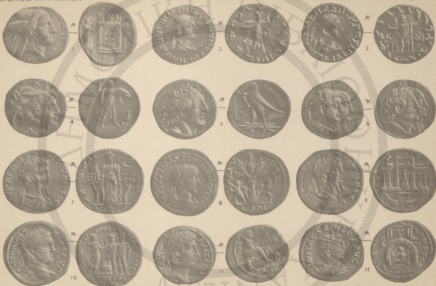
ΠΕΡΙΞ. 1. ΒΑΚΤΡΙΑ ΚΑΙ ΙΝΔΙΚΗ, 2-3, (Λ' ΑΓ ΛΕ'). ΑΙΓΥΠΤΟΣ, 4-6, (Λ' ΛΔ'). ΚΑΡΙΑ, 7, (ΚΕ' ΛΒ'), ΛΥΚΙΑ, 8, (ΚΕ'), ΚΥΠΡΟΣ, 9, (ΚΙ'). ΓΑΛΑΤΙΑ, 10. ΞΕΛΕΥΚΙΣ ΚΑΙ ΠΙΕΡΙΑ, 11. ΚΟΙΛΗ ΞΥΡΙΑ, 12.