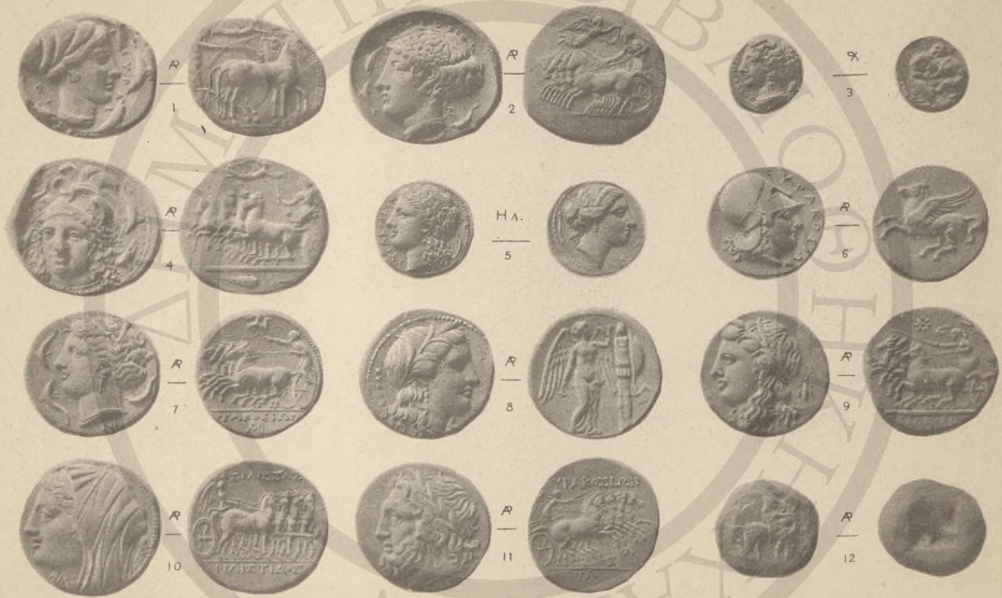
ΞΙΚΕΛΙΑ, 1-11, (Ε'-Ι'. Θ'-Ι'), ΜΑΚΕΔΟΝΙΑ, 12, (ΙΣΙΑ, ΙΣ' ΙΘ).