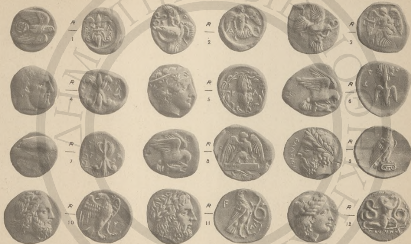
ΗΛΙΞ. I-II, ΙΑΚΥΝΘΟΣ. 12.