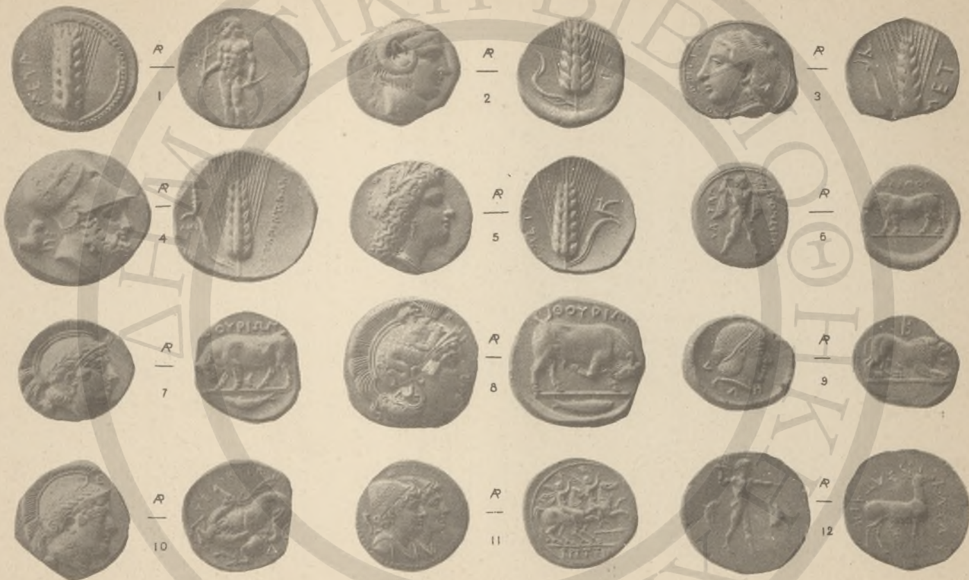
ΛΟΥΚΑΝΙΑ, 1-10, (Γ'Θ) ΒΡΕΤΙΑ, 11-12, (Ε'Θ).