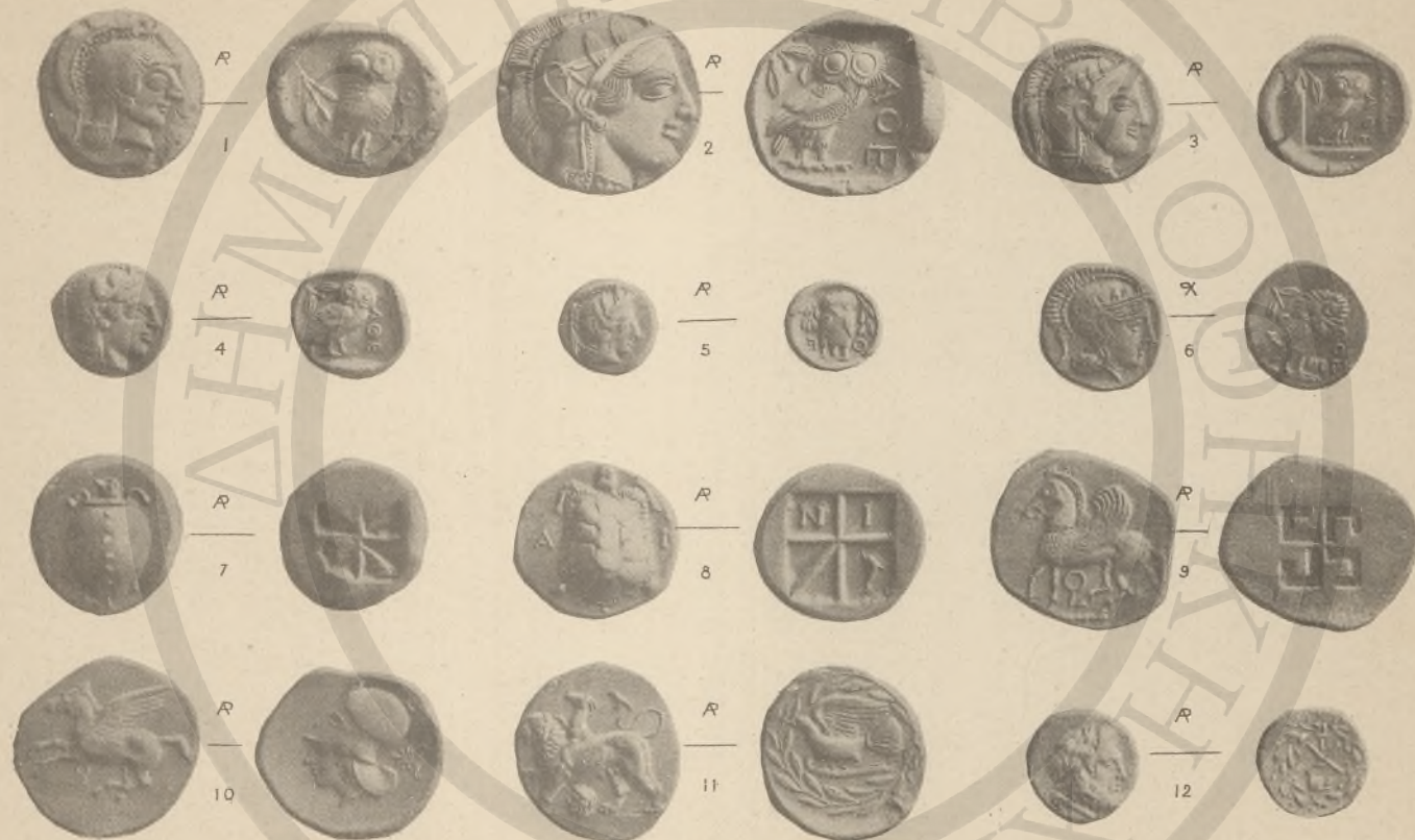
ΑΤΤΙΚΗ, 1-6, (10'). ΑΙΓΙΝΑ, 7-8. ΚΟΡΙΝΘΙΑ, 9-10. ΞΙΚΥΩΝΙΑ, 11. ΑΧΑΪΑ, 12.