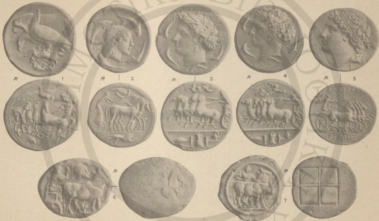
ΣΙΚΕΛΙΑ, 1-5, (Ε'-Θ'), ΜΑΚΕΔΟΝΙΑ, 6-7, (1Α' 1Β' 1Γ' 1Δ').